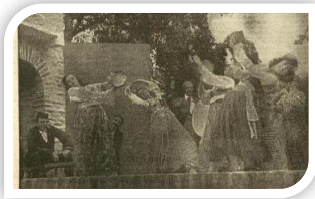
Slika 3. Scena letnjeg pozorišta na Kalemegdanu