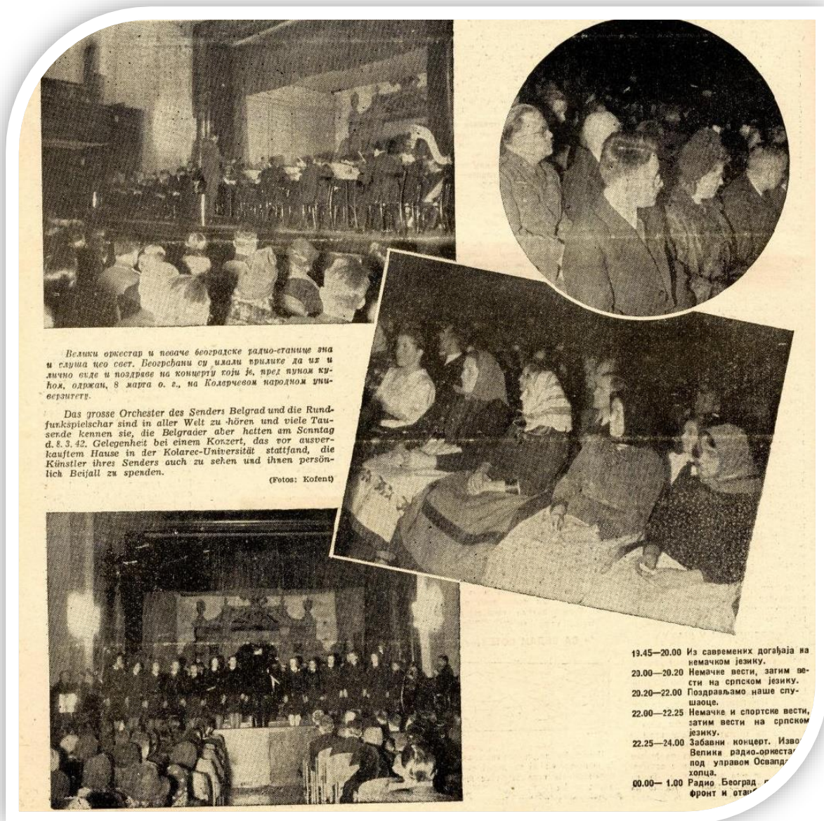
Slika 5: Veliki orkestar VRB-a sa gostujućim seljacima u publici, KNU, 8. marta 1942.