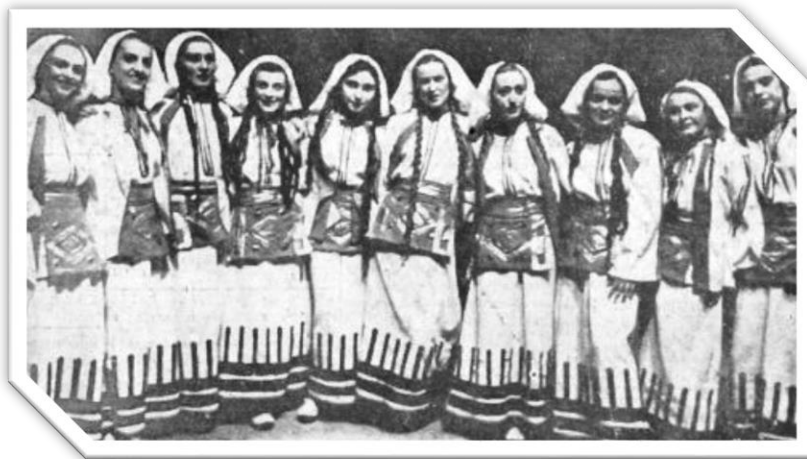
Slika 4. Sa premijere baleta Oganj u planini Pordesa, 1941 ( Време , 15. II 1941)

Insistiranje na obnovi u instituciji koja je više od decenije, ali i sa tadašnjim kadrom zavisila od značajnog broja ruskih umetnika, koji su pak, važili za poznavaoce „srpskog“ ili „južnosrbijanskog“ folklor, bilo je očigledan dokaz nemogućnosti i nedovoljne upućenosti srpskih kolaboracionista u konkretne probleme pozorišta i kulture u Beogradu. Takođe, prebegli muzičko-scenski umetnici u partizane ustvari su uveliko utemeljili ne samo rad u godinama pred nemačku okupaciju Beograda nego baš i profesionalizaciju odnosa prema nemačkom repertoaru.