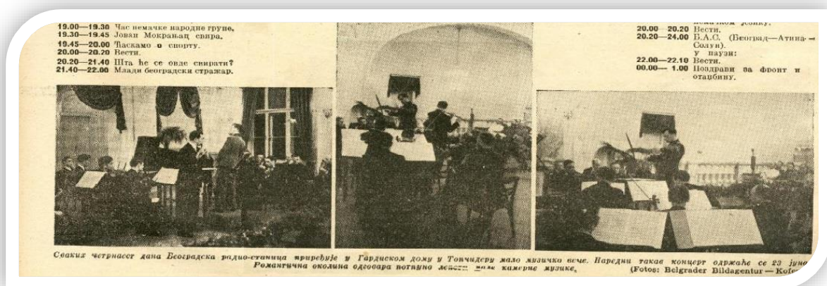
Slika 2. Kamerni koncert u Gardijskom domu u Topčideru

Konkretne muzičke izvedbe započele su već krajem proleća 1941. kako u zatvorenim prostorima, kao što su velika koncertna sala KNU-a i nešto manja sala Muzičkog društva „Stanković“ u tadašnjoj ulici Franca Ferdinanda (današnji početak Kneza Miloša), zatim, beogradske kafane, restorani i hoteli, a leti i na otvorenom – na Kalemegdanu, posebno na letnjoj sceni, ali i u Topčideru u Gardijskom domu gde su održavani koncerti kamernе muzike, kao i na ulicama Beograda (upor. Vasiljević, 2015). 288