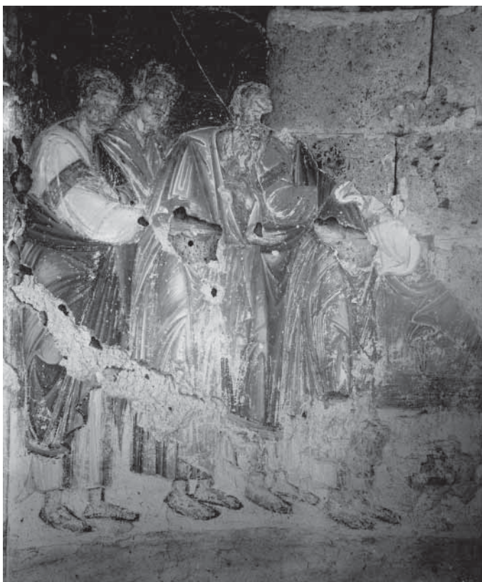
Сл. 2. Причешће аџосџола, олџарска аџсида, северни зид Fig. 2. Communion des Apôtres, abside du sanctuaire, mur nord

првог с јужне стране, носе у рукама развијене свитке са исписаним текстовима молитава. 11 Јужни део поворке предводи архијереј који, дакле, десном руком благосиља, а у левој држи савијен свитак. До њега је приказан свештенослужитељ с развијеним ротулусом, на којем је исписан текст прве молитве верних из Лиџургије Васиљуа Великог: tq< >gospodi> <po-kaz-a>lq <amq veli-kou> si } sp(a)se(ni)] . 12 Последњи у низу на јужној страни приказан је архијереј на чијем раширеном свитку (сл. 5) стоји текст молитве Трисвџе џесме: b(o/)e s(ve)tql i na s(ve)tQhq po; iva(E[i] . 13 Први од тројице архијереја на северном зиду носи свитак с почетком молитве коју свештеник чита за време појања Херувимске џесме: <nikto\ e> dostoinq sqveza<vq[ihq s> . 14 Архијереј који следи држи