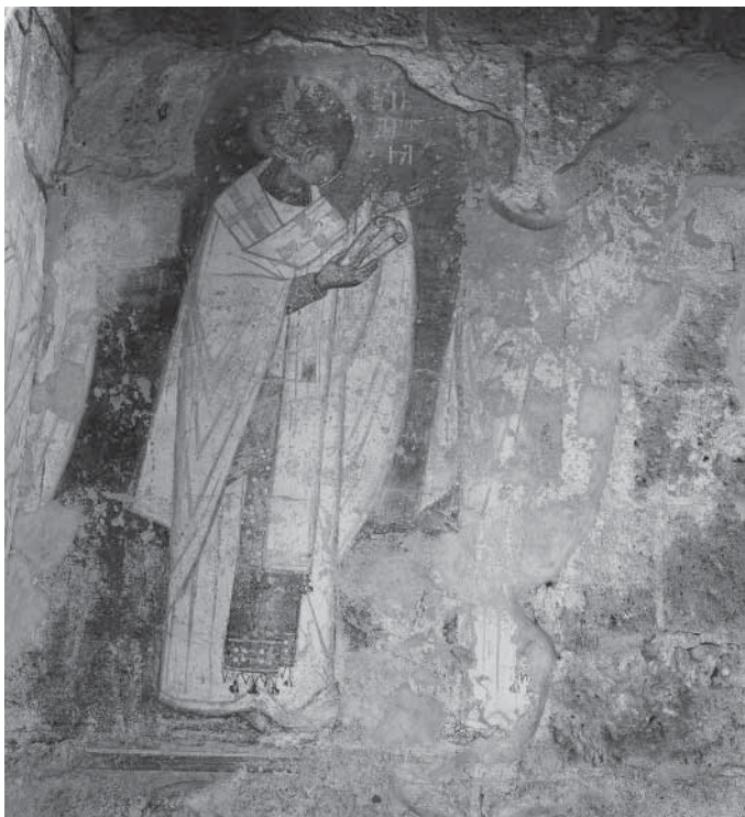
Сл. 6. Свети Андреја, архиепископ кријски, проскомидија, северни зид Fig. 6. Saint André l'archevêque de Crète, proscomidie, mur nord