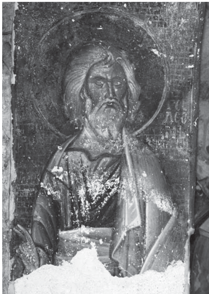
Сл. 16. Пророк Геден Fig. 16. Prophète Gédéon

Декорацију градачког олтару, у складу с раније успостављеном традицијом, чине теме чији су избор и размештај познати из старије византијске уметности, али и из сликаног програма других српских цркава XIII века. Ипак, у оквиру уметности свог времена живопис у градачком олтару показује и нека особена решења. Појава фигура архијереја у истој зони с представом Причешћа није необична, мада је реч о ређе примењиваном реше-