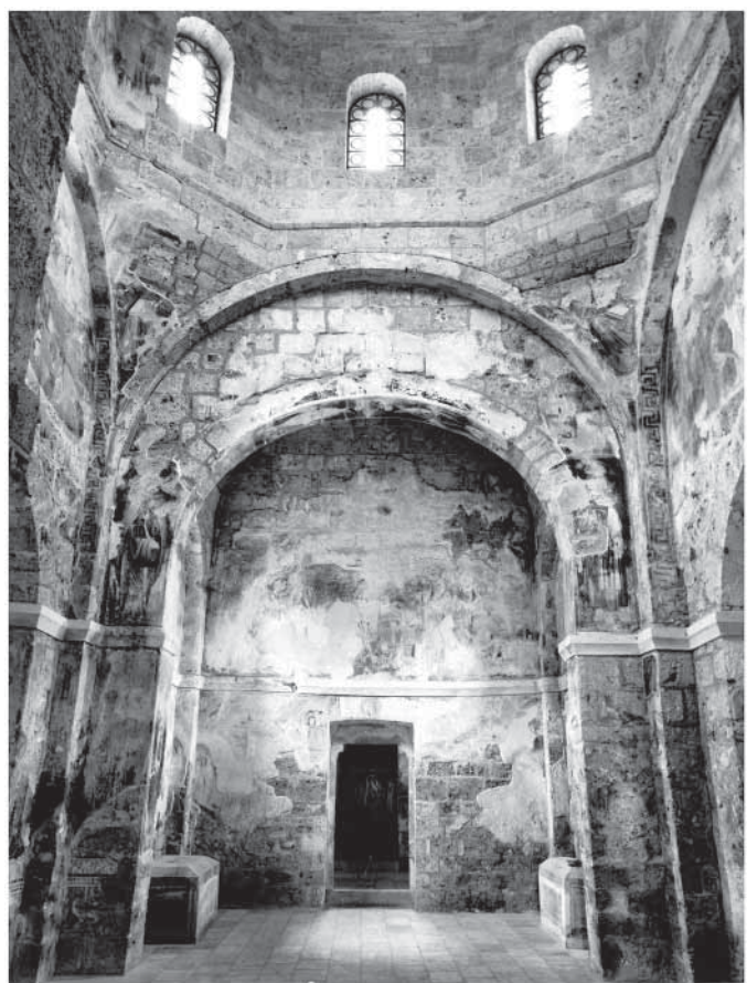
Сл. 7. Поглед на западни зид западног травеја Fig. 7. Vue sur le mur ouest de la travée occidentale

у Јерусалим. 29 Композиција Васкрсења Лазаревог, због прозорског отвора подељена на два дела, насликана је на северном зиду западног травеја, 30 а на источној страни тог простора налазила се композиција Преображења, о