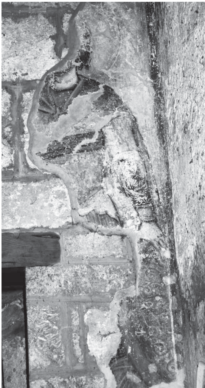
Сл. 9. Свети Прокопије, источни зид јужне певнице Fig. 9. Saint Procope, paroi Est du transept sud

У другој зони јужног зида јужне певнице очувани су веома оскудни фрагменти фреске, у којима је недавно идентификована представа Мирносица на Христовом гробу, 35 првобитно, по свему судећи, подељена прозорским отвором на два дела.