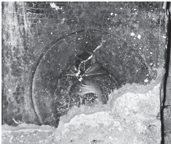
Сл. 17. Пророк Данило Fig. 17. Prophète Daniel

Са становишта програма вредна је пажње недавно идентификована представа Мирносица на Христовом гробу на јужном зиду јужне певнице. Како поменуто композиција указује заправо на Васкрсење Христово, та сцена неретко је сликана у оквиру Великих празника, и то често у непосредној близини Силаска у ад као другог начина приказивања најважнијег хришћанског празника, 95 али и у склопу циклуса Страдања и посмртних јављања Христових. 96 Пре живописања Градца пред-