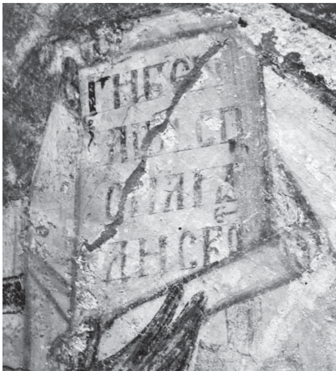
Сл. 4. Свѣћак у рукама архијереја, олѣтарска апсида, северни зид