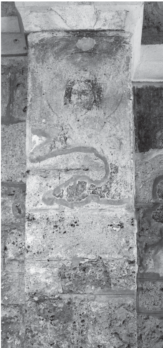
Сл. 11. Свети Алексје Божији човек, северозападни пиластар наоса Fig. 11. Saint Alexis l'Homme de Dieu, pilastre Nord-Ouest du naos

ске групе насликане у градачком наосу и препознати њихове представнике. Ради лакшег сагледавања најпре ће бити речи о фигурама светитеља насликаним у најнижој зони зидова и пиластара, а потом о онима које су сачуване у горњим регистрима, то јест у другој и трећој зони наоса градачког храма.