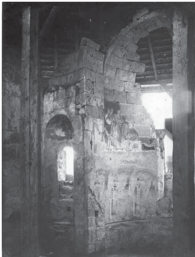
Сл. 3. Олџарски џросџор Fig. 3. Le sanctuaire

првог с јужне стране, носе у рукама развијене свитке са исписаним текстовима молитава. 11 Јужни део поворке предводи архијереј који, дакле, десном руком благосиља, а у левој држи савијен свитак. До њега је приказан свештенослужитељ с развијеним ротулусом, на којем је исписан текст прве молитве верних из Лиџургије Васиљуа Великог: tq< >gospodi> <po-kaz-a>lq <amq veli-kou> si } sp(a)se(ni)] . 12 Последњи у низу на јужној страни приказан је архијереј на чијем раширеном свитку (сл. 5) стоји текст молитве Трисвџе џесме: b(o/)e s(ve)tql i na s(ve)tQhq po; iva(E[i] . 13 Први од тројице архијереја на северном зиду носи свитак с почетком молитве коју свештеник чита за време појања Херувимске џесме: <nikto\ e> dostoinq sqveza<vq[ihq s> . 14 Архијереј који следи држи