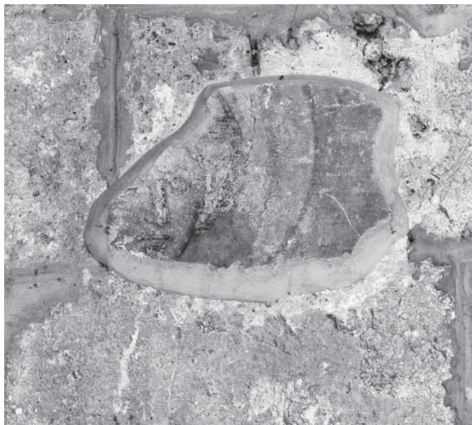
Сл. 8. Свети Ђорђе, источни зид јужне њевнице Fig. 8. Saint Georges, paroi Est du transept sud

у Јерусалим. 29 Композиција Васкрсења Лазаревог, због прозорског отвора подељена на два дела, насликана је на северном зиду западног травеја, 30 а на источној страни тог простора налазила се композиција Преображења, о