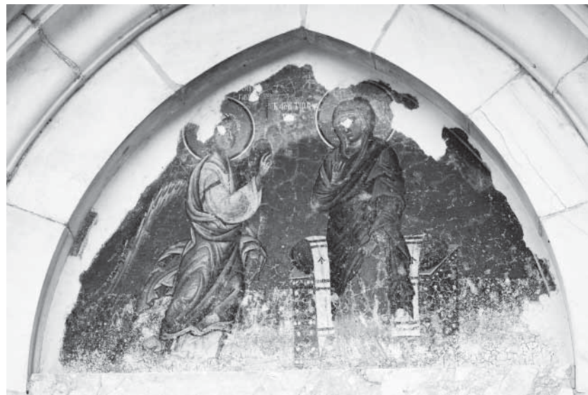
Сл. 18. Благовесџи Fig. 18. Annonciation

На крају се може закључити да су у сликаном програму градачког храма избор и распоред појединих тема преузети из старијих немањихких задужбина (понављање, уз мања одступања, студеничког распореда циклуса Великих празника, одабир светитељских ликова који су