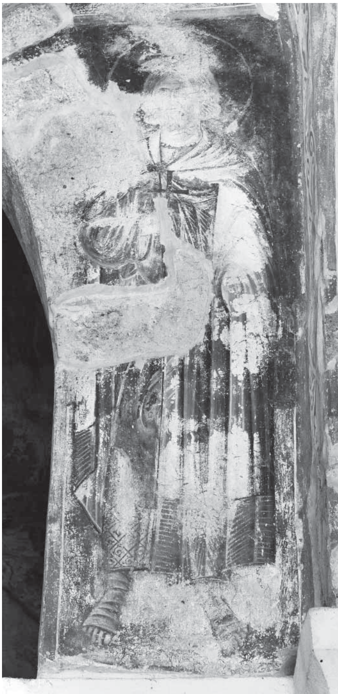
Сл. 13. Свѣти Авксентије Fig. 13. Saint Auxence

I, који, с краљицом Јеленом, својом супругом, придржава модел градачке цркве. Део те композиције чине и три портрета насликана на странама јужног пиластра и веома оштећена. 56