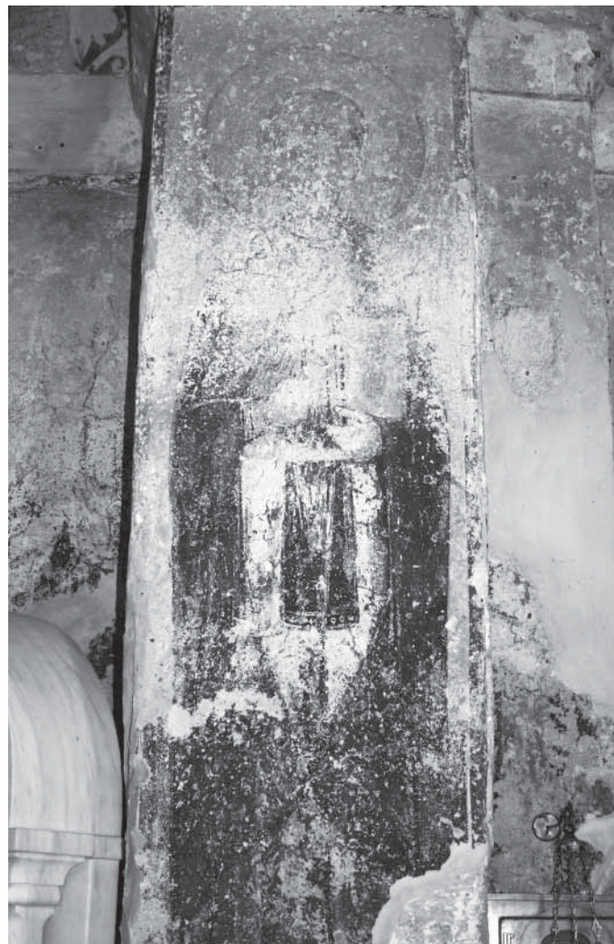
Сл. 10. Свети Јован Каливић, југозападни пиластар наоса Fig. 10. Saint Jean Kalybitès, pilastre Sud-Ouest du naos

У доњој зони западног и северног зида западног травеја налазе се остаци три композиције, оштећене у великом степену. На јужној и северној страни западног зида (сл. 7) приказане су сцене које су по структури међусобно врло сличне, будући да обе представљају пренос моштију неке личности. 38 Најслабије је очувана трећа представа, смештена на северни зид западног травеја, која приказује смрт или опело неке личности. 39 Те композиције, несумњиво значајне за датовање и разумевање градачког живописа у целини, идентификоване су у досадашњој литератури на различите начине. 40 Нажа-