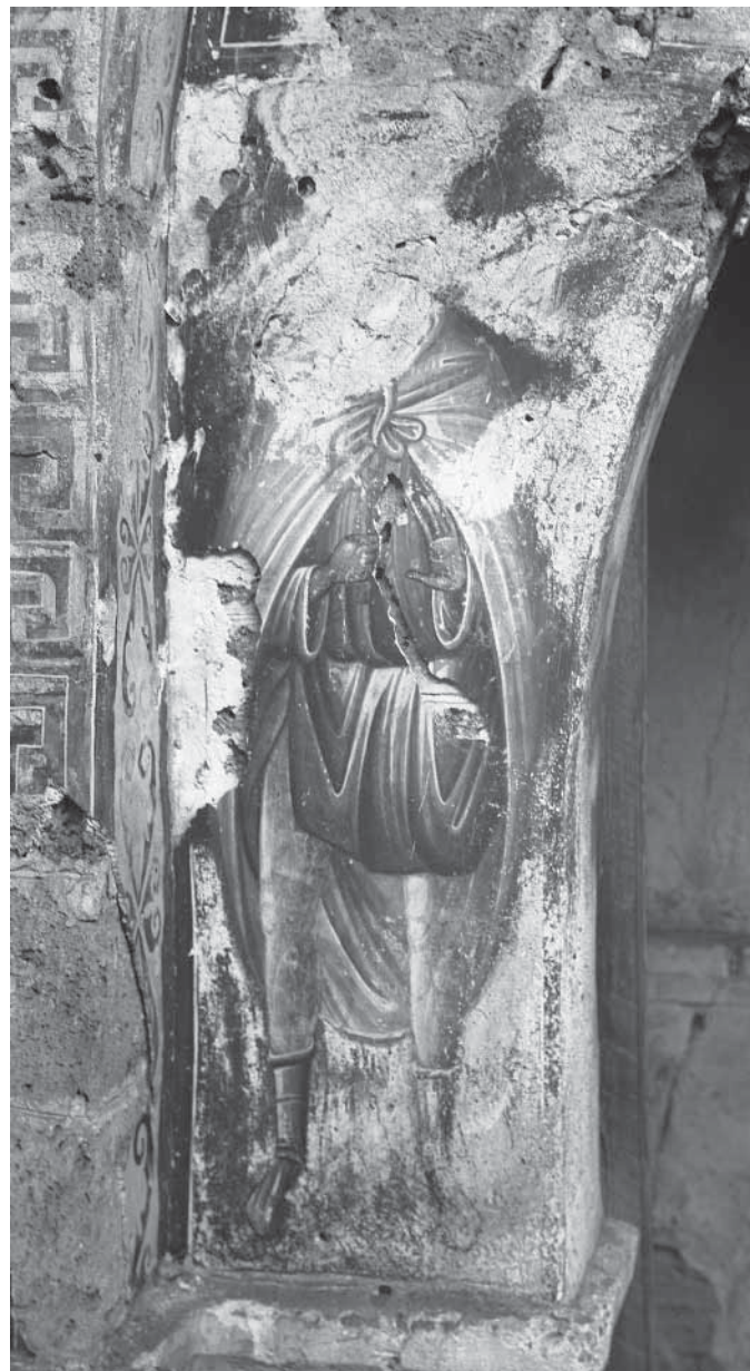
Сл. 12. Свети Мардарије Fig. 12. Saint Mardaire

На чеаној страни југозападног пиластра, у лику младића без бркова и браде, одевеног у великосхимничку одећу и представљеног са особеним атрибутом — књигом у руци — може се препознати свети Јован Каливит (сл. 10). 50 Наспрам њега, дакле на чеаној страни северозападног ступца, приказана је фигура од које је сачуван само фрагмент горњег дела главе с нимбом, као и скромни делови одеће. На основу изгледа тог светог, како ћемо видети касније, може се закључити да је реч о Алексију Божијем човеку (сл. 11). 51 На јужној страни северозападног испуста и на западној страни југоисточног испуста представљени су свети столпници, али идентитет њихових фигура и даље остаје неизван. У лику млађег светитеља краће, заобљене браде и с кукулом на глави, насликаног у непосредној близини светилишта, дакле на истакнутом месту у храму, можда би се могао препознати свети Симеон Столпник, који је, судећи по сачуваним примерима, обично сликан са заобљеном краћом брадом. 52 На источној страни југозападног пиластра, непосредно изнад игуманског престола, приказана је стојећа фигура Богородице с малим Христом у левој руци, у иконографском типу познатом под називом Богородица Умиленија. 53 Исти иконографски тип Богородице насликан је, како ћемо видети, и у лунети портала који води из припрате у наос.