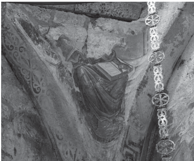
Сл. 1. Јеванђелиста, северозападни њанданџиф Fig. 1. Évangéliste, nord-ouest pendentif