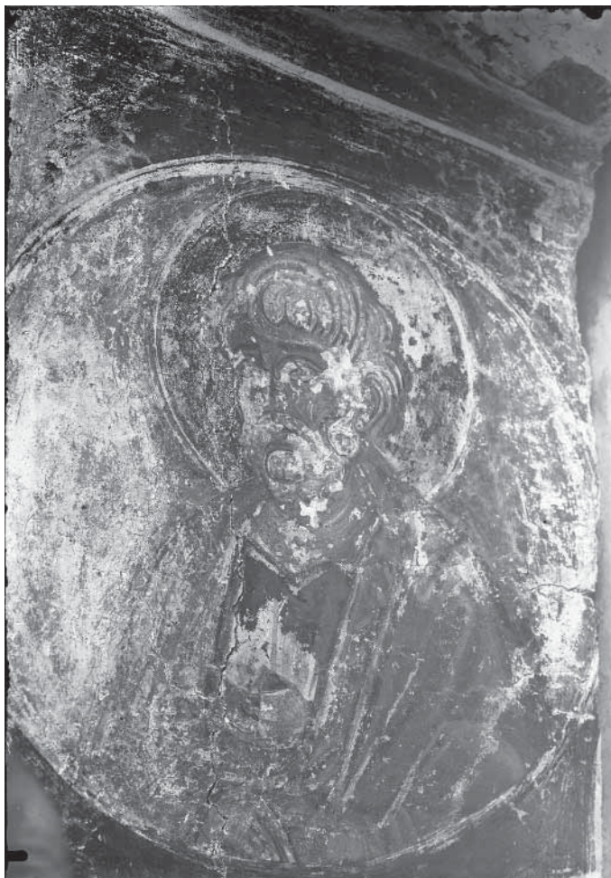
Сл. 14. Свети Петар Fig. 14. Saint Pierre

да су поједине сцене тог циклуса биле приказане не само на поменутим површинама већ и на горњем делу јужног зида и крстастом своду с ребрима, где је живопис сасвим уништен. 65 Знатна оштећеност живописа у горњој зони зидова градачке припрате, међутим, не дозвољава