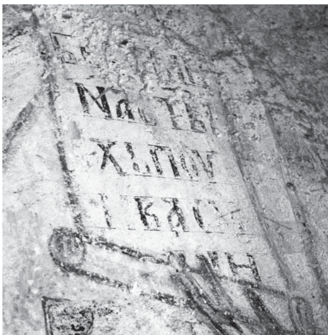
Сл. 5. Свѣћак у рукама архијереја, олѣтарска апсида, јужни зид