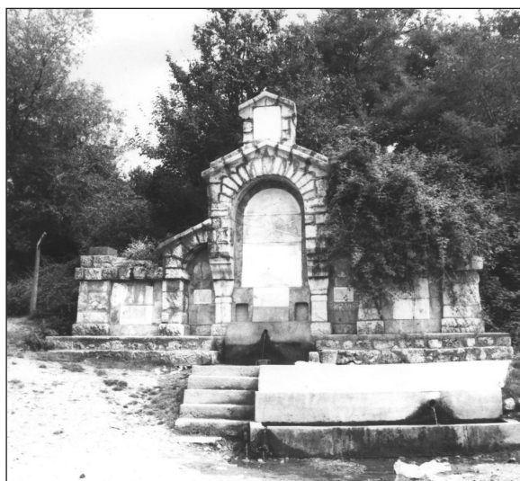
Сл. 5. „Студенац Косово”, Призрен, изглед из 1996.год.

Fountain "Kosovo", Prizren, look at the end 1912.god.