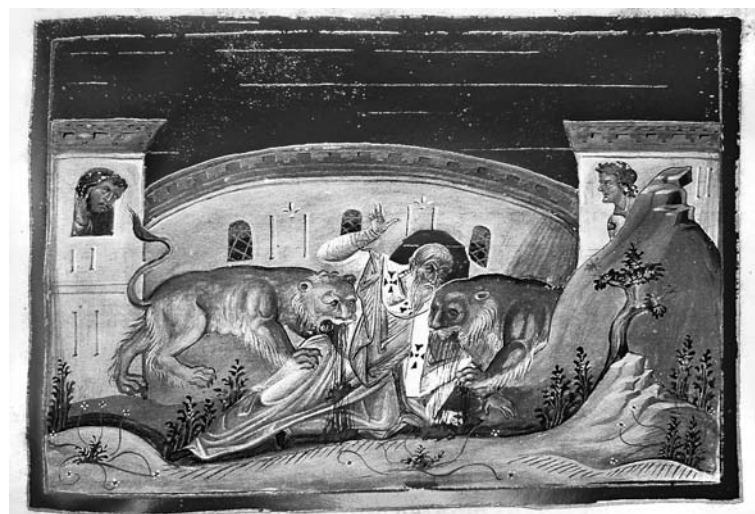
Сл. 2. Стрдање свејої Игњатија Боїноскога, Вайиканска библиотика, Менолог Василија II ( Vat. gr. 1613 , p. 258)

О томе да се композиције ове садржине понекад могу видети и ван Менолога, као сасвим самосталне, сведоче, поред хоповске фреске, византијска плочица од слоноваче у поседу приватног колекционара из Енглеске (каснi X / рани XI век), 25 минијатуре у два византијска псалтира – Теодоровом йсалтиру (Британски музеј, Add. 19352 , fol. 127 r , трећа четвртина XI века) и Псалтиру Барберини (Ватиканска библиотека, Barb. gr. 372 , fol. 162 v , позни XI век) 26 – затим фреске у цркви Христа Спаситеља манастира Свете Ефросиније у Полоцку (седма деценија XII века), 27 у трпезаријама светогорских манастира Ксенофонта (последња четвртина XV века), 28 Велике лавре (друга четвртина XVI века) 29 и Ставрониките (1545/1546), 30 у католикону несебарске Нове митрополије (црква Светог Стефана, око 1598/1599), 31 цркви Светог Ни-