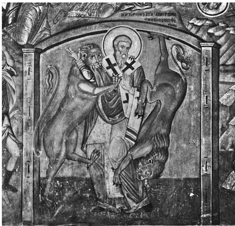
Сл. 5. Стїрадање свейїої Иї҃҃айїї҃ја Боїоноса, їриїрайїа манасїїра Куїїлумуша, Свейїа Гора