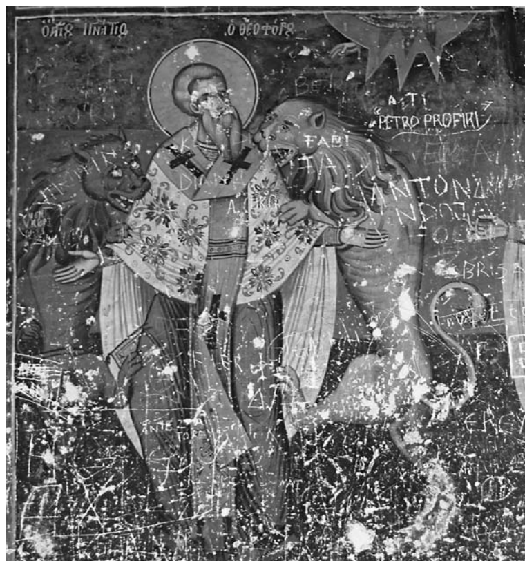
Сл. 12. Страдање светіої Игњатија Боіноскоца, ѿрем цркве Свеїої Николе у Мосхоїољу