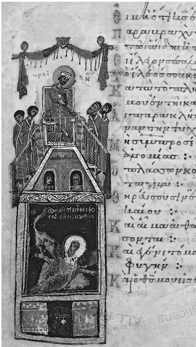
Сл. 9. Стрпанање свејої Игњатија Боїносоца, Ваїшканска библіоїтека, Псалїїр Барберини (Barb. gr. 372, fol. 162v) Fig. 9. Martyrdom of Saint Ignatius Theophorus, Biblioteca Apostolica Vaticana, Barberini Psalter (Barb. gr. 372, fol. 162v)

Истоветан положај тела и гест руку поглавар Антиохијске цркве има и на најранијој нама познатој монументалној слици Игњатијевог мучеништва сачуваној у староруском живопису. Реч је о засебном приказу те теме у католикону белоруског манастира Свете Ефросиније у Полоцку (сл. 10). 51 Представа се налази на источној половини свода пролаза из главног у јужни брод и од поменутих константинопољских илуминација одступа у следећим детаљима – недостају сведоци збивања (Трајан и његови пратиоци) и сликана архитектура, а лавови су распоређени само светом здесна.