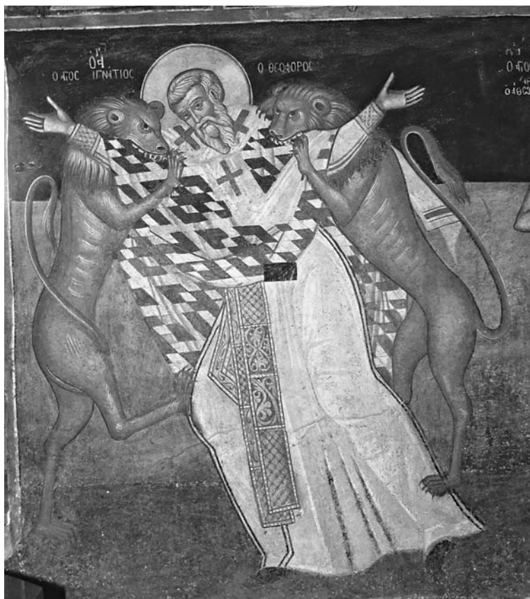
Сл. 11. Страдање светіої Игњатија Боіноскоца, ѿрїезарија манасїиѿра Ксенофонїиѿа, Свеїиѿа Гора