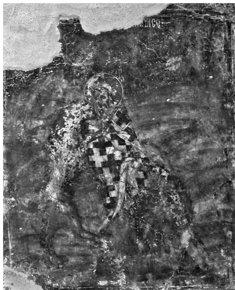
Сл. 13. Страдање светіої Игњатија Боіноскоца, оліѿарски ѿросїор цркве Свеїої Николе манасїиѿра Градишѿиѿа