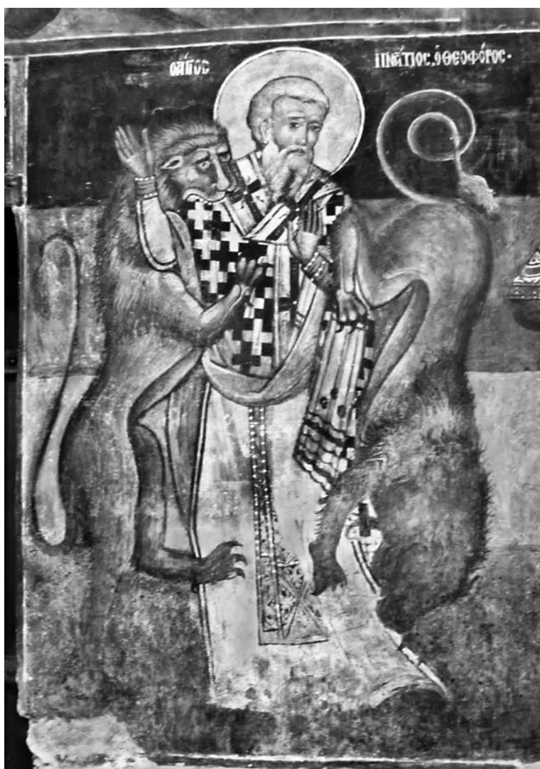
Сл. 6. Стїрадање свейїої Иї҃҃айїї҃ја Боїоноса, јужни зид јужної брода цркве Свейїої Стїефана у Несебару