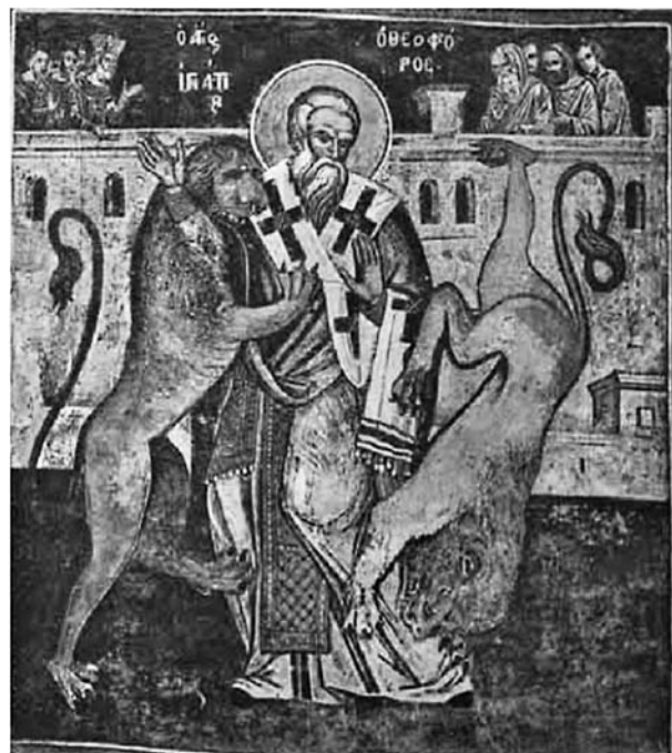
Сл. 4. Страдање свејої Игњатија Бојносоца, трпезарија манастира Велике лавре, Свејна Гора (џрема Г. Мујез) Fig. 4. Martyrdom of Saint Ignatius Theophorus, Great Lavra on Mount Athos, refectory (after G. Millet)

ваним на фрескописању балканских светиња. То потврђује читав низ сродних композиција очуваних пре свега у православним споменицима Грчке [Кутлумуш (сл. 5), 41 Ставреникита, 42 Дионисијат, 43 манастир Преображења на Метеорима, 44 Филантропинон у Јањини, 45 Свети Мелетије у Беотији, 46 манастир Галатаки на Евбеји 47 ], а затим и Бугарске [црква Светог Стефана у Несебару (сл. 6) и параклис Светог Јована Претече у цркви Рођења Христовог у Арбанасима 48 ]. Пример који одговара атоском изван Балкана постоји само у католикону трапезунтског манастира Сумеле (сл. 7). 49