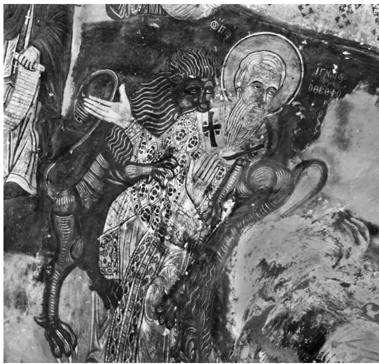
Сл. 7. Стїрадање свейїої Иї҃҃айїї҃ја Боїоноса, кайїоликон манасїїра Сумеле