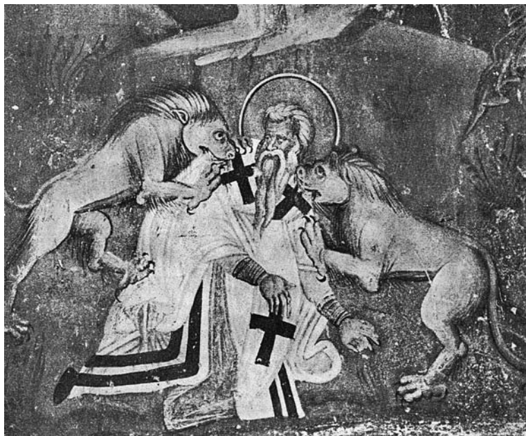
Сл. 3. Страдање свејої Игњатија Бојносоца, црква Свејої Ђорђа у Стјаром Најоричину (џрема П. Мијовићу) Fig. 3. Martyrdom of Saint Ignatius Theophorus, church of Saint George in Staro Nagoričino (after P. Mijović)

ри XIV столећа, раздобља из којег потичу свега три представе Страдања – оне у Старом Нагоричину (сл. 3), Дечанима и Козији. 37