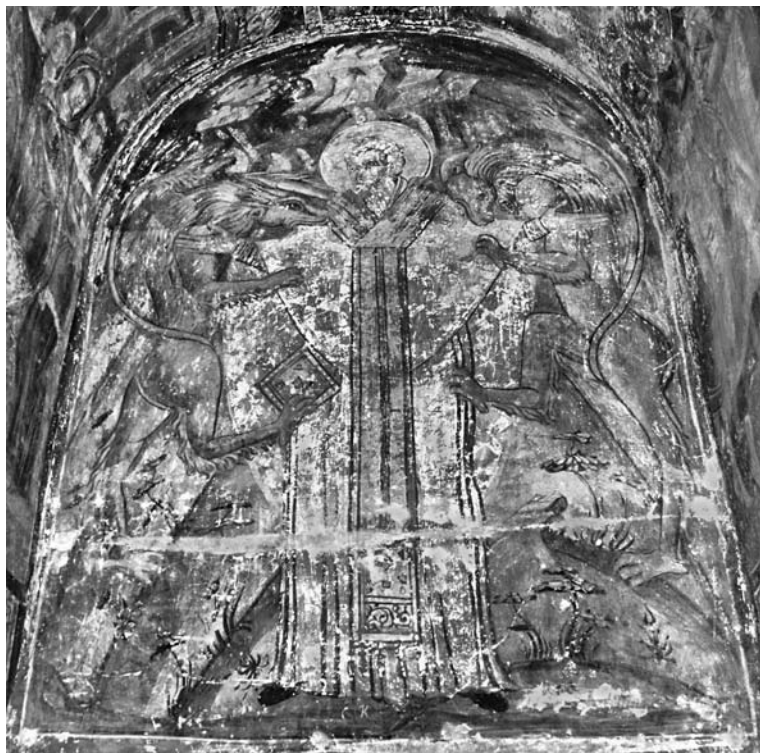
Сл. 1. Страдање светио Игњатија Бојносаца, ипоскомидија главне цркве фрушкогорској манастира Новој Хойова