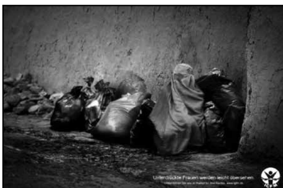
Слика 2

Много је кампања вођено са различитим аргументима. Једни су инсистирали на томе да не можемо говорити о правима жена докле год јој није омогућено да се облачи и изгледа како хоће (слика 2.), док су други наглашавали да ношење вела спада у домен религијских права (слика 3.) и да не симболизује женску заточеност ништа више од нпр. ношења кратке сукње у јавности. Први су сматрали да је вео катализатор насиља над женама а други да он може бити брана насиљу.