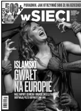
Слика 1

наративима који форсирају тзв. црну социјалну статистику о наводном повећању броја силовања у градским зонама у којима су стационирани мигранти. Алудирајући на урође-ну или стечену тенденцију за сексуалним насиљем (зависи од интерпретација) код муслимана, постиже се потврђивање, не само насилничког карактера мушких становника Оријента, већ се последично даје и простор за оправдање „спашавања” оријенталних жена. Осим што је овакав наратив катализатор сензационализма у медијима, он служи и за привлачење гласова на изборима. Страх од ислама као en générale милитантне религије је генерички покретач бирачког тела за (углавном) десне политичке опције. 20 Новопрстигли мигранти или/и муслимани који су ту више генерација представљени су у оваквим дискурсима као девијантна субкултура детерминисана религијским и традиционалним наслеђем. 21