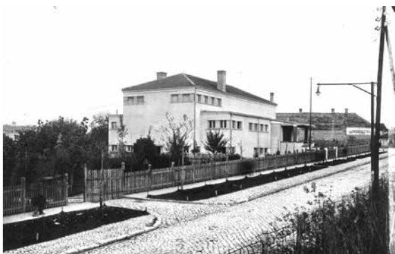
Слика 2 Бранислав Којић, Соколски дом Београд III, 1932. година

Архитекта Бранислав Којић 25 се приликом пројектовања свог јединог соколског дома определио за модерни архитектонски речник (слика 2). Као један од оснивача Групе архитеката модерног правца, 26 Којић је већ почетком четврте деценије двадесетог века почео да се удаљава од фолклоризма 27 и да пројектује готово искључиво у модерном духу. Пројекат је иницијално замишљен амбициозно, са модернистичким третманом фасадног платна у виду тракастог низа прозора и кубичном структуром, али и са монументалним улазним порталом. До издигнутог портала се долази широким степеницама са надстрешницом коју је према пројекту требало да подупиру скулптуре Сокола у пуној величини, али су услед недостатка средстава уместо њих изведена два ступца од опеке. 28