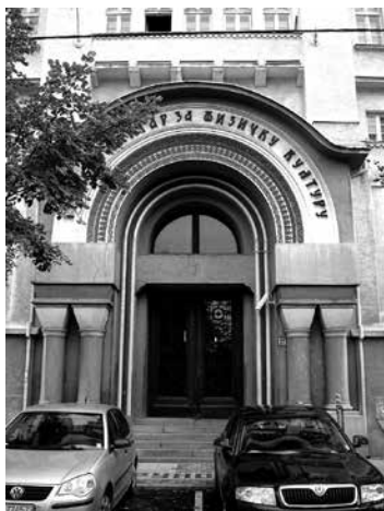
Слика 6 Момир Коруновић, Николај Краснов, Соколски дом Београд – Матица, улазни портал, 1934. година