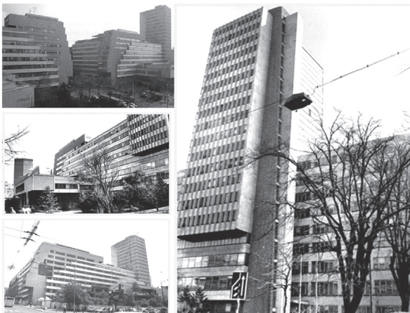
Слика 1 Споменик културе Зграда Генералштаба Војске Србије и Црне Горе и Министарства одбране, Кнеза Милоша 33-41; извор: http://beogradskonasledje.rs/kd/zavod/savski_venac/zgrada_generalstaba_dobrovic.html

као неоштећене грађевине, па се у наставку Одлуке и утврђују и мере заштите споменика културе: „1) очување аутентичног изгледа, хоризонталног и вертикалног габарита, конструктивних и обликовних елемената архитектуре, као и оригиналних материјала”, 2) редовно праћење стања и одржавање конструктивно-статичког система, кровног покривача, свих фасада, ентеријера и исправности инсталација у споменику културе”, као и заштићене околине: „1) забрана градње или постављање објеката трајног или привременог карактера који својом наменом, габаритом, волуменом и обликом могу угрозити или деградирати споменик културе и његову заштићену околину, 2) урбанистичко, комунално и хортикултурно уређење, одржавање и коришћење простора заштићене околине споменика културе”. Сасвим је оправдано претпоставити да се на овакво решење одлучило управо зато што се оштећење Генералштаба могло протумачити као уништење или „губитак својстава од посебног културног и историјског значаја”, што би по важећем Закону о заштити културних добара могло довести у питање статус Генералштаба као споменика културе 6 . Тиме је комплекс додатно правно заштићен. С друге стране, будући да је 1999. године један његов део уништен, јасно је да целовити Генералштаб – онако како је описан у Одлуци – није део постојеће архитектонске-урбанистичке структуре Београда, већ јавне меморије града (слика 1).