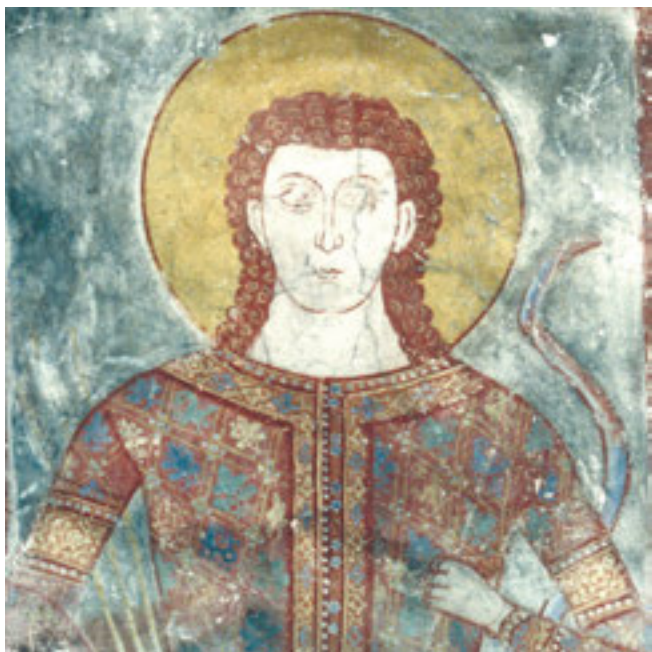
6. Младић Дејан, Велуће 6. Young man Dejan, Veluće

Међу припадницима властеоског staleжа у српској средњовековној средини, једнако као и у Византији, прстење је представљало омиљен и најважнији украс на руци. 6 О обичају и начину ношења појединих облика прстења сведоче археолошки налази и представе властеле на зидовима средњовековних храмова. Ипак, имајући у виду укупан број сачуваних властеоских портрета може се констатовати да прикази прстења у византијској уметности нису бројни. Носили су га, по један или више њих на истом прсту или руци, како мушкарци тако и жене и деца, што је посведочено на представама skutерија Каниота у Богородици Одигитрији у Мистри, властелинке Ане Радина у Светим бесребрницима у Костуру, девојчице на ктиторској композицији у Доњој Каменици, као и властелина Константина, његове супруге и властелинке Арете у Станичењу (Pelekanidis and Chatzidakis 1985: fig. 23; Живковић 1987; Габелић 1987: 26–27; Parani 2003: 335; Поповић и др. 2005: 86, 90, 92, сл. 33, 35, 38, 39; Parani 2015: 409, fig. 1; Фрфулановић 2015: 48, 56).