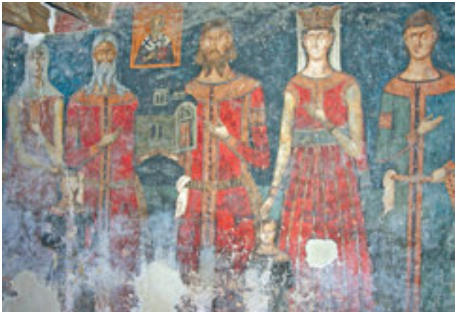
4. Ктиторска композиција, Псача 4. Ktetor's composition, St. Nicholas in Psača