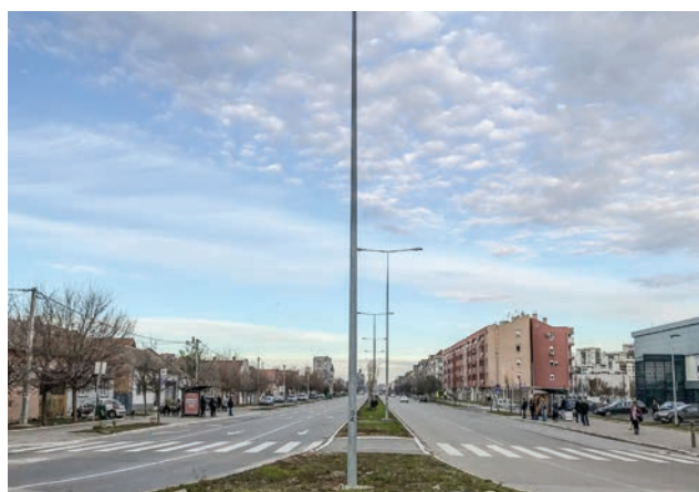
Сл. 6 / Војвођанска улица као граница старог и новог насеља