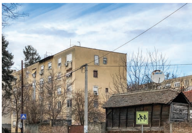
Сл. 5 / Амбар уз ситамбени објекат