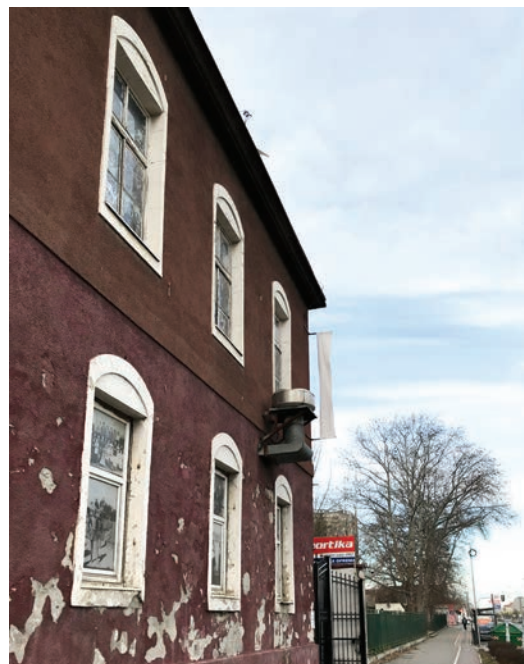
Сл. 9, 10 / Црква Св. Ђорђа и зграда Старе основне школе у Бежанији, некадашње и садашње језиро насеља

лошки инструмент није обавезан јер се ишњања њосављају на лицу места . 24 Пошто су та места обично била локали и породичне куће, није било простора за разговоре нашироко о свакој теми, већ на ужем плану о самом доживљају места станавања, његовим границама и данашњем положају у оквиру Града Београда. Одмах се могло приметити да су људи старије (изнад 60 година), средње (између 30 и 60 година) и млађе (испод 30 година) генерације имали различита виђења насеља у којем живе, у односу на његову архитектуру и урбани развој кроз историју. Ти одговори су били записивани у бележницу из које су касније прекуцавани директно у рад као сирова грађа, да би се уз конкретно освртање на одређене делове тих материјала добијао друштвено-културни оквир места и његових становника. У њему је било важно сазнати шта за испитанике значи бити Бежанинац , односно како се обликује локални идентитет становништва, те које су границе Бежаније услед специфичног урбаног развоја Новог Београда током социјализма и постсоцијалистичке урбане транс-