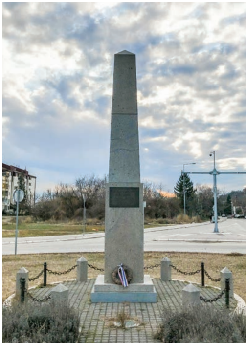
Сл. 11 / Сйомен-обележје йоводом 500 йодина од йрвој йомена имена Бежаније

куће за које постоји могућност да су у прошлости биле викендице, а сада су прилагођене сталном животу. Лева страна Виноградске улице има привремене и запуштене објекте, као и низ занатских радњи за оправку аутомобила, те једну пекарну („Сандо“). У овом делу уочено је најмање пешака али велики проток саобраћаја, уз једну линију градског превоза. Претпоставка је да ће будући урбани развој овај део бежанијског насеља потпуно изменити, јер ће фреквенција саобраћаја бити повећана, а инфраструктура пратити развој нових стамбених насеља и нове градње уопште. То ће се одразити и на друштвено-културни оквир насеља и његових становника, па ће напори да се Бежанија очува као насеље и градски топоним бити додатно отежани.