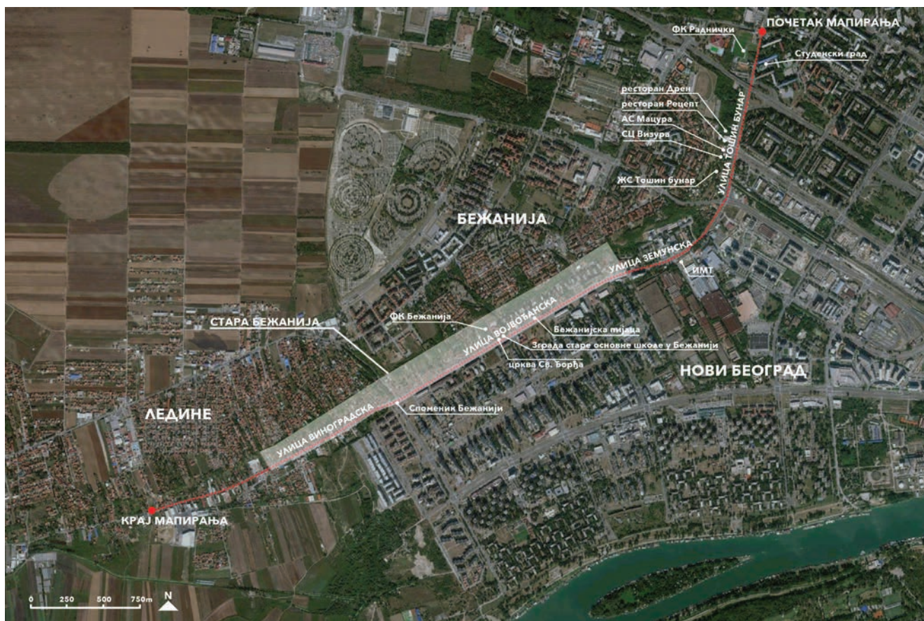
Сл. 7 / Приказ кретања током маирања (илустрација аутора)

би можда чинила сама коса (падина). Уколико дође до заштите одређених објеката, ново насеље би могло да се интегрише у старо. Још не постоје регулациони планови који би предвидели даље проширење и уређење насеља. Једини који постоје за ову локацију односе се на саобраћајно уређење, а у наставку ћемо навести један од њих.