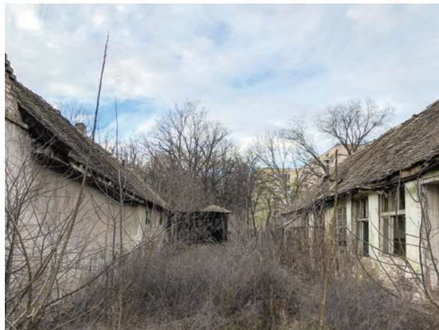
Сл. 2 / Запуштене куће и двориште у старом бежанијском насељу (фотографија: М. Сijanкић)

Кад прођемо испод надвожњака у наставку улице, долазимо на простор великих зелених површина, које нису уредили ни приватна лица ни званична комунална предузећа. Постоји могућност да су те површине раније биле њиве, које су проширењем града изгубиле функцију и тренутно чекају изградњу нових објеката. Раније смо пролазећи поред ових површина имали прилике да приметимо домаће животиње, козе и кокошке. Очито је да се поједине породице баве сточарством, односно да животиње припадају припадницима ромске популације који живе испод железничке станице Тошин бунар и