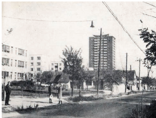
Сл. 1 / Некадашњи изглед Војвођанске улице

Стварањем Краљевине Срба, Хрвата и Словенаца 1918, касније Краљевине Југославије, Бежанија доживљава процват као насеље у чијем атару је изграђен тадашњи београдски аеродром 1927. године. Био је то један од многобројних тадашњих планова о ширењу града на леву обалу Саве, направљених још 1923, чије остварење није спроведено у дело током читав међуратни период због недостатка радне снаге и финансијских средстава. Међутим, у близини аеродрома је никло Ново насеље, у којем су живели запослени у ваздушној луци, између Бежа-