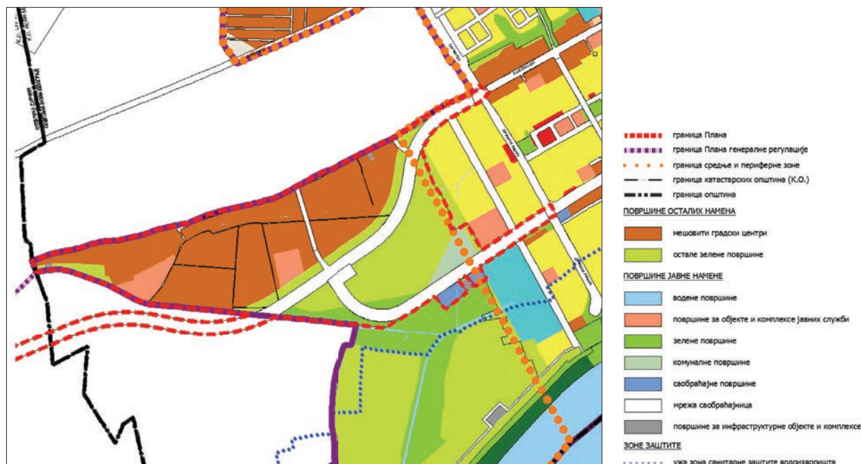
Сл. 8 / Планирана намена и површина, извод из ППР Београда (Урбанистички завод Београда)

којих се може предвидети њен будући урбани развој. С убрзаним и нарастајућим испуњавањем површина Новог Београда новоградњом, почињу да се формирају урбанистички планови стамбених и пословних насеља (попут оног на подручју некадашњег „ИМТ“-а), која почињу да исцртавају слику правца будућег урбаног развоја Бежаније. Тренутни урбанистички планови одређених саобраћајница, као што су план детаљне регулације подручја уз Виноградску улицу, говоре у прилог једном од могућих праваца развоја насеља. На основу њих, може се рећи да ће Бежанија у наредном периоду имати велику улогу у повезивању Београда с околним насељима, као што ће и сама бити повезана с оближњим ауто-путевима.