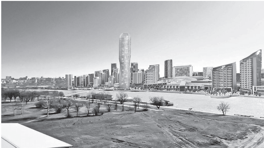
Слика 2. Архитектонско-урбанистички пројекат „Београд на води“ (2016–2021), у реализацији

Ни Милошевићеви следбеници на највишим државним функцијама (Војислав Коштуница, Зоран Ђинђић, Борис Тадић, Томислав Николић и Александар Вучић) нису се удубљивали у проблеме архитектонске струке већ су се фокусирали на опоравак економије, привлачење страних инвестиција, повећање запослености, заштиту угроженог националног идентитета и територијалног суверенитета, не добијајући за ово последње подршку западних сила. Подстакли су обнову традиционалног задужбинарства, враћање имовине старим власницима, изградњу цркава, јавних споменика, здравствених капацитета, станова за избеглице, младе, војску и полицију. С друге стра-