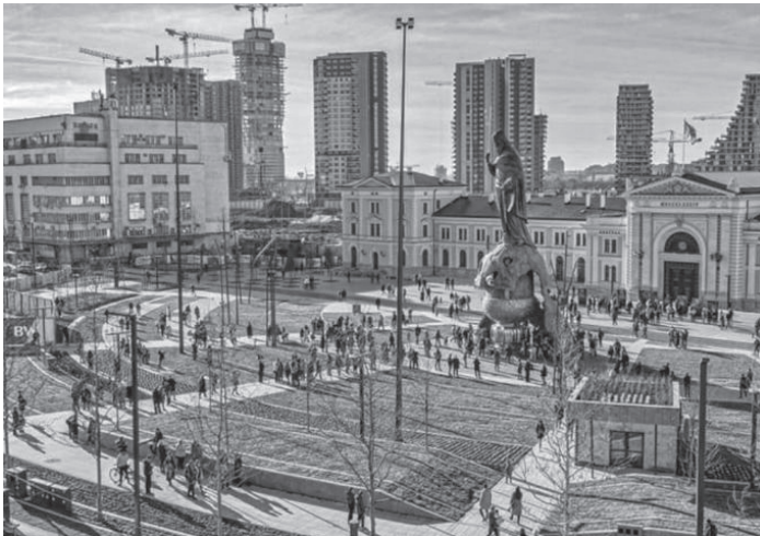
Слика 3. Савски трг са спомеником Стефану Немањи (вајар Александар Рукавишњиков), Београд (2020–2021)