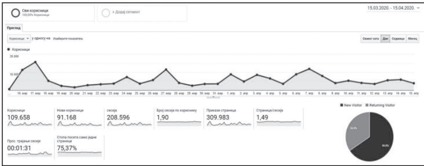
Слика 1 Јединствене посете и број прегледаних страница

Овакав начин организације наставе захтевао је од ученика, односно њихових родитеља, одређени степен дигиталне писмености који би гарантовао приступ веб-порталу и продукцију садржаја. У почетку су садржаји са платформе били заједнички за све ученике у земљи, али врло брзо је и од наставника тражено да наставу и рад са ученицима у својим одељењима организују у онлајн окружењу. Стручну подршку наставницима за овладавање пре свега комуникационим и колаборационим алатима као што су „Zoom“, „Teams“ и „Moodle“, пружао је Завод за унапређење образовања и васпитања. Према Извештају о подршци наставницима образовању на даљину (ЗУОВ, 2021), од првог дана проглашења ванредног стања наставницима су били доступни неопходни електронски материјали, видео садржаји и алати за извођење онлајн наставе ( zuov.gov.rs/alati/ ). Само у првих месец дана, од 15. марта до 15. априла, било је 109.658 јединствених посета и 309.983 отворених страница, као што се може видети на слици испод: