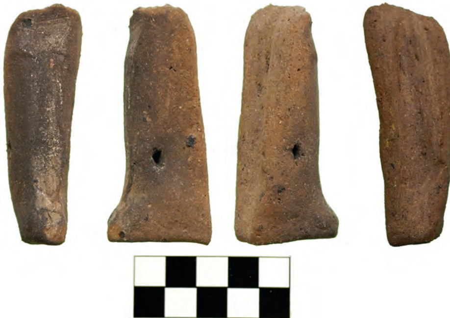
Сл. 2 Нога фигурине с траговима употребе

ришћена држањем на проксималном крају (стопалу), дорсалном страном ка споља, у потезима горе-доле, с већим ослонцем на вентралној страни.