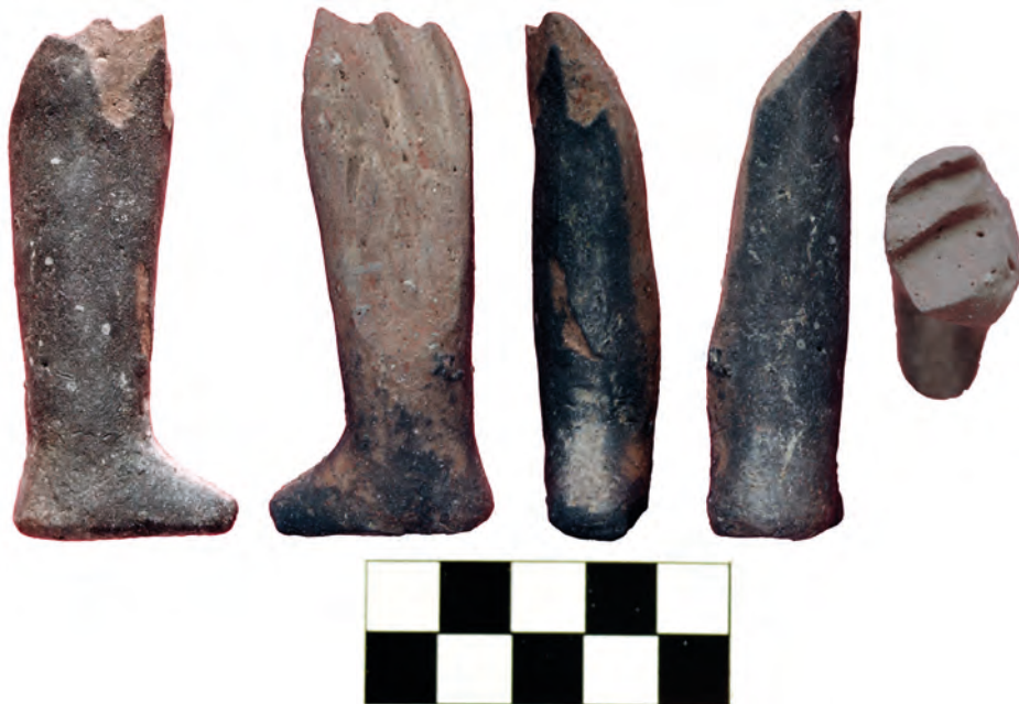
Сл. 1 Нога фигурине с траговима употребе

покрет у коме је она коришћена био је правилан, у правцу горе-доле. На левој латералној страни површина је такође истрошена, тако да је првобитна површина уклоњена. Такво оштећење не постоји на десној латералној страни – алатка је држана благо укосо, тако да је притисак абразивног покрета био више на левој страни.