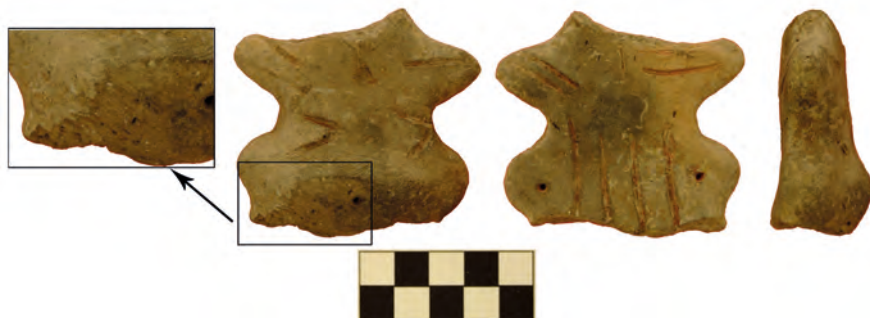
Сл. 4 Фрагмент фигурина с представом одеће и абрадираном зоном на трбуху

погодавао томе да она буде једноставна за држање: улегнуће између патрљака руку и испупчења на куковима било је, по свој прилици, добар ослонац за прсте. Ова алатка је могла бити употребљавана у контакту с неким тврдим материјалом, у процесима као што су стругање или равнање.