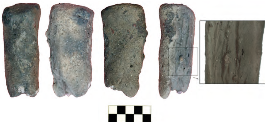
Сл. 3 Фрагмент горњег дела стубасте фигурине с траговима употребе

настали утискивањем некаквих гранчица или штапића, који су постављени као нека врста арматуре у процесу израде, односно обликовања фигурине. Та могућност је, међутим, мало вероватна, и то из најмање два разлога. Прво, није сасвим јасна потреба за ојачањем током обликовања овако једноставне, шематизоване представе, која се веома лако може извести ролањем између две руке, за шта није потребно посебно знање, нити вештина. Још важније је то што утискивањем неке арматуре од органских материјала не би могла да настану оштећења која се манифестују уздигнутим примесима. Таква оштећења могу настати искључиво после печења, дакле током употребе. С обзиром, међутим, на специфичности трагова употребе, као и на чињеницу да засад нису познати слични примери, питање активности у којој су трагови настали мора остати отворено.