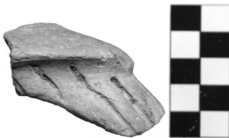
Сл. 5. Жртвеник са ногама украшеним жљебљењем Fig. 5. Leg of an altar with fluted decoration

то финије обликованим комадима глине, који су касније глачани, али само са спољне стране. На већини примерака су на унутрашњој страни присутни трагови који указују на равнање алатком док је глина била још влажна. Чињеница да ови делови нису накнадно дотеривани показује да је мајсторова брига била фина обрада само оних делова који су били изложени погледу.