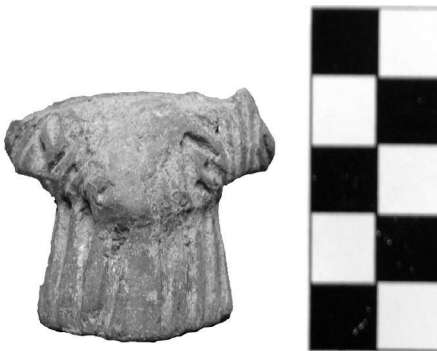
Сл. 4. Жртвеник са жљебљеним украсом у мотиву концентричних троуглова