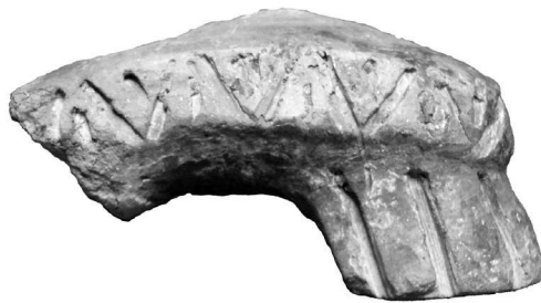
Сл. 2. Жртвеник са ногама потковичастог пресека са урезаним украсом