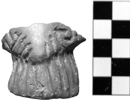
Сл. 3. Жртвеник са жљебљеним украсом у мотиву меандра

без видљивих органских примеса, са црним језгром у прелому, али и искључиво са минералним примесама, у фактури која макроскопски више подсећа на винчанску (сл. 1). Боје печења и обраде површина такође варирају: од типично старчевачке црвеногачане површине (сл. 3 и 5) до сивкасте боје и површине без видљивог премаза (сл. 2).