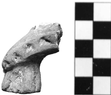
Сл. 6. Жртвеник са украсом у мотиву стојећих троуглова

Група описаних жртвеника заиста твори једну занимљиву групу, и карактеришу их сличности (у форми ноге и мотиву украса), али и разлике (понекад у детаљима мотива и техникама његовог извођења). Ако боље погледамо, међутим, чини се да их и поменуте разлике поново спајају у јединствену целину. Наиме, код примерака са мотивима троуглова стиче се општи утисак да је орнамент прилично немарно изведен, тако да делује грубо и рустично, као да мајстор није сасвим овладао техником или разумео значење мотива. Да бисмо то додатно размотрили, на овом месту ћемо приказати још два примерка жртвеника другачије форме или мотива, али са неким сличним особинама.