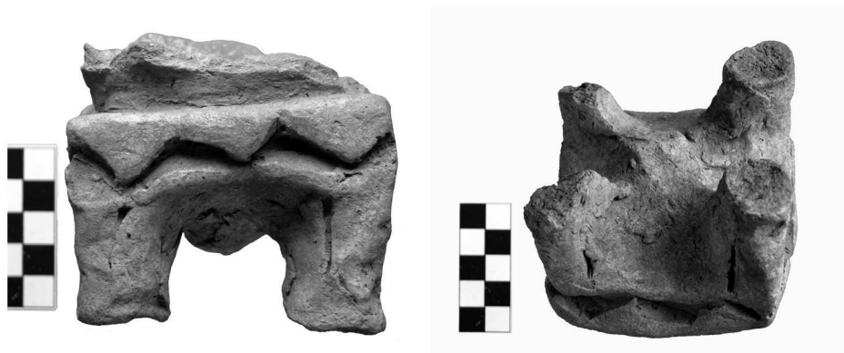
Сл. 7а-б. Жртвеник немарне израде са Kerbchnitt - украсом Fig. 7a-b. Altar with careless finishing with Kerbchnitt decoration

Делимично оштећен жртвеник (сл. 7а) по форми је типичан представник старчевачких жртвеника: кружни реципијент налази се на постољу на четири ноге; постоље украшено рељефним висећим троугловима је са доње стране „извучено”, па добија призматични, „зашиљени” облик (сл. 7б). 4 Без обзира на ове типичне одлике, најупечатљивија особина овог жртвеника је његова небрижљива, изузетно груба израда. Сви делови жртвеника толико су непажљиво обликовани, да је жртвеник у потпуности асиметричан: свака нога је различите дебљине, дужине и положаја: три одају утисак да су вертикалне, док је четврта потпуно искошена; чак и дебљина и попречни пресек сваке појединачне ноге варира на различитим њеним висинама. Површина не само да није глачана, већ уопште није поравната, а вишкови глине које су прсти истисли током израде нису уклоњени. Покушај извођења вертикалних урезаних линија на ногама више је него неуспешан: глина је очигледно била још прилично мека када су линије урезане, тако да се каналић настао урезивањем по престанку притиска алатке на већини линија делимично затворио. Посредно можемо да закључимо и то да је гли-