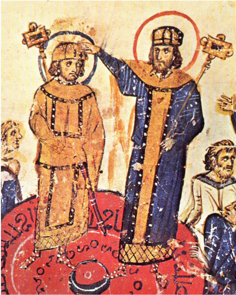
Слика. 9. Илустрована Хроника Јована Скилице, Matriensis MS gr. Vitr. 26-2, fol. 10v .

Царска промоција добијала је у истом рукопису и другачији вид. На представама завршног момента проглашења, цареви Лав V и Теофил приказани су како седе на престолима, држећи мач украшених корица у рукама (fol. 12 v , 42 v ), док им поданици изражавају покорност (Слика 10). 58