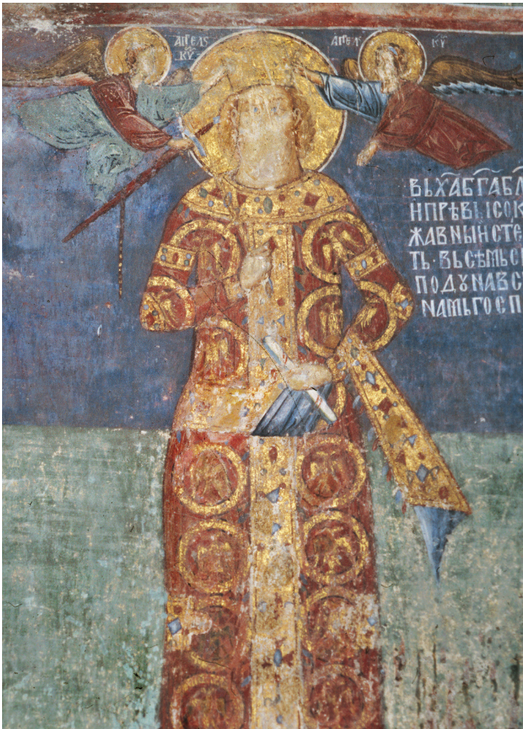
Слика. 3. Деспот Стефан Лазаревић, Љубостиња.

у хрисовуљи Хиланадару о селу Лушцу, вели како је моли- твама и благословом светих из свога рода примио „крст из руке Господње и мач из руке анђелове“ да „царује у Богу и весели се о божанском дару“. 6 Слично томе, у мљетској