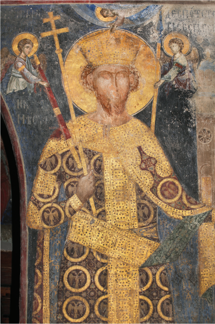
Слика. 4. Деспот Стефан Лазаревић, Ресава.

повељи цара Уроша од 10. априла 1357. године, истиче се да је Христос даровао неизрециву благодат „својим слугама, православним царевима који су у побожности и чистоти проходили све године живота свога и примили венце почасту од свемогућег Владике и из руке анђеоске мач победе, па