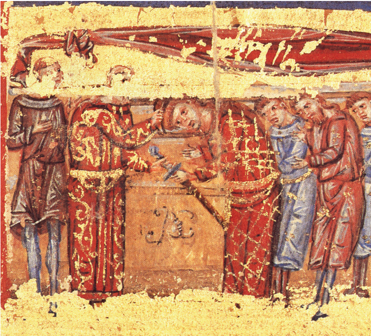
Слика. 11. Српски Минхенски псалтир, Monach. cod. slav. 4, fol. 135r.

је инсигније предавао старијем цару. Њих двојица су заједно држали круну, спуштајући је на главу савладара, или би крунисање извршио сам владар. У предаји осталих инсигнија патријарх није учествовао, већ су цару у њиховој предаји могли помагати препозити. Биће да, сходно томе, у византијској уметности Христос није приказиван како лично уручује владарима инсигније другог реда, па ни мач и копље.