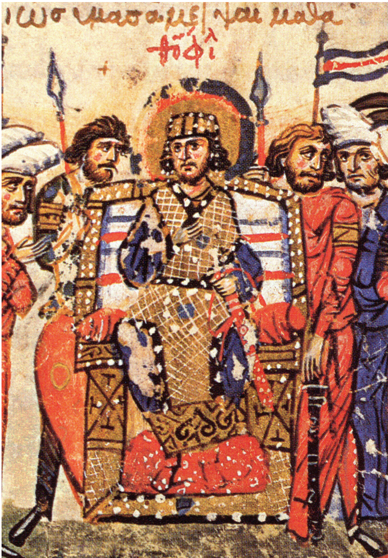
Слика. 10. Илустрована Хроника Јована Скилице, Matriensis MS gr. Vitr. 26-2, fol. 42v .

у Мацхвариши, представљен је 1140. године грузијски краљ Димитрије I којег крунише анђео, док му двојица еристава припасују владарски мач. 59 И један рукопис с крунидбеним правилима из XIII века сведочи да је уручивање мача у