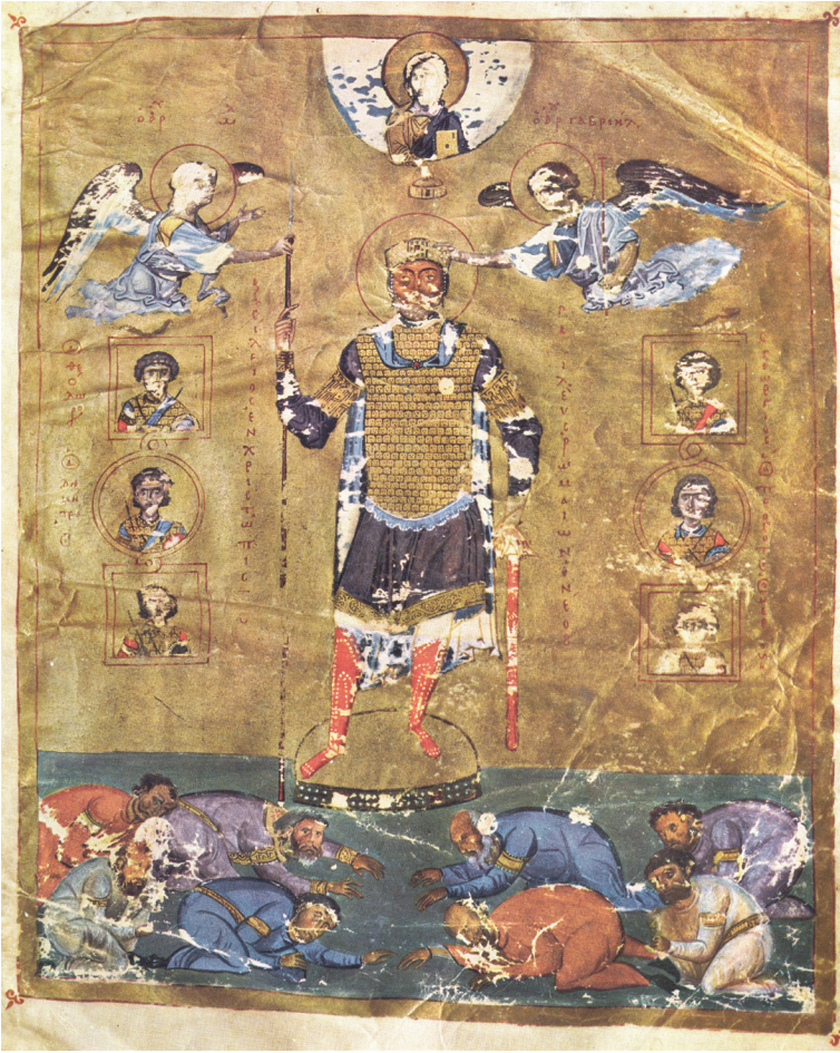
Слика 5. Псалтир цара Василија II, Marciana, cod. gr. Z. 17 (=421), fol. IIIr.

fol. 11 r ), насталом под јасним утицајима византијске уметности. Два анђела с неба спуштају мач и копље краљу. Он их прихвата рукама које подупиру свети Улрих Аугзбуршки и свети Емерам Регензбуршки, као што су Мојсију помагали Арон и Ор за време победоносне битке Јевреја с Амаликом. У исто време Христос у мандорли левом руком ставља круну на Хајнрихову главу, а десном га благосиља. 10 Под снажним