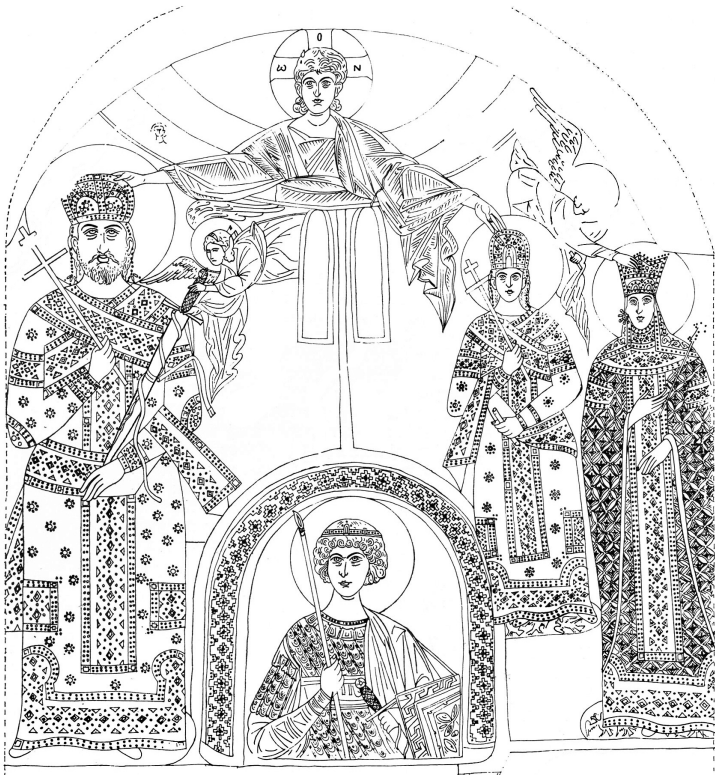
Слика 2. Владарски портети, фасада Светог Ђорђа у Полошком (цртеж: Н. Цонев).

Нешто млађи деспотов портрет у Ресави иконографски је још сложенији. Из сегмента неба у врху представе помаља се Христос који венчава српског владара, док двојица анђела дарују владару мач црвених корица са златним оковима и дуго копље (Слика 4). 4