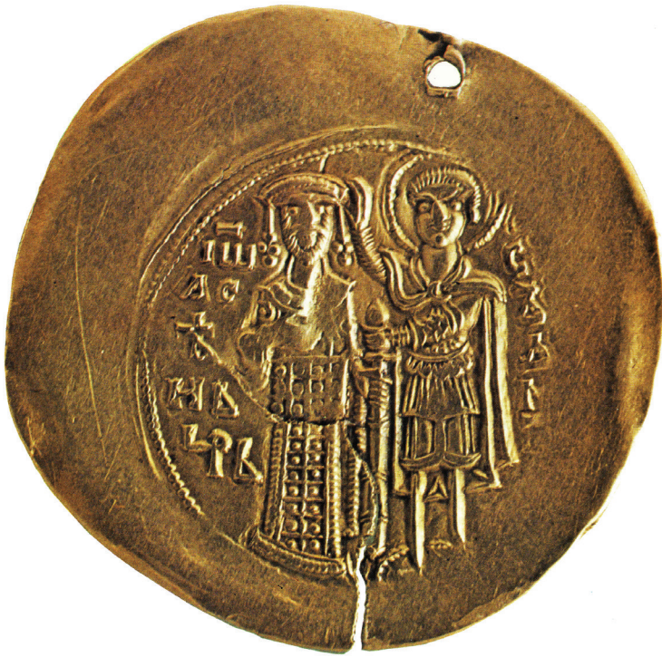
Слика 6. Иперпирон бугарског цара Јована II Асена, реверс.