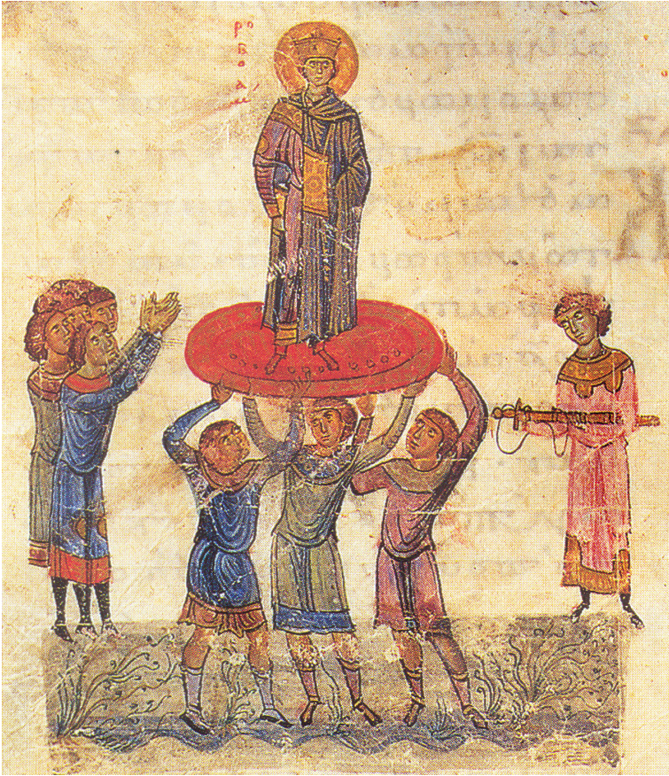
Слика 8. Књига о царевима, Vaticanus gr. 333, fol. 89v.

У рукопису Скиличине хронике из Мадрида насликано је проглашење Лава V Јерменина за савладара Михаила I (fol. 10 v ). Оба цара подигнута су на штит и држе лабаруме, а старији ставља круну на главу млађег. Нови цар, за разлику од старог, у левој руци држи мач у корицама, који му је, свакако, уручен у оквиру церемоније проглашења (Слика 9). 57