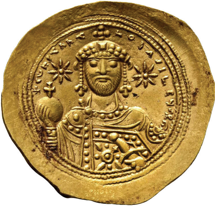
Слика. 7. Хистаменон византијског цара Константина IX Мономаха, реверс.

владарево златно копље, украшено бисерјем, носили су сами цареви или достојанственици у царској пратњи. 34 Поменули смо да је у Србији истицано Немањино „богомдаровано“ копље.