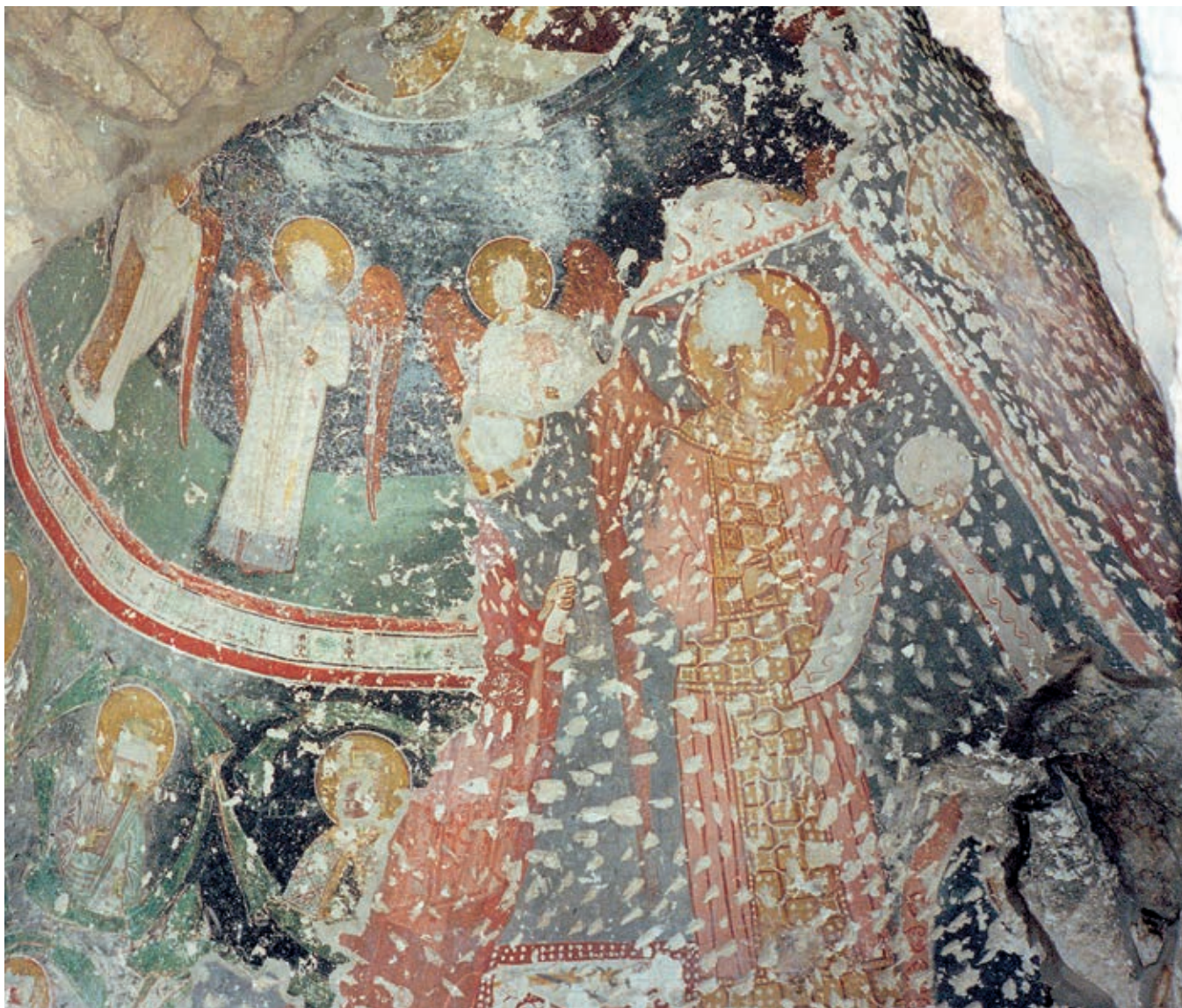
Сл. 190. Кориша код Призрена, испосница Светог Петра Коришког, анђели из Небеске литургије и попрсја пророка (СРЕДИНА XIV ВЕКА), АРХАНЂЕЛО И ОСТАЦИ ФИГУРЕ СВЕТОГ ПЕТРА (ОКО 1220)

постављан први српски епископ. Вероватно су том приликом обављени ситнији радови на обнови архитектуре и нешто обимнија обнова живописа Богородице Елеусе (Љевишке), тробродне византијске базилике у којој су претходно столovali грчки прелати (сл. 179, 180). 6 Савиној непосредној интервенцији најпре би се могли приписати српски