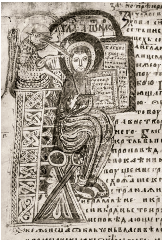
Сл. 192. Призренско четворојеванђеље, Јеванђелиста Марко, друга половина XIII века (НББ)