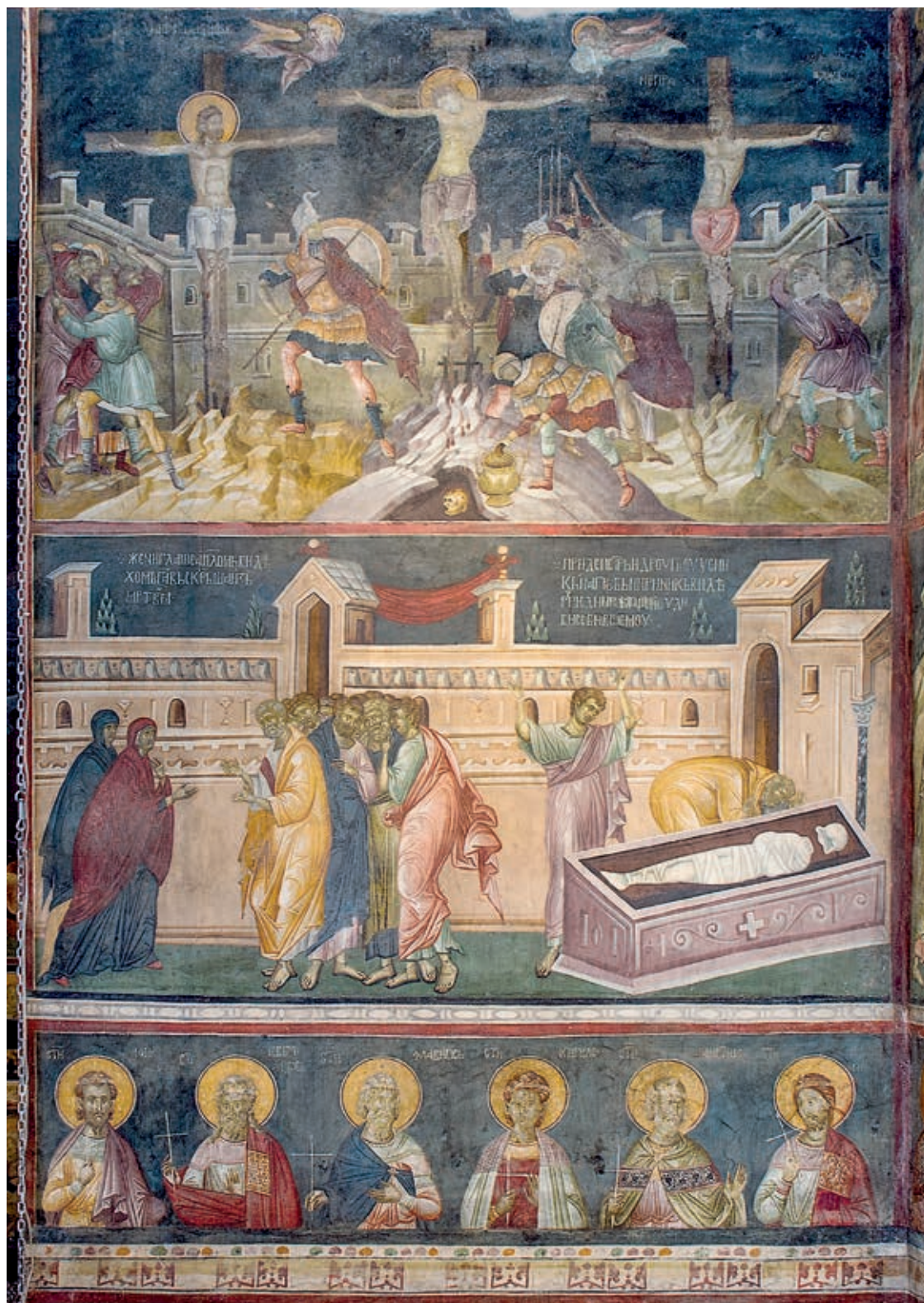
Сл. 206. Манастир Грачаница, католикон, фреске на источном зиду наоса, око 1320. године