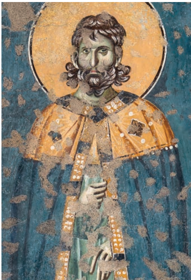
Сл. 200. Богородица Љевишка у Призрену, непознати мученик, око 1310. године