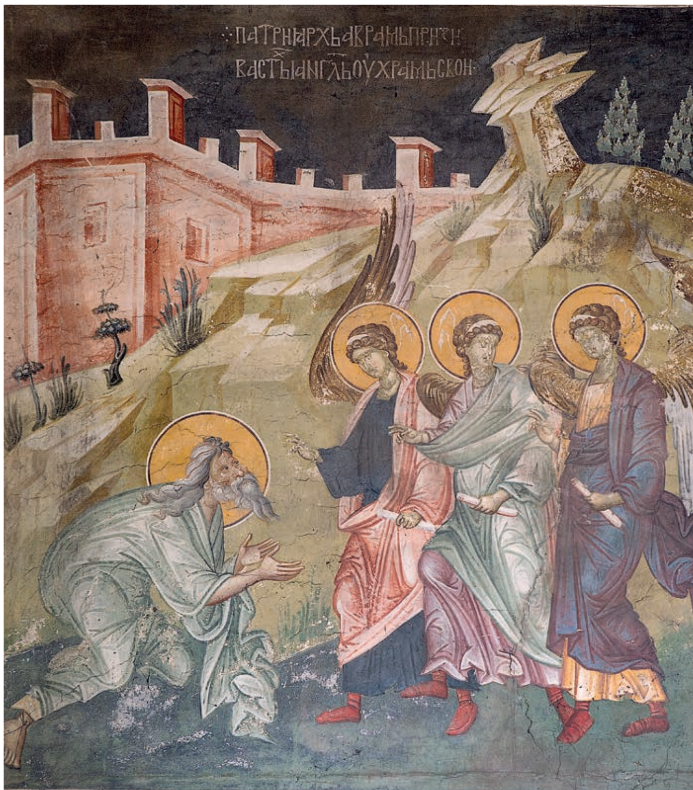
Сл. 203. Манастир Грачаница, католикон, Аврам дочекује три анђела, око 1320. године