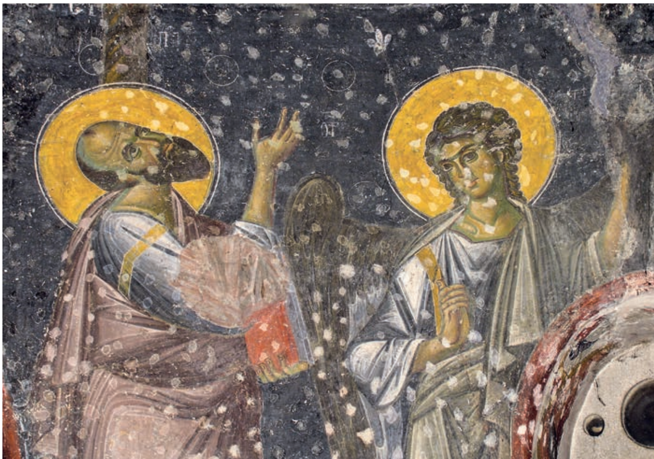
Сл. 195. Пећка патријаршија, црква Светих апостола, апостол Павле и анђеоло из Вазнесења Христовог, око 1260. године

већи број решења која је свети Сава остварио у олтару, куполи, поткуполном простору и певницама Жиче (сл. 136, 194, 195). 12 Арсеније је, у жељи да укаже почаст свом претходнику, унео и неке тематске новине. Укључио је Саву међу саслужитеље великих отаца цркве у најнижој зони олтарске апсиде (сл. 124), а у апсиди протезиса дао је да се представи служба проскомидије коју заједно обављају двојица првих српских архиепископа. Главни живописац Светих апостола стилским одликама следи најнапреднији правац у развоју византијског и српског сликарства прве половине XIII века, обележен