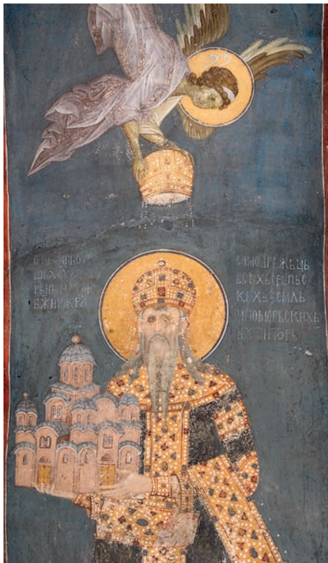
Сл. 205. Манастир Грачаница, католикон, анђео доноси круну краљу Милутину, око 1320. године

Чим је завршио Бањску, Милутин је прегао да из темеља обнови катедралу липљанских епископа. Уместо старе једнобродне цркве сазидан је петокуполни храм складних, витких облика и пажљиво зиданих фасада, на којима се правилно смењују редови камена и опеке (сл. 4, 143, 202, 409, т. XI). Просторно богато разуђена, са опходним бродом завршеним на северној и јужној страни издуженим параклисима, грачаничка црква, ремек-дело позновизантијске архитектуре, омогућила је развијање веома садржајног и богословски сложеног сликаног украса. Реч је о фрескама Михаила Астрапе и његове радионице, стилски дотераним у духу најбољих традиција ренесансе Палеолога (сл. 203, 206, 411, т. XIX). 30 У мноштву композиција и засебних светитељских фигура посебно се истиче Лоза Немањића, вертикално устројена родословна слика владарске династије, раније непозната у српској уметности. При врху те композиције, у чијој је основи приказан свети Симеон Немања у царском орнату, појављује се још један нов мотив у српској средини – божанска инвеститура владара (сл. 204). У Грачаници се тај мотив византијског порекла сусреће и у средишњем пролазу из припрате у наос, где Христос посредством