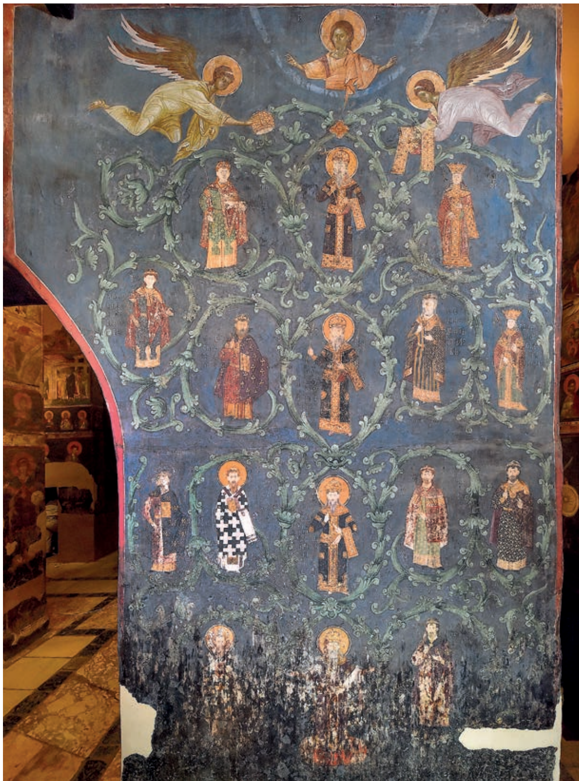
Сл. 204. Манастир Грачаница, католикон, Лоза Немањића, око 1320. године