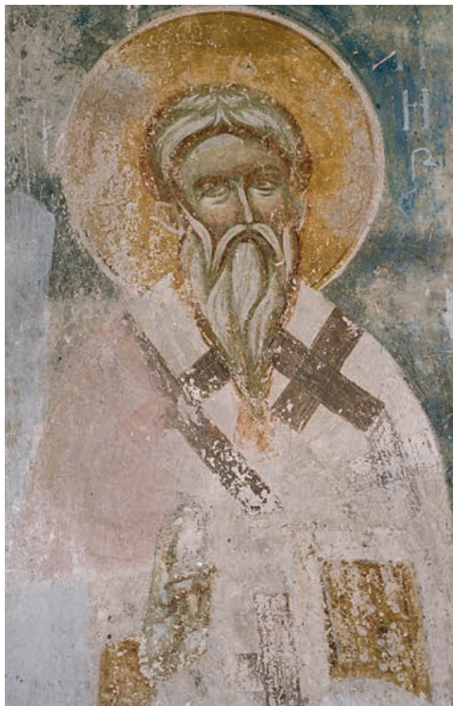
Сл. 207. Муштутиште, црква Богородице Одигитрије, свети Климент, око 1320. године

Ктиторски полет владара и архиепископа пренео се и на поједине српске велможе. Велики казнац Јован Драгослав, Милутинов високи чиновник, био је са својом породицом оснивач цркве Богородице Одигитрије у Муштутишту код Призрена, подигнуте 1314/1315. године. Тај храм, уништен од албанских