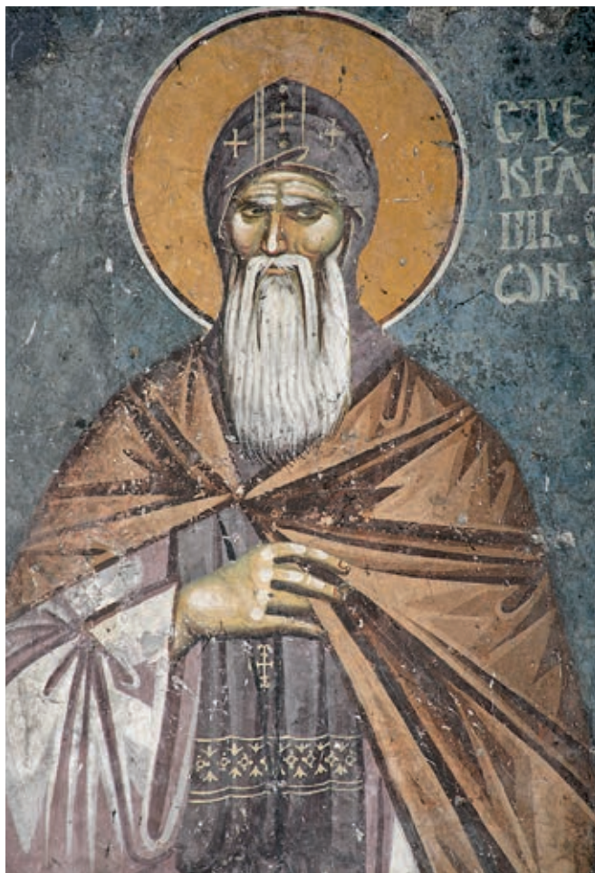
Сл. 196. Пећка патријаршија, црква Светих апостола, краљ Урош као Симеон монах, око 1300. године