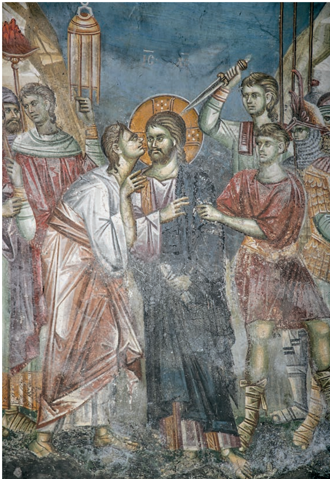
Сл. 198. Пећка патријаршија, црква Светих апостола, Издајство Јудино, око 1300, ДЕТАЉ