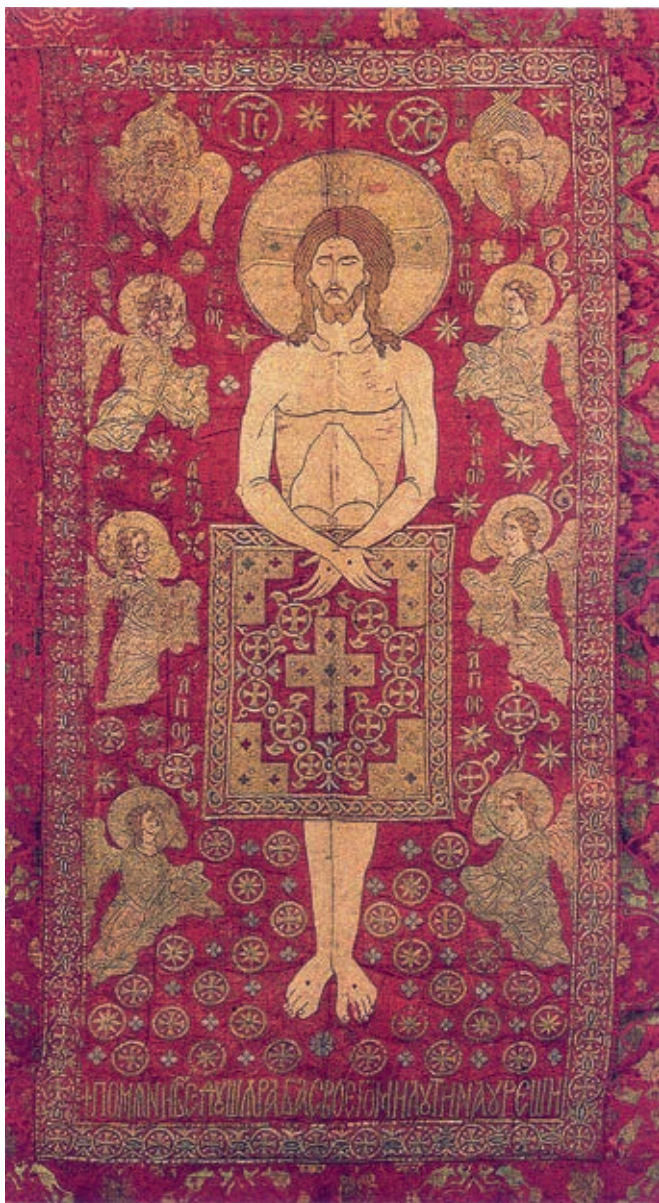
Сл. 209. Плаштаница краља Милутина, око 1321.

Од осталих цркава саграђених на Косову и Метохији у Милутиново доба највише се зна о тзв. Сашкој цркви у Старом Тргу код Трепче, сазиданој и осликаној на прелазу из XIII у XIV столеће, вероватно пре 1303. године. Била је то тробродна готичка базилика с куполом, посвећена првобитно