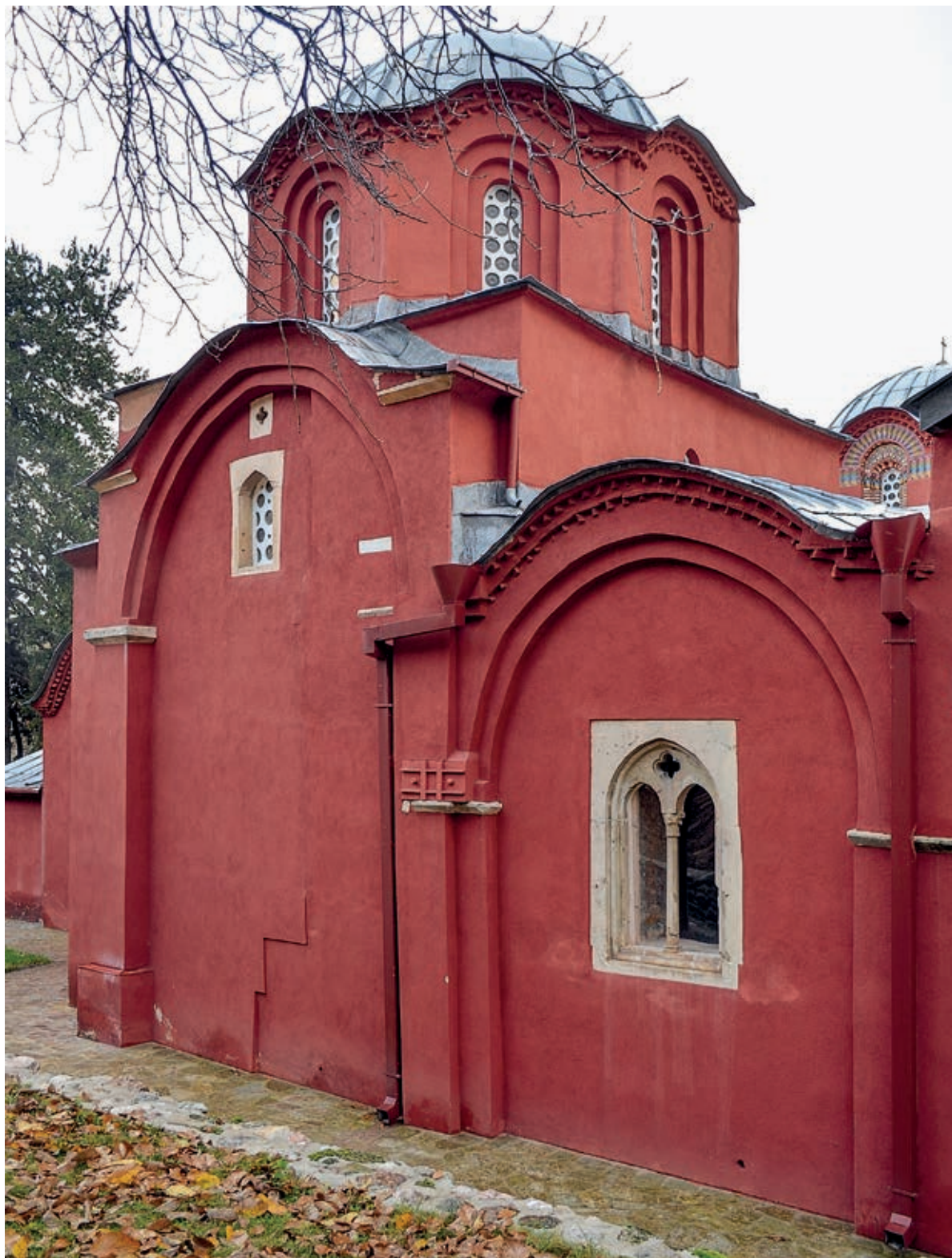
Сл. 208. Пешка патријаршија, црква Светог Димитрија, око 1320. године