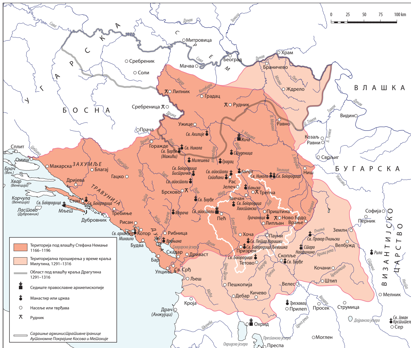
Сл. 189. Територија Србије у доба великог жупана Стефана Немање и краља Милутина

По традицији чији корени сежу до XIV века, и Сава Немањић је имао извесног удела у поменутом Арсенијевом подухвату. 4 Сигурније је ипак говорити о Савиној улози у устројству косовско-метохијских катедрала новоосноване аутокефалне цркве. Напоре првог српског архиепископа и његових владика потпомагао је актуелни владар