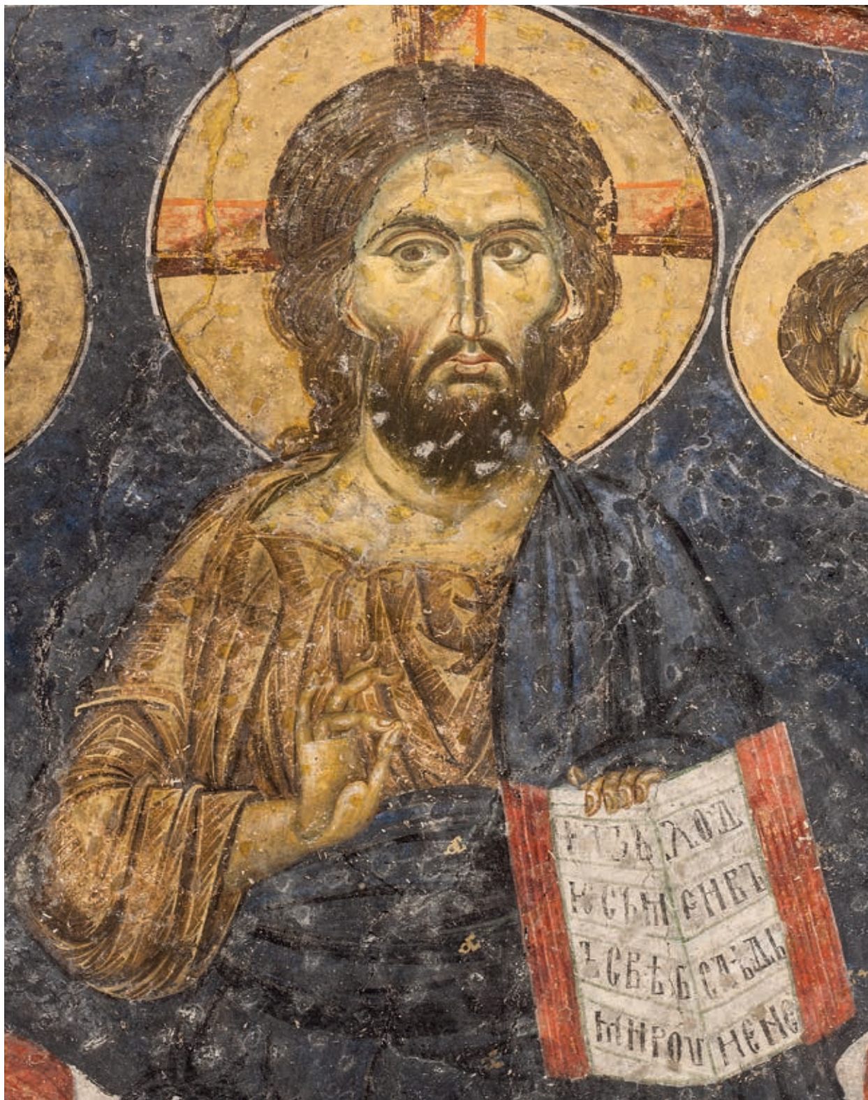
Сл. 194. ПЕЧКА ПАТРИЈАРШИЈА, ЦРКВА СВЕТИХ АПОСТОЛА, ХРИСТОС ИЗ ДЕЗИСА, ОКО 1260. ГОДИНЕ