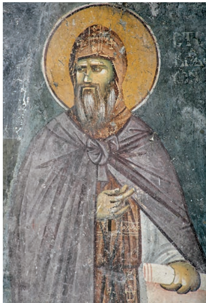
Сл. 197. Пећка патријаршија, црква Светих апостола, краљ Стефан Првовенчани као Симон монах, око 1300. године

се сме претпоставити да је, као и претходно поменута дела српских ктитора на Косову и Метохији, својом архитектуром и живописом следила опште токове развоја уметности у старом језгру Рашке.