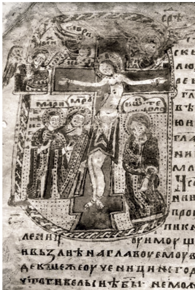
Сл. 193. Призренско четворојеванђеље, Распеће, друга половина XIII века (НББ)

узору на Спасову цркву у Жичи. Штавише, била је ближа Жичи од свих других рашких цркава, па се сме претпоставити да је саграђена под надзором првог српског архиепископа. 10