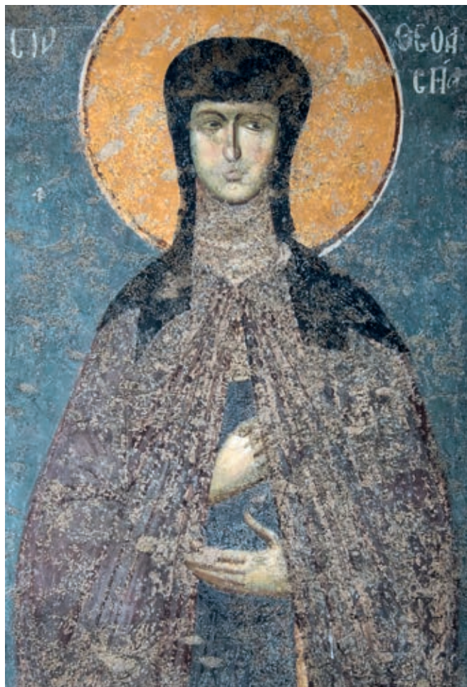
Сл. 201. Богородица Љевишка у Призрену, света Теодосија, око 1310. године

региону, у Сиринићкој жупи, где је постојала веома дуга преписивачка традиција. 19