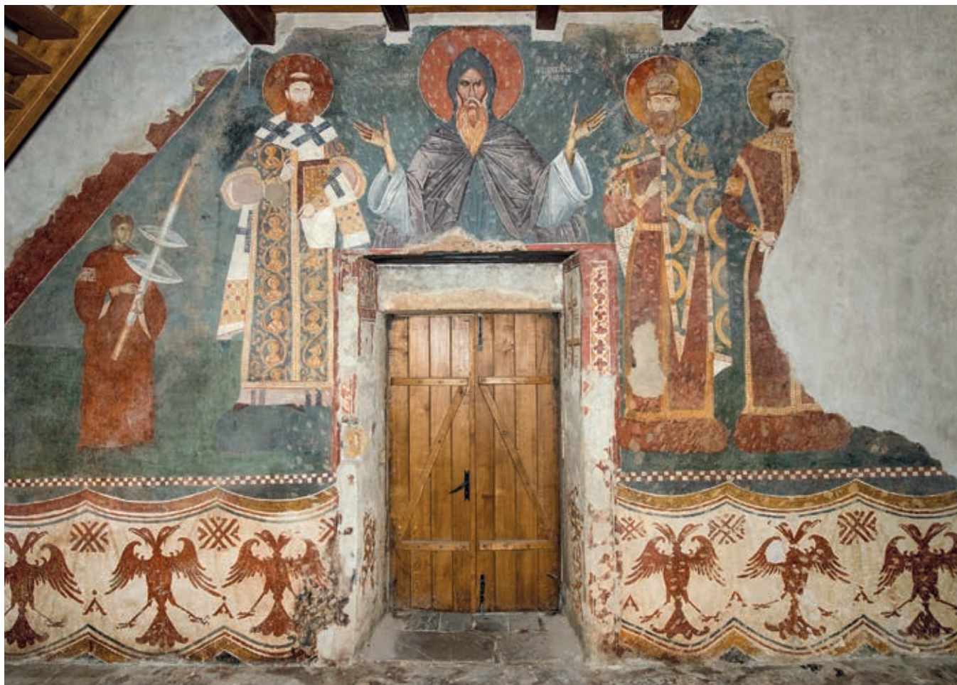
Сл. 199. Богородица Љевишка у Призрену, представе Немађића на западном зиду припрате, око 1310. године

осликана је његова пећинска испосница у планинском пределу изнад села Корише код Призрена (сл. 69). Архаичног стила, особене по јаким контурама и одсуству волумена, фреске испоснице различито су датоване у стручној литератури, али српски натписи на неким од њих упућују на закључак да нису могле настати пре укидања византијске државне и црквене власти над Призреном и његовом околином (сл. 190). 17