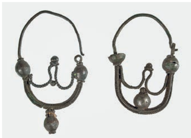
Сл. 182. Чечан, СРЕБРНЕ НАУШНИЦЕ (НМБ, инв. бр. 429/V)

метара и с полукружном апсидом на источној страни. Унутрашњост је са два пара пиластара подељена на три травеја, па се претпоставља да се над средишњим делом налазила купола. На основу остатака живописа са словенским натписима датована је у XIII век. За њу се сматра је била саборни храм Липљанске епископије аутокефалне Српске цркве, за који краљ Милутин у Грачаничкој повељи из друге деценије XIV столећа каже да га је видео разрушеног и наредио да се обнови. 22