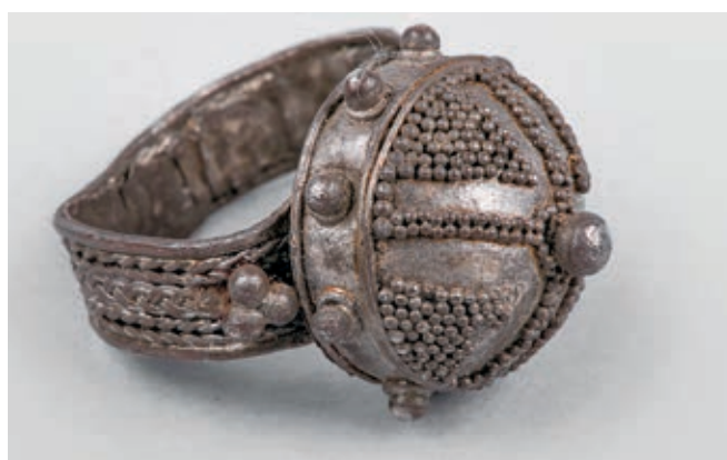
Сл. 185 и 186. Матичане, сребрно прстење (МП, инв. бр. 615 и 630)

Рашке. О овоме сведочи учешће Константина Бодина у устанку који се 1072. године распламсао у подручју Призрена, Ниша и Скопља, као и то што је рашки жупан Вукан заузео Липљан и напао област Полога, Скопља и Врања две деценије касније. 36 Као потврда да је тај простор увелико био насељен Србима узима се и изградња жупске организације, која се као сасвим уобличена појављује у другој половини XII века, када те области постају делови државе Стефана Немање. 37