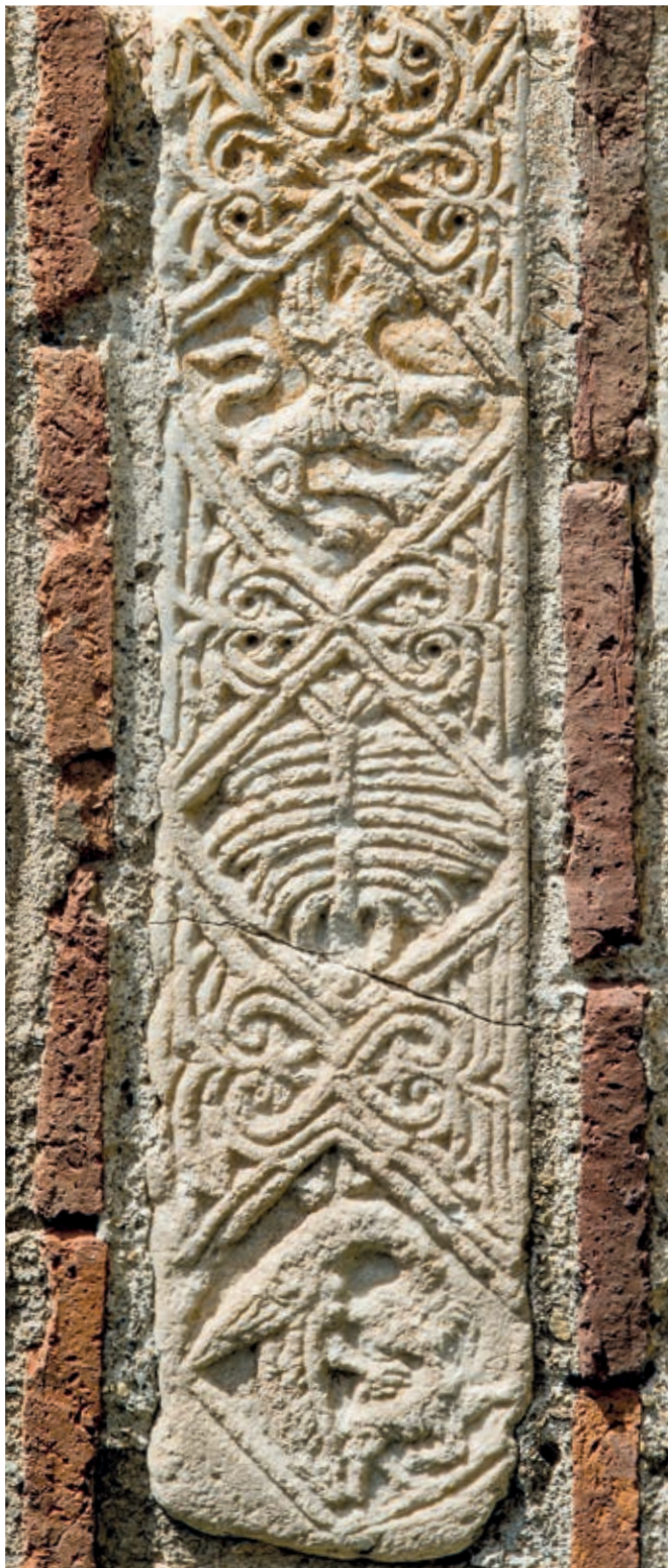
Сл. 180. Призрен, црква Богородице Љевишке, ФРАГМЕНТ КАМЕНЕ ДЕКОРАЦИЈЕ ИЗ СРЕДЊОВИЗАНТИЈСКОГ ДОБА

И на другим местима, готово по правилу испод највећих задужбина из XIII и XIV века, откривени су старији храмови. Писаних извора који би указивали на време њихове градње нема, археолошки подаци недостају, па су датовани само према архитектонским одликама. Величином и обликом основе истиче се најстарија црква откривена у комплексу Пећке патријаршије. Централни храм Светих апостола из друге четвртине XIII века изграђен је презиђивањем и доградњом старије цркве (сл. 179б). На тај део најстарије цркве са обе стране надовезивале су се бочне просторије, пролазима повезане са средишњим делом. Источна страна се реконструирала са три уписане полукружне апсиде, од којих је она средишња споља била четвороугаоно наглашена. По одликама плана та црква је слична црквама рановизантијског доба карактеристичним за западније области, односно за простор римске провинције Далмације. Како, међутим, на том простору постоје и примери који показују да су цркве сличног плана грађене и у IX и X веку, најстарији храм у Пећкој патријаршији широко је датован у време између VII и X века. 20