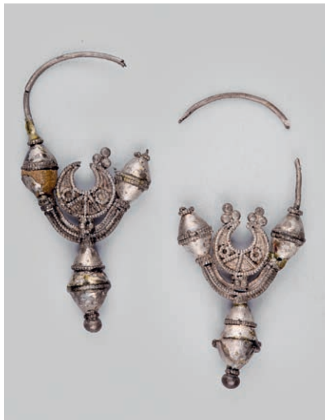
Сл. 184. МАТИЧАНЕ, СРЕБРНЕ НАУШНИЦЕ (МП, инв. бр. 619)

Наушнице особене за то време припадају типу са четири шупље јагоде (сл. 183) и варијантама истог типа, код којих је средња јагода замењена лунулом (сл. 181, 184) или се између две горње јагоде налази таласни украс од тордиране филигранске жице, допуњен двема гранулама и залемљен тако да с доњим луком формира лунуласт облик (сл. 182). 28 Скромнији видови гроздоликних наушница, ливених од бронзе или лошег сребра, познати су с Велетина код Јањева и из манастира Светих арханђела код Призрена. 29 Прстење је заступљено луксузније израђеним сребрним примерцима, тракасте карике и купасте главе, украшене филигранском жицом и гранулама (сл. 185, 186), и скромнијом варијантом,