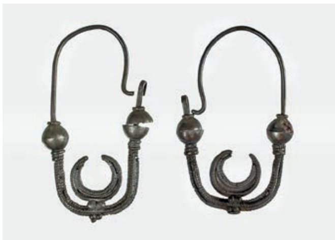
Сл. 181. Чечан, СРЕБРНЕ НАУШНИЦЕ (НМБ, инв. бр. 428/V)