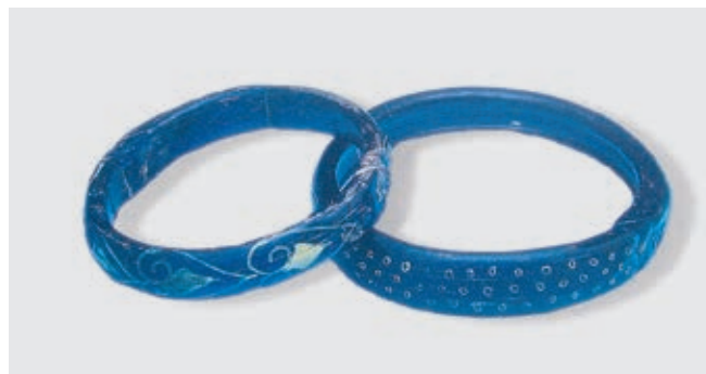
Сл. 188. Бадовац, стаклене наруквице (МП, инв. бр. 46 и 47)

више су заступљени у западним деловима Балкана, а налази с подручја о којем је реч указују на источне и јужне границе њиховог распрострањања. 42 Уопштено узевши, примерци накита из XII и XIII века с Косова и Метохије у потпуности одговарају врстама и типовима распрострањеним у областима које су се прво налазиле у саставу Византије, а потом великим делом у оквиру источних и југоисточних области државе великог жупана Стефана Немање (1166–1196) и његових наследника.