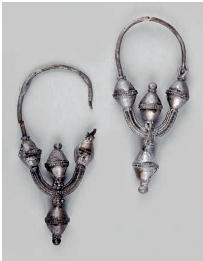
Сл. 183. МАТИЧАНЕ, СРЕБРНЕ НАУШНИЦЕ (МП, инв. бр. 636)