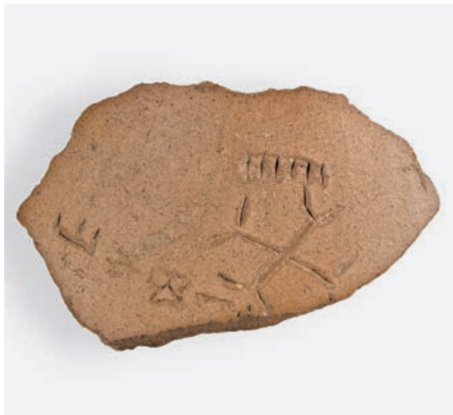
Сл. 178. Чечан, уломак керамичког крчага с глагољским натписом (НМБ, инв. бр. 23_705/V)

видљивих трагова. Некада су се уочавали спољни бедеми, док су се према конфигурацији терена могле наслутити и контуре грађевина у унутрашњости утврђења. Зидови су деценијама разарани, а пронађени археолошки материјал распродаван је на разним странама. У организацији Музеја у Приштини обављена су ископавања мањег обима, али њихови резултати нису публиковани. Познато је само да је откривен део цркве са очуваном крстионицом. 10 Историја тог утврђења реконструирала се на основу предмета који су путем откупа доспели у збирке Народног музеја у Београду и Историјског музеја Србије. Одраније су били познати преисторијски и средњовековни налази, а одскора и предмети који потврђују да се у утврђењу живело и у рановизантијско доба. 11