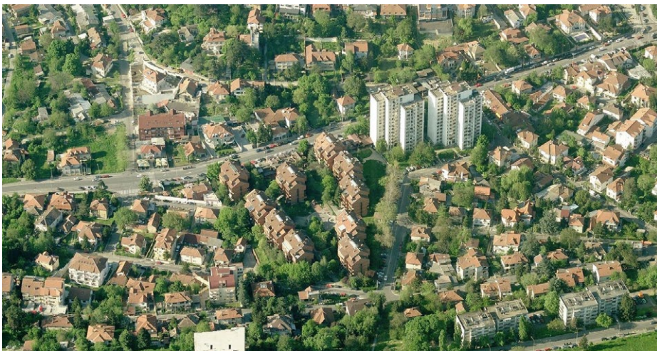
Слика 5. Данашњи изглед Железничке колоније из ваздуха

уклониле део постојећег фонда и нарушиле оригиналну урбану матрицу. Ипак, далеко су веће последице из последње деценије двадесетог и прве две деценије 21. века, када је извршен одређени број надградњи постојећих објеката, док је неконтекстуално подизање нових стамбених зграда додатно нарушило архитектонско и урбанистичко наслеђе Железничке колоније. Међутим, у поређењу с тренутно атрактивнијим локацијама Котеж-Неимара и Чиновничке колоније, где су новоизграђени објекти трајно нарушили основне вредности ових целина, Железничка колонија још увек баштини велики број породичних кућа из периода свог настанка, док се остварење пројектантског тандема Ђокић–Чанак такође може вредновати као позитиван постмодерни одговор на изворни концепт вртног града (слика 5). Ипак, управо су неки од најистакнутијих и најстаријих примера архитектуре Железничке колоније данас и најугроженији, јер су махом напуштени и рапидно пропадају.