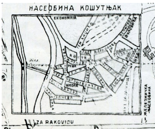
Слика 1. План Железничке колоније у оквиру Плана града Београда, 1943.