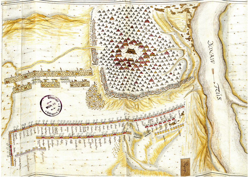
Битка код Сланкамена, 19. август 1691. (KA, NL, 1510 (B), Band VI, p28)