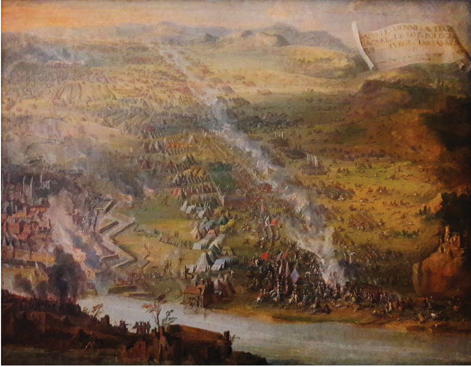
Пјер Дени Марјин, Ојсага Беча 1683.