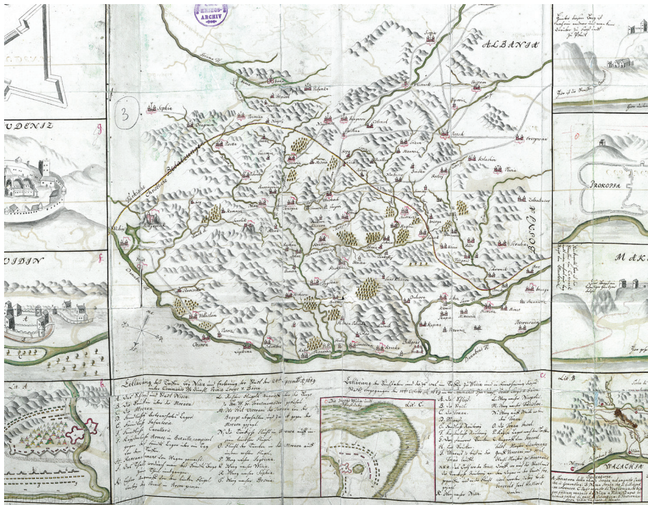
Карта Србије са урђаним аустријским освајањима током 1689. (КА, FA, AFA, 195 X-XIII Türkenkrieg (1689), 1689-13-1)