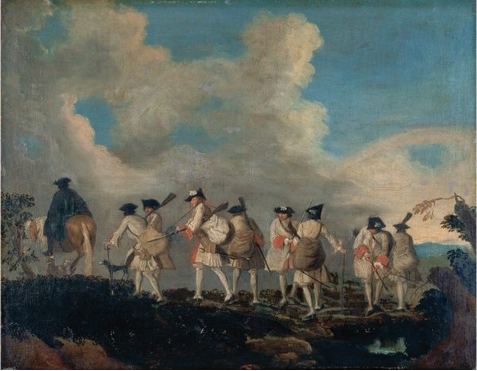
Антоан Вато ( Antoine Watteau ), Рејруји иду да се ѝрикључе ѝуку , Музеји у Глазгову