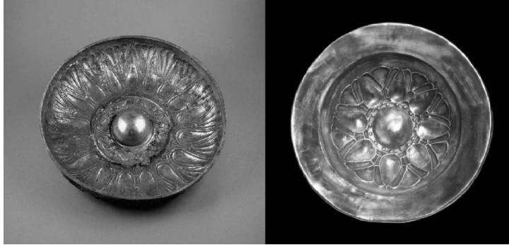
Слика 1: Примери атичких сребрних фијала, из V и IV века пре н. е.