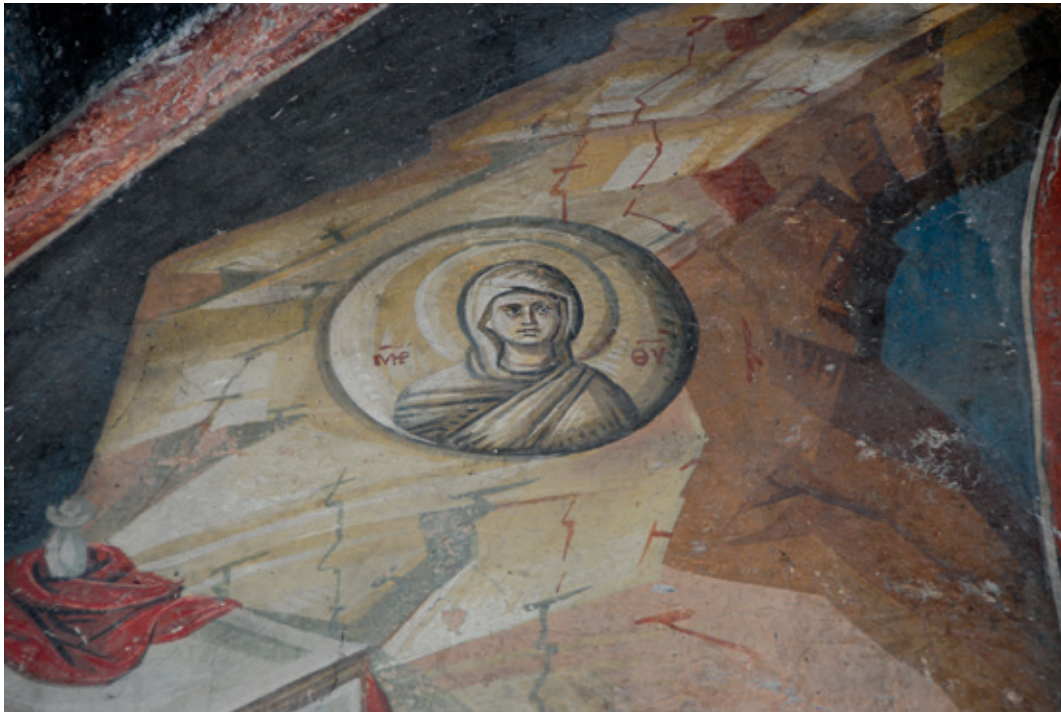
Сл. 7. Навуходоносоров сан – Богородица Гора (детал) Охрид, Црква Богородице Перивлепте, припрата, северни зид (1294/1295)

2015: 61, 66, 127–131). Најстарије типске слике Богородице као Господњег пребивалишта на Сиону, те изједначавање Мајке Божије са Сионом/Јерусалимом свакако су наведене минијатуре псалтира са маргиналним илустрацијама из друге половине IX века. Међутим, комплексне и међусобно повезане теолошке идеје које прожимају Пс 67 (68): 15–16 и његове пратеће илустрације (Богородица Гора, Христос Камен, Инкарнација као почетни догађај домостроја спасења, есхатолошка слика Божијег царства) нашле су место у различитим ликовним програмима.