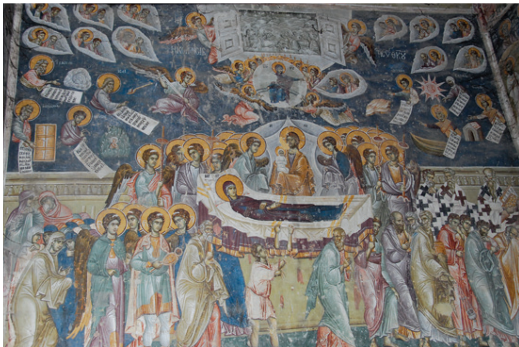
Сл. 8. Успење Богородице Старо Нагоричино, црква Светог Ђорђа, припрата, западни зид (1317/1318)

(Марковић 2011: 131–132, 138, сл. 27, 28; Грозданов 2012: 109–111, сл. 1–4). 8 О идејном концепту сликарства на фасади Пећке патријаршије (пре 1377. године), у чијем програму је и слика Навуходносоровог сна на западном зиду, не може се поуздано судити, с обзиром на то да су фреске у великој мери пострадале (Радовановић 1988: 30–34, црт. 5). Ипак, лична посвећеност ктитора архиепископа Данила II (1324–1337) Богородичином култу, као и сачуван ликовни програм пећке припрате и Одигитријине цркве, сведоче о богатом ликовном репертоару Богородичиних префигурација и типских слика преузетих из Старог завета, где је и епизода о Навуходносоровом сну нашла своје место (Татић-Ђурић 1991: 391–408, сл. 1–11). С друге стране, у оквиру