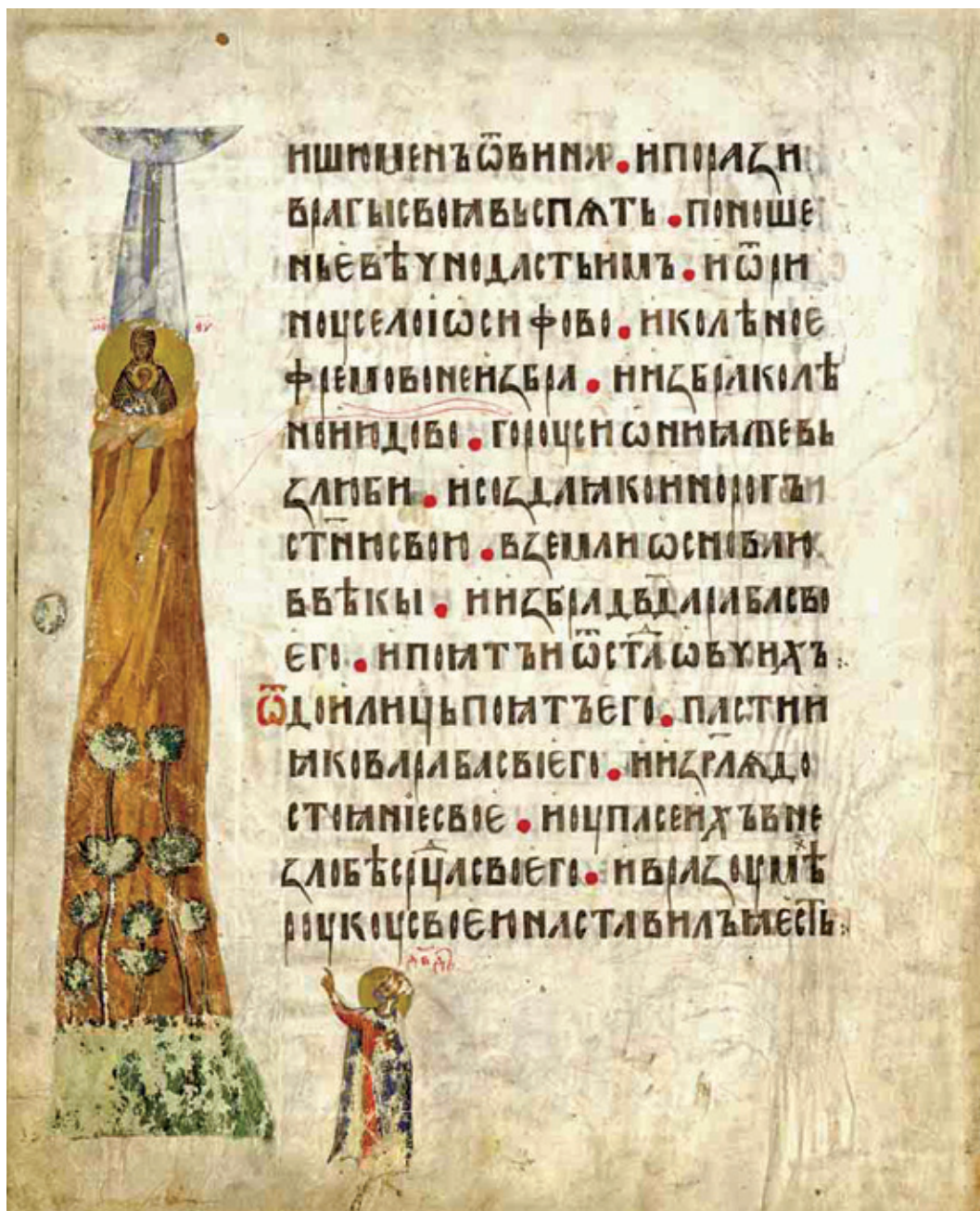
Сл. 13. Гора Сион и Давид [Пс 77 (78): 68–70] Санкт Петербург, Руска национална библиотека, 1252 F VI, fol. 110 v (1397)