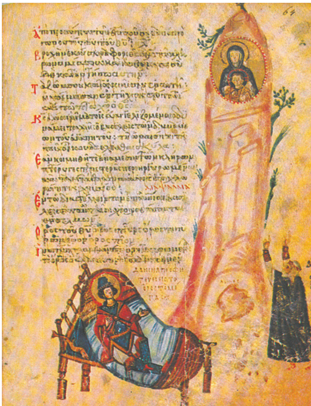
Сл. 1. Навуходносоров сан [Пс 67 (68): 15–16] Москва, Државни историјски музеј, 129g, fol. 64 r (IX век)