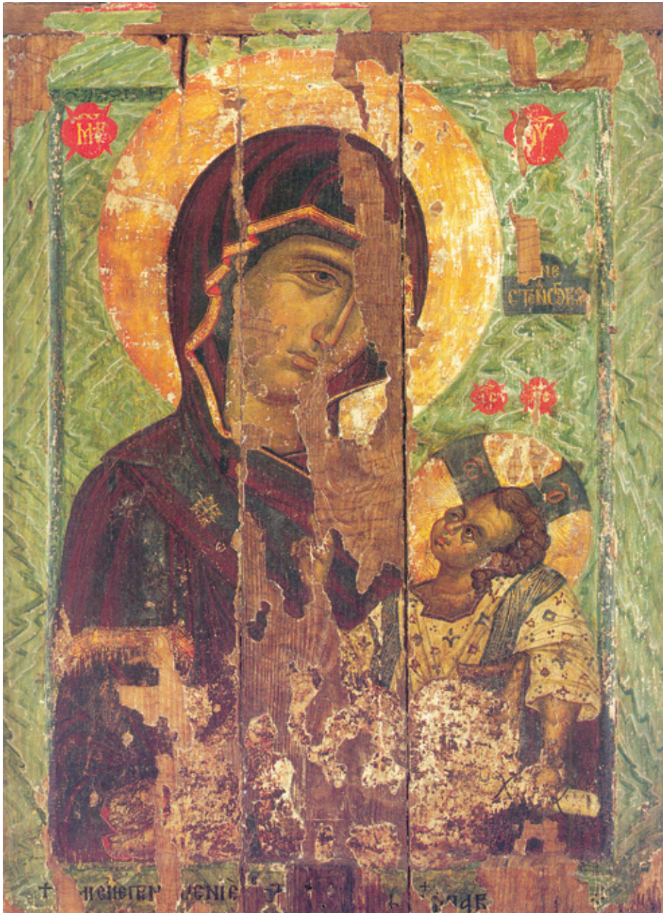
Сл. 10. Богородица Необориме стене са Христом Хиландарска ризница (крај XIV – почетак XV века)