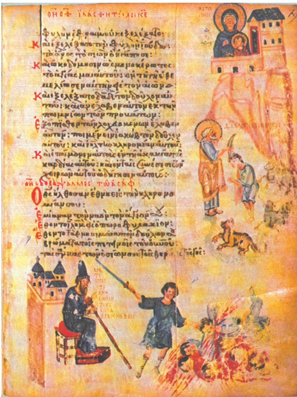
Сл. 11. Гора Сион и Миропомазанье Давида за цара [Пс 77 (78): 68–70] Москва, Државни историјски музеј, 129g, fol. 79 r (IX век)