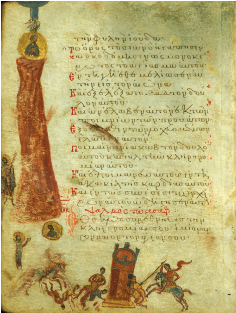
Сл. 12. Гора Сион и цар Давид [Пс 77 (78): 68–70] Балтимор, Уметнички музеј Волтерс, W733, fol. 43v (с. 1300)