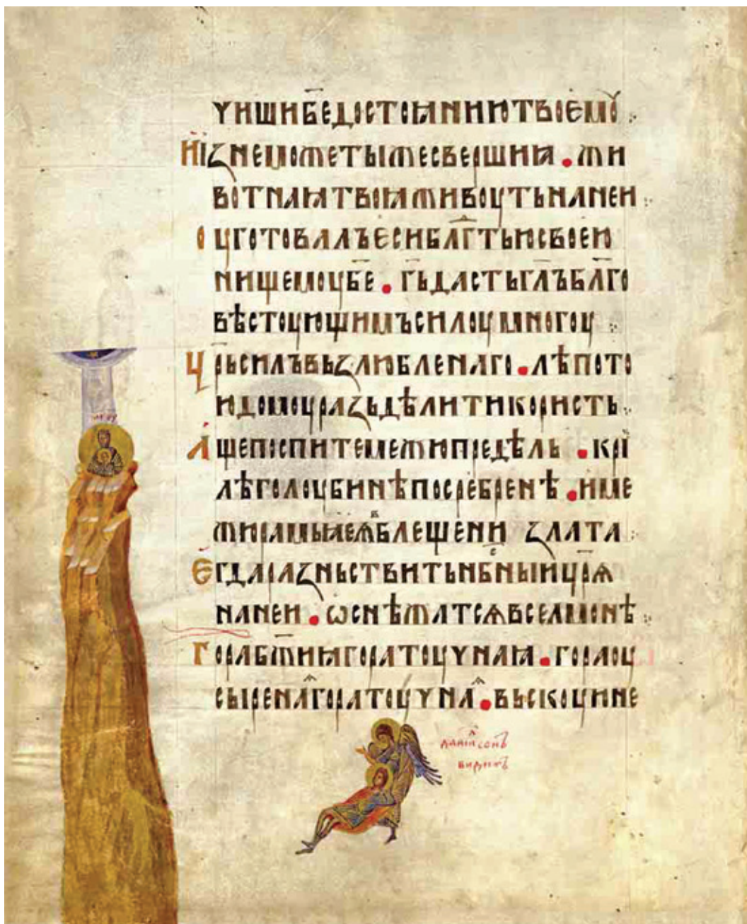
Сл. 4. Навуходоносоров сан – визија пророка Данила [Пс 67 (68): 15–16] Санкт Петербург, Руска национална библиотека, 1252 F VI, fol. 88 v (1397)