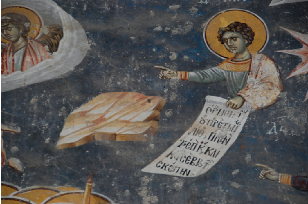
Сл. 9. Успење Богородице – Пророк Данило и стена (деталъ) Старо Нагоричино, Црква Светог Ђорђа, припрата, западни зид (1317/1318)

монументалног програма Цркве Христа Пантократора у Дечанима (1346/1347), композиција Навуходоносоровог сна на јужном зиду западног травеја смештена је међу старозаветне теме које са околним живописом творе специфичну ликовну целину обједињену идејама икономије спасења и установљавања будућег царства Божијег, отпочетог инкарнацијом Логоса (Милановић 1995: 213–219, сл. 3; Тодић, ЧАНАК-МЕДИЋ 2005: 356–360).