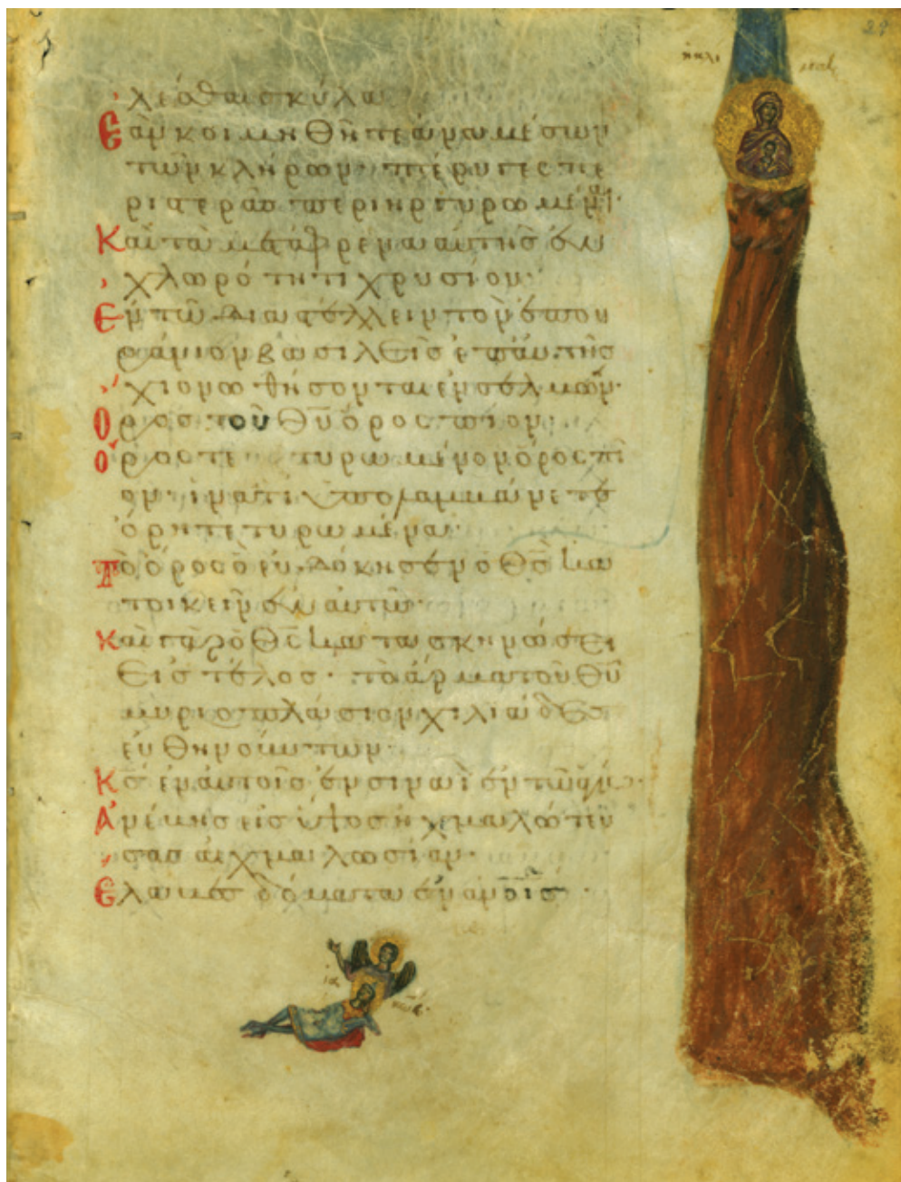
Сл. 3. Навуходоносоров сан – визија пророка Данила [Пс 67 (68): 15–16] Балтимор, Уметнички музеј Волтерс, W733, fol. 43v (с. 1300)