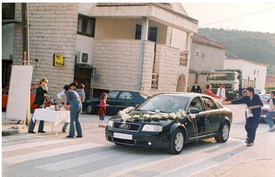
Слика 2. Буклије још једном на делу (Дрвеник, 2004).