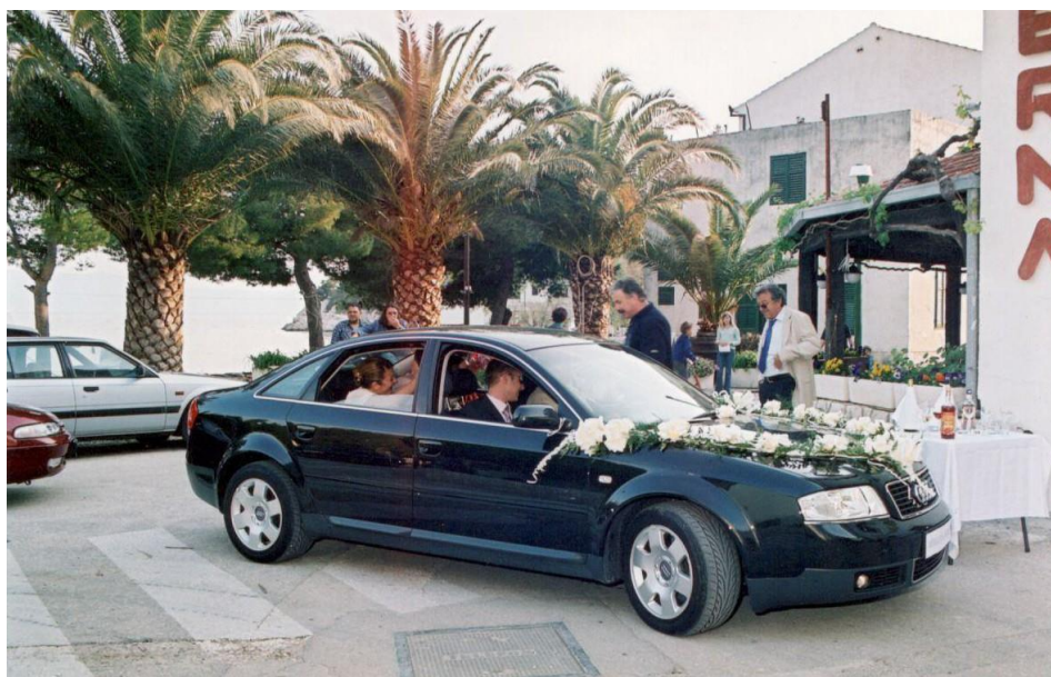
Слика 1. Обичај буклија за време свадбеног веселја (Дрвеник, 2004)