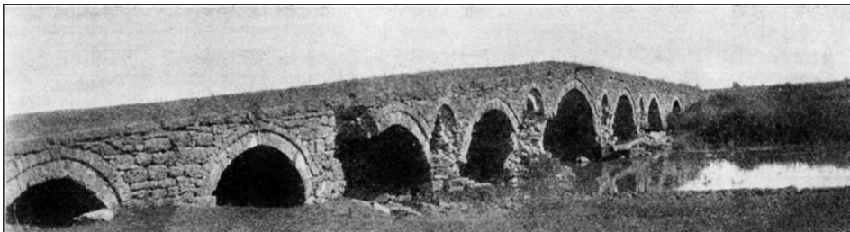
Прилоз 1. Мост на Ситници код Липљана

Чланак је написан као резултат рада на пројекту „Српска нација: интегративни и дезинтегративни процеси” (ев. бр. 177014) који је финансиран од стране Министарства просвете, науке и технолошког развоја Владе Републике Србије.