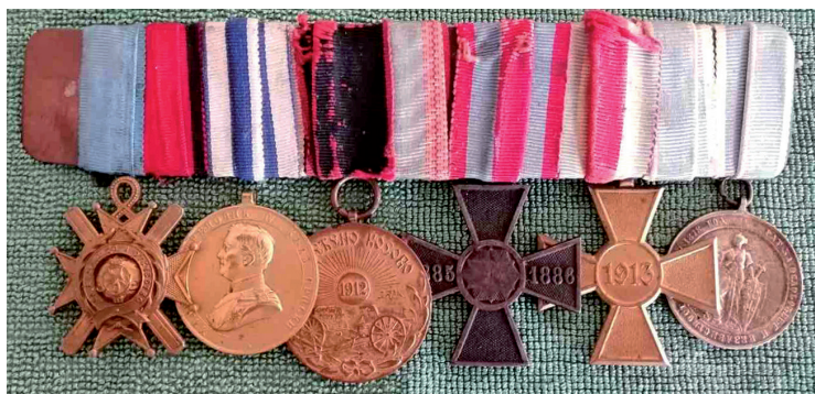
Сл. 3. Одликовања за учешће и допринос у ратовима од 1876. до 1913. године