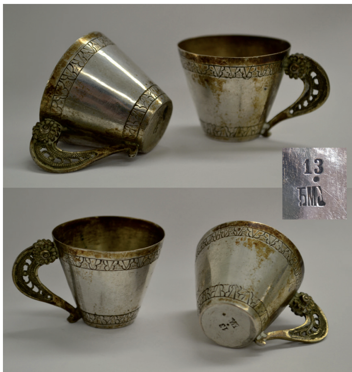
Сл. 7. Сребрни позлаћени зарфови са дршкама од филиграна, рад Ђорђа Јанковића, трећа четвртина 19. века, пунцирано [Ђ М Ј] - [13]

кованог сребра, дуж ивице и бордуре украшени фолијажним орнаментом који се такође јавља на стопи путира и сребрним чашама. Дршке су облика волута од позлаћеног филиграна са крупним отвореним цветом уз горњу ивицу. Декоративно обликовани зарфови припадају османској градској традицији и сфери личне репрезентације посредством луксузних предмета. Према ознакама, могли су настати у трећој четвртини 19. века. Промене у визуелној култури и навикама градског становништва након одласка Османлија биле су довољно споре да одређени предмети типолошки имају продужено трајање.