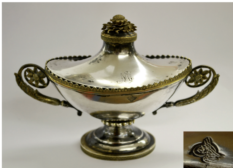
Сл. 10 Посуда од позлаћеног сребра, цариградска радионица, епоха султана Абдул Мецида I