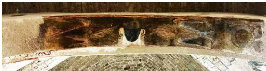
Сл. 3 Богородичина црква у Градцу, потрбушје западног лука, Хетимасија