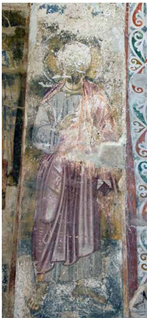
Сл. 5 Богородичина црква у Градцу, потрбушје западног лука, северна страна, Јоаким

Fig. 5 Church of the Virgin in Gradac, soffit of the western arch, northern side, Joachim