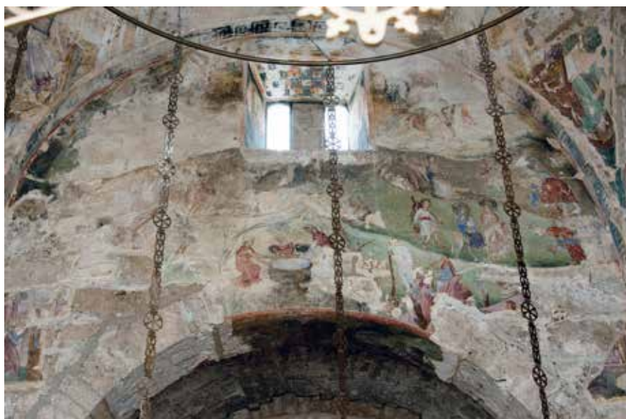
Сл. 10 Богородичина црква у Градцу, јужни зид наоса, Рођење Христово Fig. 10 Church of the Virgin in Gradac, southern wall of the naos, Nativity of Christ

У тамбуру куполе Богородичине цркве у Градцу првобитно је било приказано шеснаест фигура стојећих пророка. 77 Нажалост, осим делимично сачуваних ликова четворице профета за чију идентификацију у овом тренутку нема довољно елемената, остале представе старозаветних личности на том месту у градачком храму сасвим су пропале. Имајући у виду чињеницу да су пророци Гедеон и Данило у градачком храму насликани на потбушју лука изнад пролаза у јужну певницу (Сл. 1 и 7), можемо претпоставити да њихови ликови првобитно нису били приказани и у тамбуру куполе. Ипак, не би требало одбацити могућност, бар када је у питању велики пророк Данило , да се његова представа, осим на поменутом луку, некада налазила и у тамбуру градачког храма. С обзиром на то да су величина и број страница тамбура цркве у Градцу омогућили приказивање великог броја старозаветних личности, 78 може се претпоставити да се у групи од шеснаест фигура профета првобитно налазио и лик пророка Данила . Осим тога, сачувани примери, додуше из познијег српског сликарства, сведоче о обичају сликања поменутог пророка не само у куполи већ и на неком другом месту у истом храму. 79