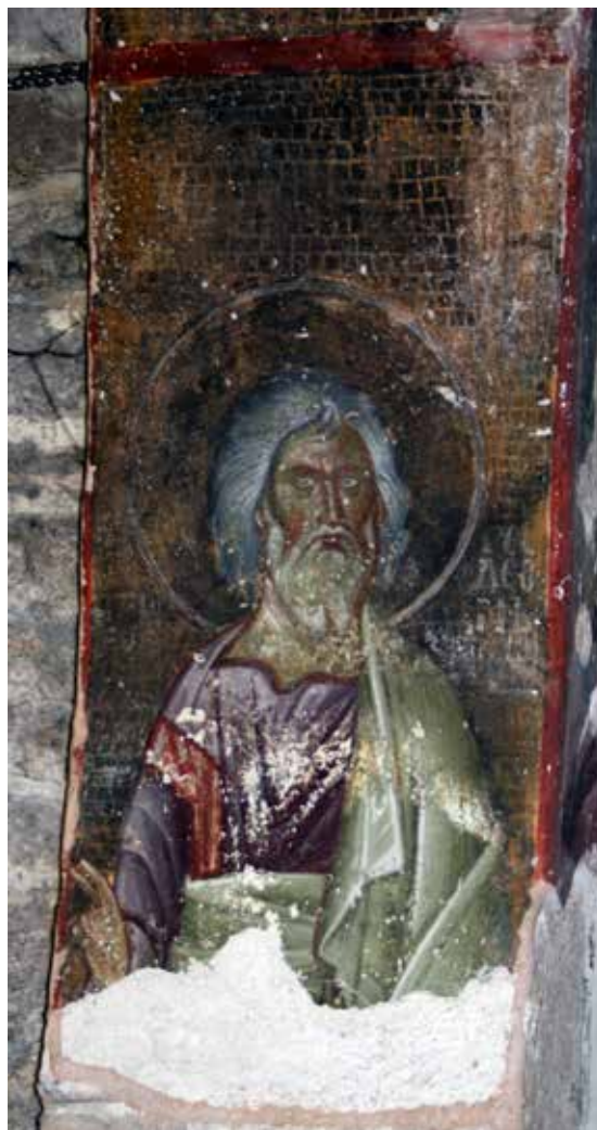
Сл. 8 Богородичина црква у Градцу, потрбушје лука изнад пролаза у јужну певницу, пророк Геден

Fig. 7 Church of the Virgin in Gradac, soffit of the arch above the passage in the southern choir