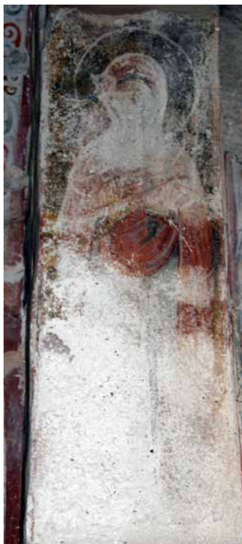
Сл. 6 Богородичина црква у Градцу, потрбушје западног лука, јужна страна, Ана

Fig. 5 Church of the Virgin in Gradac, soffit of the western arch, northern side, Joachim