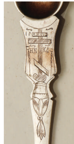
4. Представа Часног крста на Голготи са оруђима страдања, декорација сребрне ложице

Горњомилановачкој цркви Свете Тројице породица Поњавић из села Невада, среза Таковског, поклонила је престони крст од сребра који је у Скопљу израдио и потписао златар Ј. Широка. Поред вотивног натписа, значајне су пунце поменутог златара [ЈЅ], те ознака за сребро финоће 900 Краљевине Југославије – глава жене окренута улево отиснута у елипси са два клинаста зареза (сл. 5). Овај велики жиг био је на снази од 1933. године на подручју Краљевине Југославије за крупне предмете од сребра домаће израде. 11 Описане ознаке на крсту који је израђен у Скопљу, као конкретном артефакту са одговарајућим ознакама из овог периода доприносе бољем познавању златарства у међуратној Југославији. Такође скопски крст драгоцен је и због рефлексја балканске визуелне културе уочљивих у декорацији овог предмета. Гравирани украс на бочним странама постаментa са цветним вазама