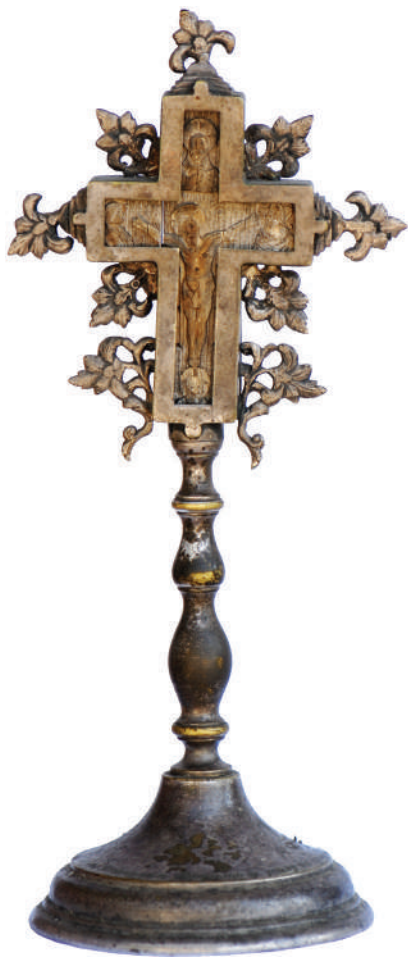
8. Крст из цркве у Љутовници