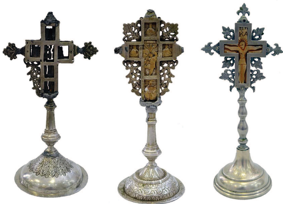
6. Крстови из ризнице Старе цркве: крст приложен 1857. године (лево), крст из друге половине XIX века (средина), крст приложен 1933. године (десно).

Први крст чије је Распеће Христово готово нестало, дарован је, према натпису, 1857. године: „приложн елка синъ своѣе п: рнста за споменъ 1857 годнѣ“. Стопа је декорисана биљним мотивима, дршка је у форми ливеног балустра, док је раван оков крста украшен ливеним флоралним декоративним елементима који су радијално распоређени око њега. 42