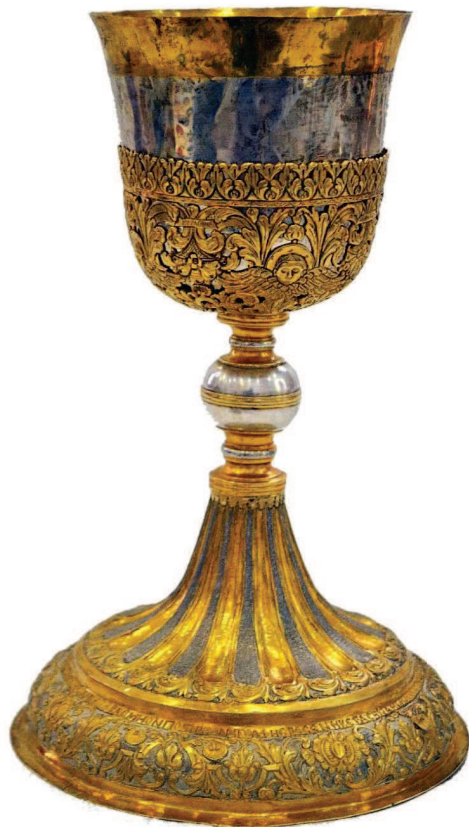
7. Путир у литургијској употреби од оснивања јагодинске цркве Светог Арханђела, пореклом из манастира Светог Атанасија, израђен 1789. године.