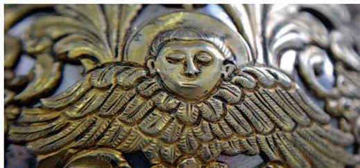
8. Детаљ путира, декорација на стопи и део натписа са годином израде (лево), орнамент на гнезду чаше и представа Херувима (десно).