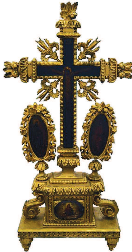
5. Дарохранилница Старе јагодинске цркве, друга половина XIX века.

жаловања. На дрвеној кутији је са предње стране приказан Исус Христос који благосиља Часне дарове (слика 5), док сцена на другој страни приказује Недреmano око. 36 Исте композиције налазе се на дарохранилници Саборне цркве у Београду коју је осликао Димитрије Аврамовић. 37 Одабране представе наглашавају најпре јеванђеоско установљење евхаристије, а потом и њен жртвени карактер, водећи порекло из барокне амблематике православног света која уводи у сликарство алегоричке представе евхаристије замењујући њима традиционалну представу Причешћа апостола. 38 Сликани програм одговара функцији овог богослужбеног предмета намењеног чувању Часних дарова, али и упутству из Служабника по коме је кивот у коме су похрањени морао да буде покривен, имана себи крст и са „Божественим тајнама“ стоји на Часној трпези. 39