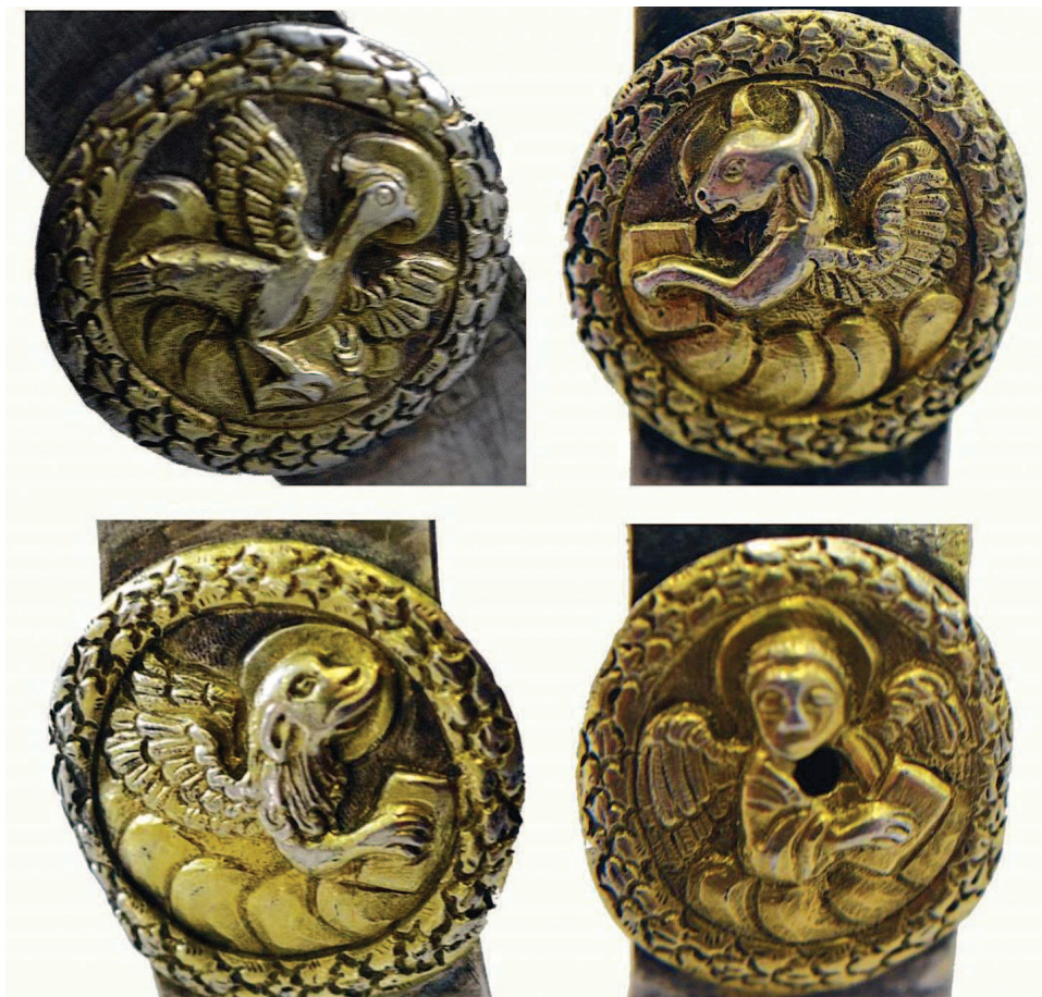
13. Симболичке персонификације Јеванђелиста: орао, крилато теле, крилати лав и анђео – човек, детаљи звездице.

Декорација диска и звезде, повезаних литургијском функцијом, исказују заједно сложене идеје посредством изабраних сцена, сумирајући евхаристијску тематику Христове жртве кроз представу поклоњења Агнецу (Мелисмос) на дискусу, да би потом били упућени на њен коначан есхатолошки смисао преставом Христа као Цара Славе. Програм украшавања богослужбених предмета, који на малој површини сумирају велика учења цркве, почива на истим идејним, теолошким и симболичким премисама као и циклуси фреско сликарства и сложени програми иконостаса.