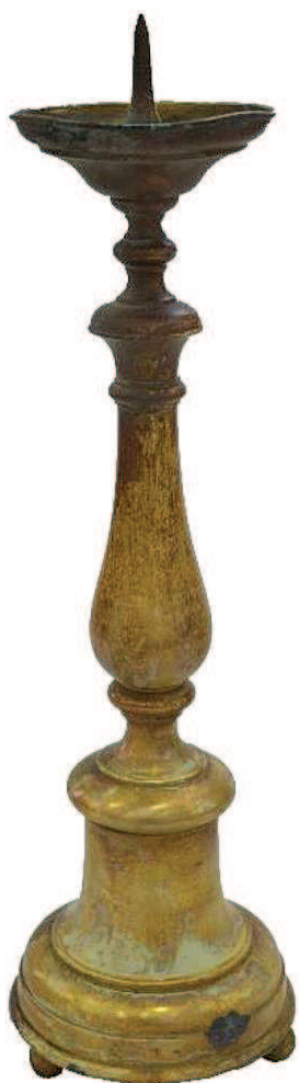
18. Месингани чирак, друга половина XIX века.

Храм поседује и један масивни месингани чирак, који такође може припадати његовој опреми из прве половине XIX века. 78 На купастом постољу, које почива на три лоптасте стопе, постављен је ливени балустер са тацном на врху и клином за свећу (слика 18). 79 Форма свећњака и место израде везани су за простор средње Европе. Овај вид свећњака намењених богослужењу био је важан део опреме црквеног ентеријера, у коме је дуго, поред оне симболичке и литургијске, имао и практичну функцију осветљавања простора.