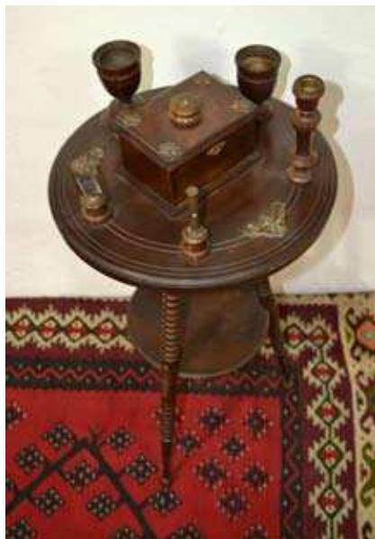
Сто за пушење, XIX век

Писаћи сто израђен је од светлог смеђег дрвета, једноставних геометријских форми. Радна плоча постављена је на два бочна ормарића, изнад којих су три фиоке, једна на средини и две бочно. Горња радна површина тапацирана је зеленом чојом, док су ивице стола од дрвета. Столица такође припада типу намештаја који је индустријско - занатски произвођен с краја XIX века. Извијене линије ногара и наслона, као и седишњи део тапациран шпанском трском, одговарају типу столица