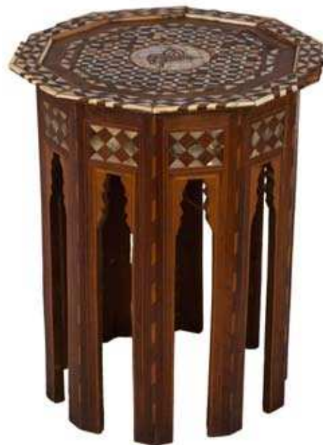
Сто донесен са путовања у Цариград, османска радионица, XIX век.

Један од првих већих интернационалних успеха Мокрањац је остварио на хорској турнеји, током које је 1895. године најпре обишао бугарску престоницу Софију и потом стигао до Цариграда. Београдско певачко друштво поздравило је на паради селамлика султана, на његовом пролазу до џамије ради молитве. Концерт је одржан у Илдиз сарају и позоришту Petits Champs , а присуствовали