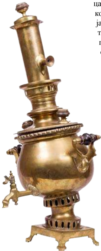
Самовар, Русија, крај XIX века.

цариградских дворских мајстора од XVII века. 18 Орнамент од корњачевине, у форми султанске тугре куће Османа, недовољно је јасно изведен да би могао бити прецизно идентификован и рашчитан, будући да поседује све формалне елементе које тугра мора да поседује: две овалне петље са леве стране, три вертикалне линије у средини, две паралелне линије на десној страни и сложено прецизно калиграфско поље на дну које би требало да садржи име султана, његове титуле, име оца и молитве. 19 Драгоцени материјали упућују такође на неку од угледнијих цариградских радионица, које су деловале током XIX века. Према усменом казивању, сто је након концертног успеха поклоњен композитору, као вид награде и признања. 20 Још једна османска меморабилија била је видно истакнута у трпезарији Мокрањчевог дома – изнад сервана висила је златовезена тугра на округлом текстилном купону, док су бочно од ње била два ромбична панела, на којима су биле закачене медаље и признања композитору. 21