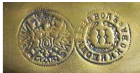
Пунце на поклопцу самовара, ознака радионице.

Карактеристичан за руско поднебље, месингани самовар припада типу овоидних самовара, чије је тело у облику јајета, глатко полирано без украса, док је уз горњу ивицу украс у форми астрагала. Поклопац има две дрвене дршке облика гљиве, док се на њему налази традиционални држач за чајник, затим цилиндрични додатак за одвод дима коме недостаје ручица, као и завршни поклопац, такође са дршком као на поклопцу. Постављен је на квадратно постоље са четири ноге. Горнионик има два прстена са отворима за ваздух. Ручке