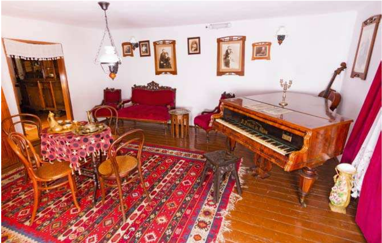
Ентеријер са делом салона Мокрањчеве спомен куће у Неготину.

тор потекао, будући да су поједини експонати који припадају грађанској култури Неготина из XIX и првих декада XX века, изложени као допуна која речитије контекстуализује изложени материјал унутар епохе у којој је истакнути композитор живео и стварао.