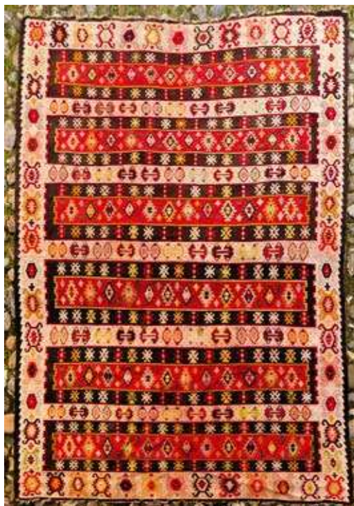
Пиротки ћилим, кувери, крај XIX века.