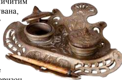
Мастионица, сецесија, крај XIX века.

тип предмета намењен различитим видовима конзумирања дувана, везан за грађанску културу која је овој навици давала извесну ритуализовану и естетизовану форму. 31 Сточић је округлог облика, постављен на три токарене ноге, учвршћене мањом хоризонталном плочом. На горњој плочи, у средишту је постављена кутија за дуван – цигарете, декорисана металним апликацијама, као и слободне ивице стола. Око кутије распоређени су држачи за остатак прибора, најпре две пепељаре са металним улошцима, затим држач за палидрвца, чирак за свећу такође са металним улошком и цилиндрични секач за цигарете. 32