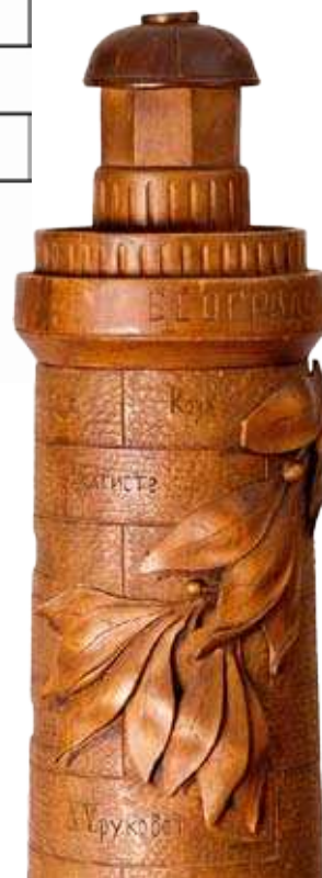
Детаљ дубореза са ловоровом граном и лантерном.