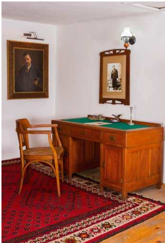
Писаћи сто Стевана Ст. Мокрањца, крај XIX века.

Најважнији елемент његовог поседа свакако је био музички инструмент, односно полуконцертни клавир, израђен у Бечу у радионици F. Peukert , награђеној 1882. и 1883. године сребрном медаљом за квалитет. Фурниран је смеђим фурниром и декорисан дамаскирањем металном траком дуж ивице поклопца, док су у угловима флорални картуши, допуњени интарзираним овалним седефним медаљонима. Држач за педале је у форми лире, док су предње ноге масивне, полигоналне и постављене на тачкове. Држач за ноте испод поклопца је украшен дуборезом. На клавиру је месингана плочица са натписом: „Клавир почившег Стевана Ст. Мокрањца композитора сада својина Првог београдског певачког друштва“.