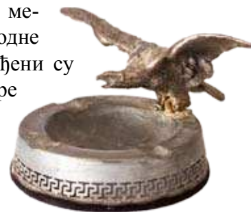
Пепељара са фигуром орла, крај XIX века.

У покушају да се верно реконструише композиторов радни амбијент у спомен кући, на писаћем столу постављена је мастионица са пером за писање. Овакав тип ливених мастионица од легуре метала, изведен у рустификованој варијанти сецесије, карактеристичан је за подручје Централне Европе у коме се Мокрањац кретао и из које је у српску средину импортован велики број истористи-