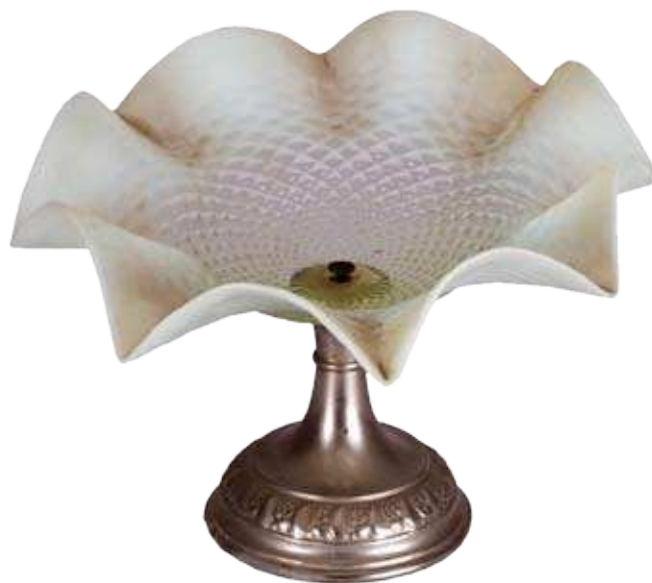
Бомбоњера, легура метала и стакло, крај XIX века.

Сабрани из заоставштине, лични предмети, меморабиле, успомене са путовања и делови мобилијара породице Мокрањац, осликавају не само њихове личне навике и афинитете већ и припадност друштву које је свој приватни простор артикулиса-