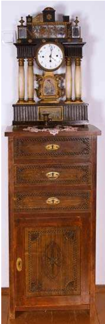
Комода, дуборез Мице Мокрањац, почетак XX века.

чки изведених предмета. Поред мастионице, изложена је и округла пепељара са фигуром орла раширених крила.