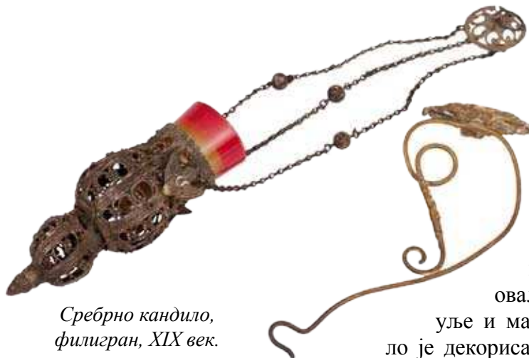
Сребрно кандило, филигран, XIX век.

Пред кућном иконом Светог Николе 39 породице Стевана Ст. Мокрањца, висило је сребрно кандило, начињено од филиграна, тракама и прстеновима са гранулама. Подељено је у два овална сегмента, већи који држи чашу за уље и мањи завршен сребрним жиром. Кандило је декорисано ливеним анђеоским фигурама дуж обода, и постављено на три ланца са филигранским