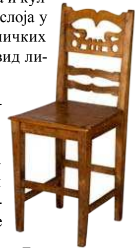
Дрвене столице, израдила Мица Мокрањац, почетак XX века.

Трпезаријска витрина једноставног је правоугаоног облика, састављена од доњег дела у виду креденца над којим су две фиоке, и горњег правоугаоног дела застакљеног двокрилним вратима. Фронтови врата у доњем делу дуборезани су спиралним орнаментом, волутама и листовима. Фиоке су глатке, као и вратнице које држе дуж ивица брушено стакло витрине.