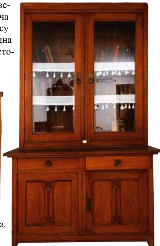
Библиотека, Стевана Ст. Мокрањца, крај XIX века

и дрвоног намештаја израђиваног од стране браће Тонет у Бечу ( Gebrüder Thonet ), који је сматран савременим и удобним у Мокрањчево време.