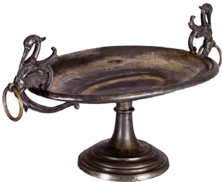
Фрутијера са чапљама, легура метала, друга половина XIX века.

широком грађанском слоју, чију су стварност естетизовали, коњуктурни предмети различитих намена и материјала били су карактеристични за простор како Централне Европе тако и Србије, у периоду названом – fin de siècle .