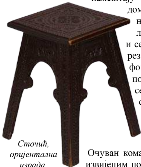
Сточић, оријентална израда.