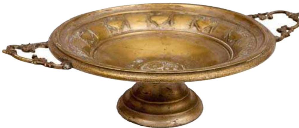
Фрутијера, месинг, крај XIX века.

Овој великој групи сродних објеката припадају предмети попут чиније са чапљама, која је начињена од легуре метала ливењем, у форми овално издужене, степенасто профилисане посуде на округлој стопи. Дршке су изведене у облику стилизованих чапљи, а на свакој се налази по један прстен. Сродна је и округла месингана посуда на ниској бази типа стоне фрутијере, изведена