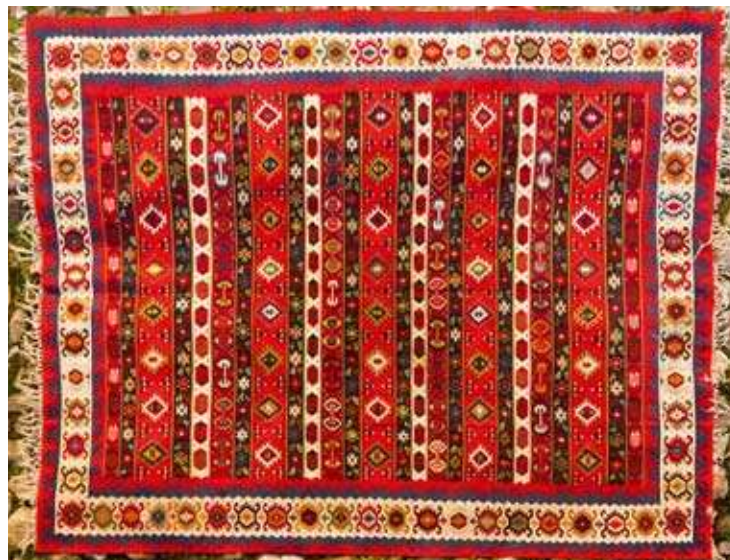
Пиротки ћилим, смирјанска шара, крај XIX века.

нодусима у средини, док је матица која их држи прикупљене ливена на пробој. Према типу и декорацији, изведено је у јужнобалканској радионици половином XIX века. Поводом 125-годишњице рођења Стевана Ст. Мокрањца, спомен кући су 1981. године, од стране Мирославе Мокрањац, дарована три пиротска ћилима. 40 Сва три ћилима неједнаке величине, припадају истом типу и украшени су