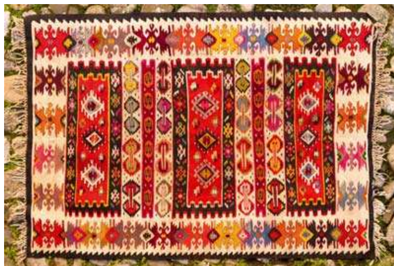
Пиротки ћилим са смирјанском шаром, на бордури Рашићева плоча, почетак XX века.