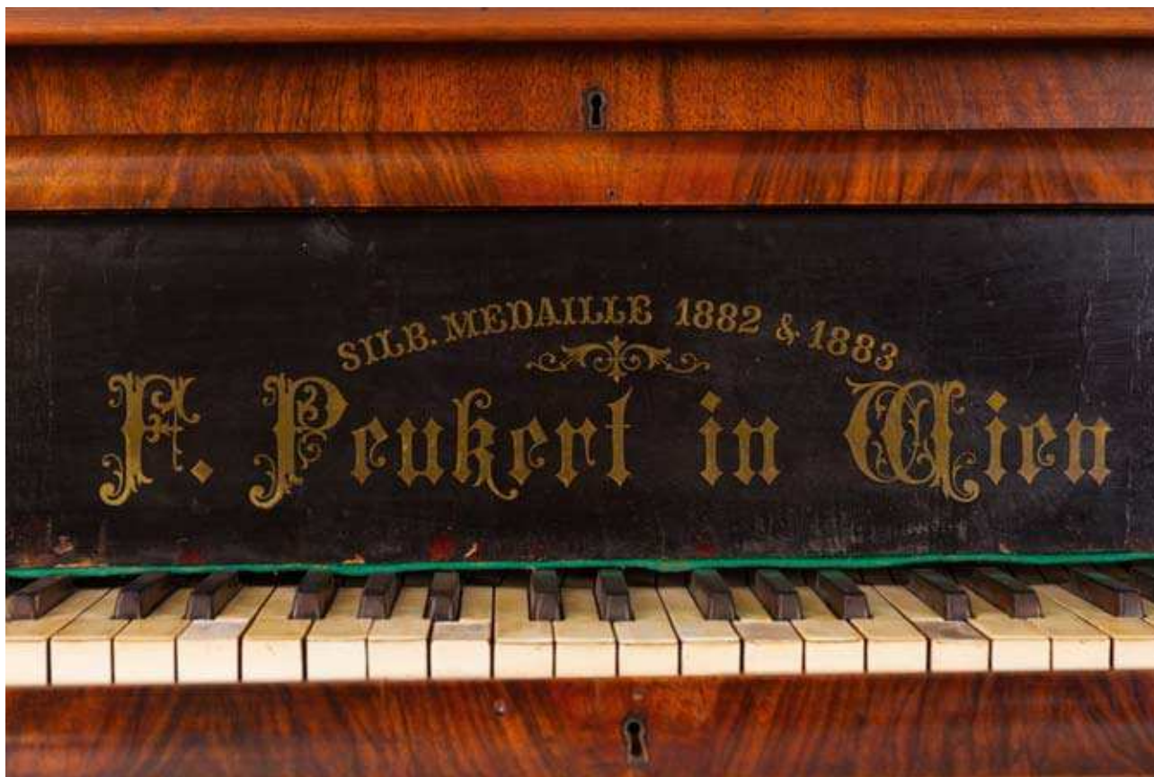
Клавир, радионица F. Reukert, крај XIX века, Беч.

слова А, а глазура је светлија и тонирана до бледозелене. Овакав тип декоративне уметничке керамике, произвођен је у серијама 27 на простору Бохемије, као важног занатско-уметничког центра, који је снабдевао тржиште Централне Европе уметничким и декоративним предметима од порцелана, керамике и стакла. 28 Ваза је обликована под стилским утицајем сецесије, али нешто рустичније израде и интерпретације. Према изгледу и карактеристикама настала је крајем XIX века.