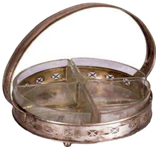
Стонa корпа, посребрена метална легура, стаклени уметци, крај XIX века.

ло на веома сличан начин, широм европског простора, чак и позног Османског царства, које се постепено преображавало управо савременим тековинама индустријализације и производима из периода историзма. Српско грађанство кретало се током XIX века између двају културних модела, али је, као на примеру Мокрањчеве заоставштине, видљиво да је на крају века било опредељено за њима савремене тековине више него за различите видове ретроспективности.