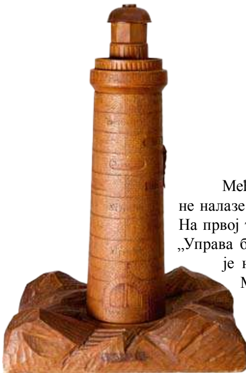
Кула светиља – меморабилација поводом јубилеја 1909. године, израдио Јарослав Крејчик у Београду.

Београдског певачког друштва и гостију, присуствовали изасланици мађарског певачког друштва из Дебрецина и изасланици београдског Сокола. 4