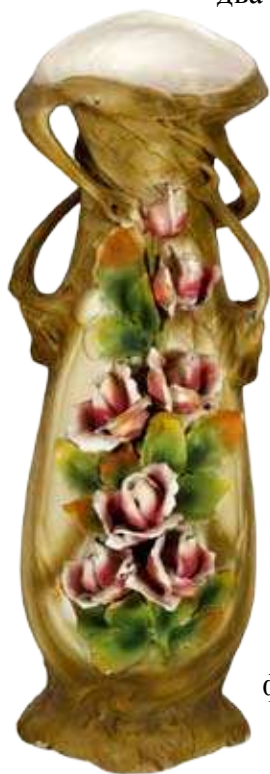
Ваза, сецесија, крај XIX века. рељефно истакнути листови и орнамент у облику латиничног

Ваза је израђена од мајолике. Основа је бела, док је споља покривена тонираном маслинастозеленом мат глазуром. При врху, биљни преплет формира по две дршке на странама вазе. 26 Дуж предње стране, целом висином су пластично изведени цветови и пупољци руже, са листовима у светлозеленим тоновима, док су цветови бледоружичасти. Са задње стране су рељефно истакнути листови и орнамент у облику латиничног