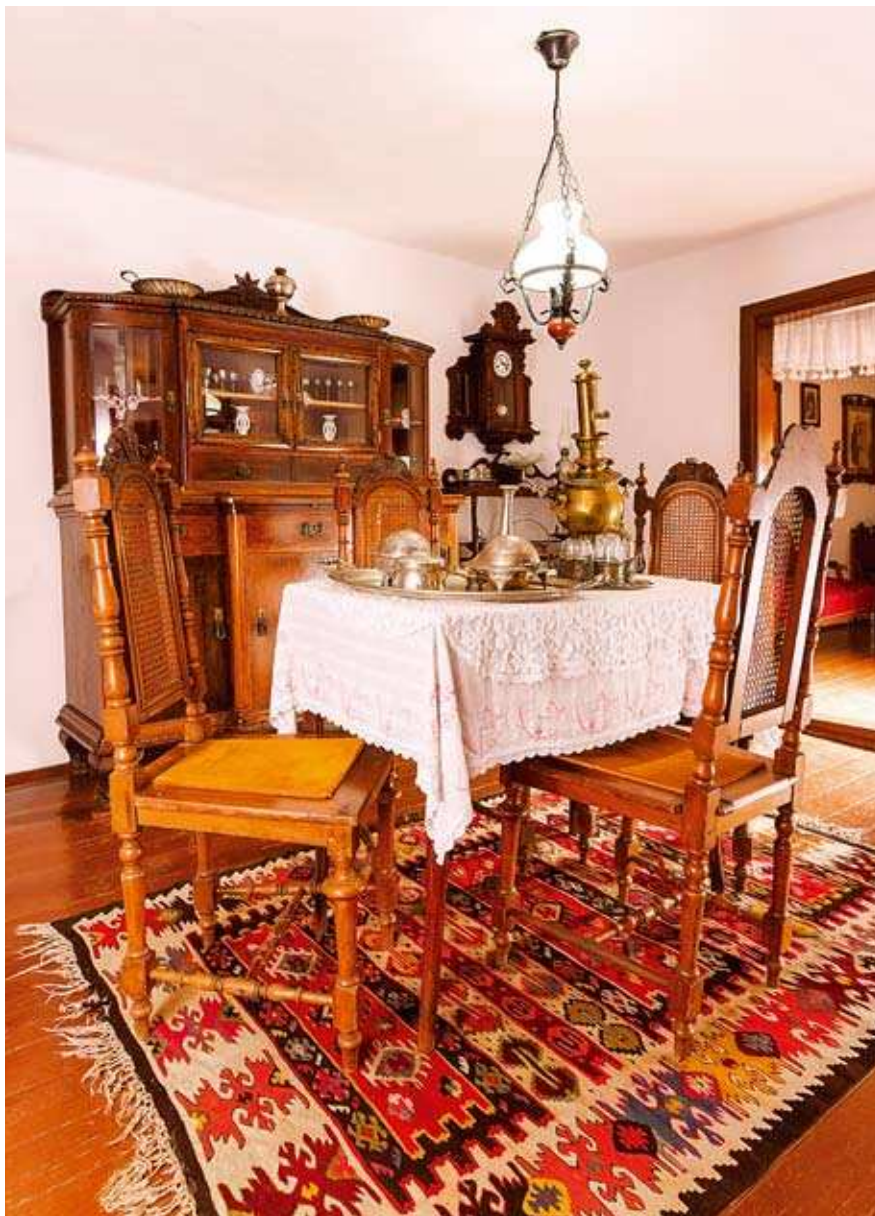
Ентеријер са делом трпезарије Мокрањчеве спомен куће у Неготину.

Поједини предмети који потичу из заоставштине неготинских градских трговаца, а којима је спомен поставка допуњена и контекстуализована, припадају групи декоративних објеката свакодневице. Произвођени су полуиндустријски у серијама, штанцовани углавном од различитих легура уколико су били од метала, и као такви, тековина су истористичке епохе исто колико и технике галванопластике и посребривања којим су израђивани. Намењени