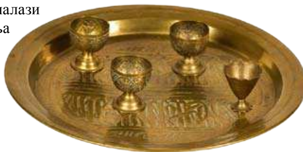
Месингана тацна са зарфовима, почетак XX века.

Из заоставштине породице даровани су и поједини мањи предмети, попут месингане тацне са филџанима за кафу и једне гасне