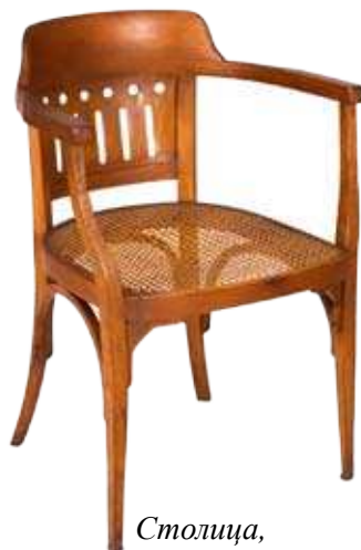
Столица, Стевана Ст. Мокрањца, крај XIX века.