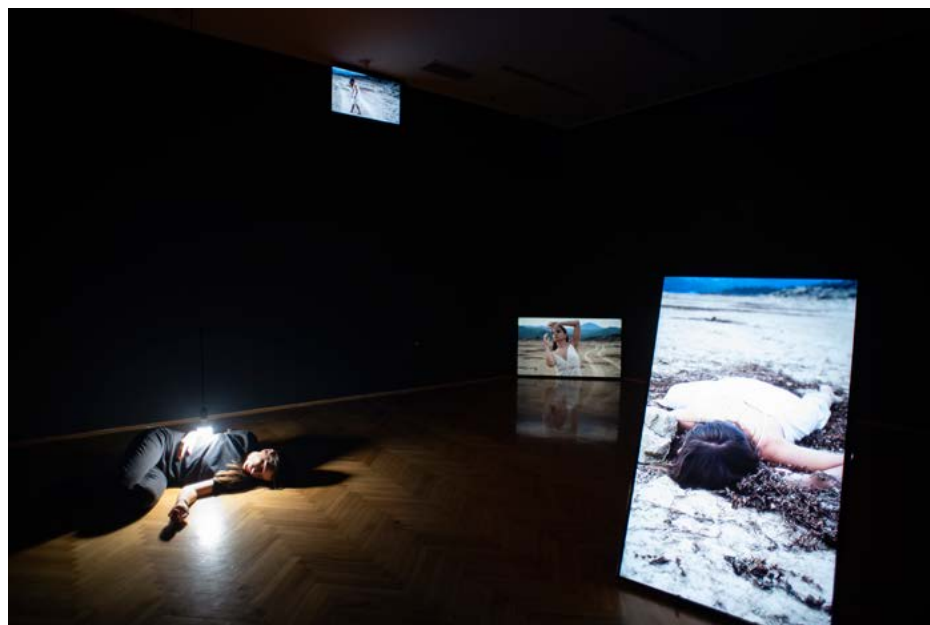
Čiji su moji snovi, mix media: performans, devetokanalna video-instalacija, audio, svjetlo, 2022.

Prostornu instalaciju Čiji su moji snovi umjetnice Milke Delibašić čini devet kratkih video-formi, ritmički postavljenih u prostoru Galerije „Botanička bašta“, gdje se ova dinamika postavke uspostavlja i očitava na dva nivoa: jedan je precizno osmišljena, čvrsta struktura, uzglobljenih metalnih proteza/nosača i objekata/ekrana, a drugi – mreža pokretnih slika. Iako se ova mreža odnosā čini već dovoljno kompleksnom, umjetnica je dodatno usložnjava uvođenjem još jednog elementa, umnogome drugačijeg po svojoj medijskoj prirodi. Riječ je o umjetničinom nepomičnom tijelu, koje razvija komplementarne relacije u već zamršenoj konstelaciji odnosa. Pitanje u nazivu stvara vrtoglavicu i decentrira odgovor, te se naslovom naglašeno moji , kojim se želi implicirati lično, radikalno cijepa i seli u ono što slike žele.