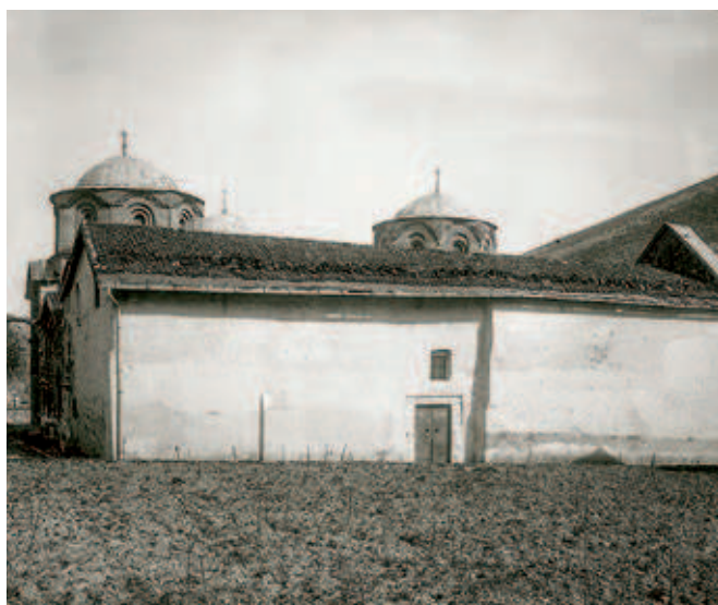
Сл. 377 и 378. Пешка патријаршија, јужна и западна фасада пре конзерваторско-рестаураторских радова из 1931–1932. године