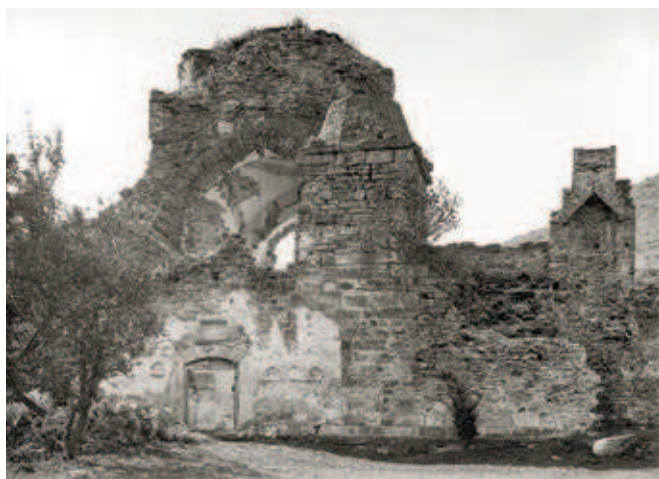
Сл. 383 и 384. Црква Светог Стефана у Бањској пре конзерваторско-рестаураторских радова, снимци из 1934. године

и скулптура потоњег манастира и током наредне две године, 1939. и 1940. Тада је музеј обавио последње снимање неког средњовековног споменика, а даљи теренски рад спречен је избијањем Другог светског рата. Током свих поменутих кампања начињено је око 1.500 снимака споменика на Косову и Метохији и урађен је велики број акварела с распоредом живописа и приказом архитектуре. 37