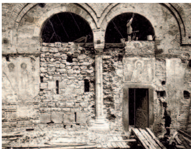
Сл. 380 и 381. Пешка патријаршија, јужна фасада припреме током конзерваторско-реставраторских радова из 1931–1932. године

стова и студија монографског карактера у којима су манастири и цркве на том подручју, услед ширег интересовања за њихово истраживање, тумачени са историјскоуметничког аспекта. Њихови аутори, за разлику од старијих испитивача старина,