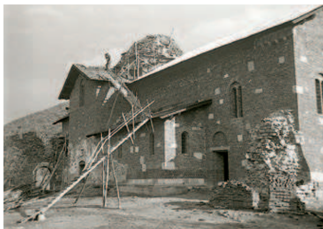
Сл. 385 и 386. Црква Светог Стефана у Бањској током радова, снимци из 1938. и 1939. године

живописа и проналазе им аналогije. О представама историјских личности – владара, племића и црквених лица – у Грачаници, Богородици Љевишкој, Дечанима и Богородици Одигитрији у Пећи писало је