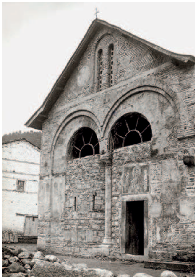
Сл. 382. Пећка патријаршија, јужна фасада припрате по завршетку радова из 1931–1932. године