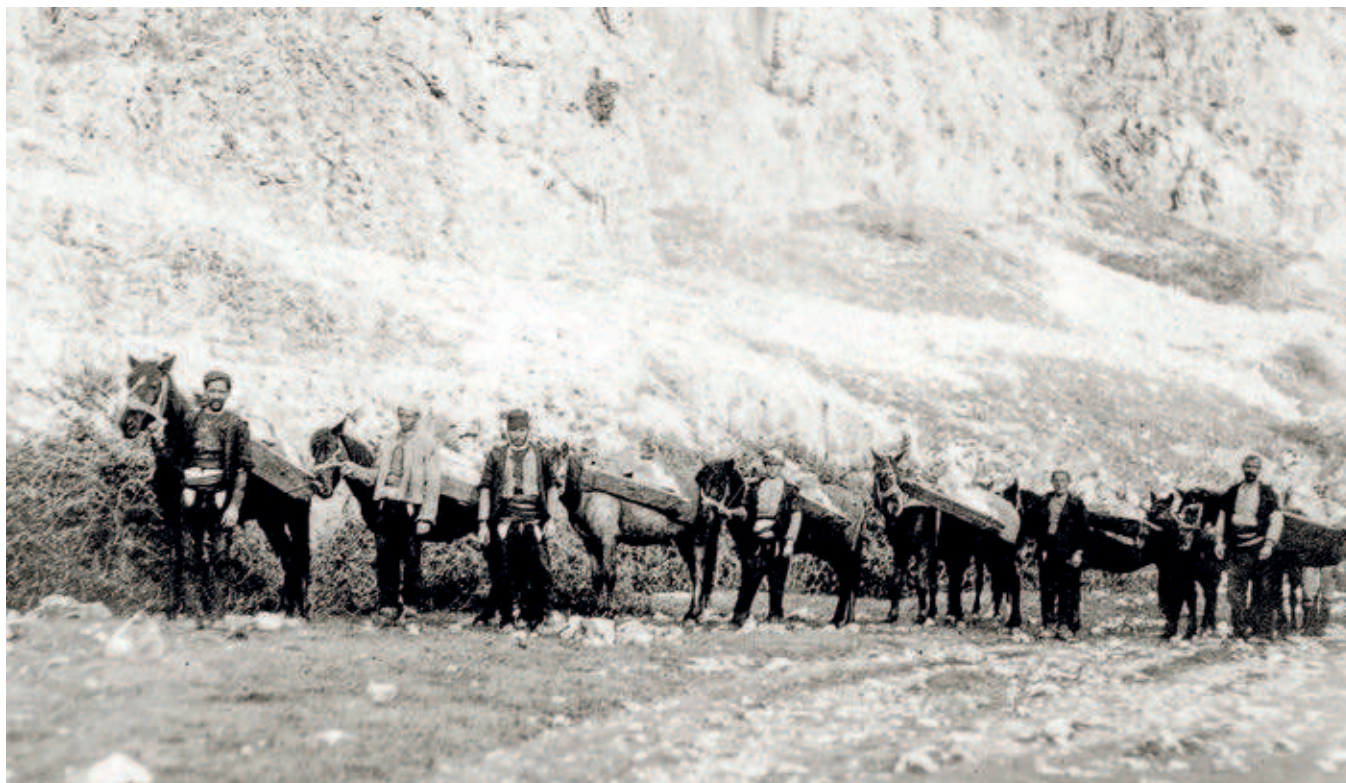
Сл. 388. Свети арханђели код Призрена, преношење археолошких налаза из Душанове задужбине у Куршумли-хан у Скопљу