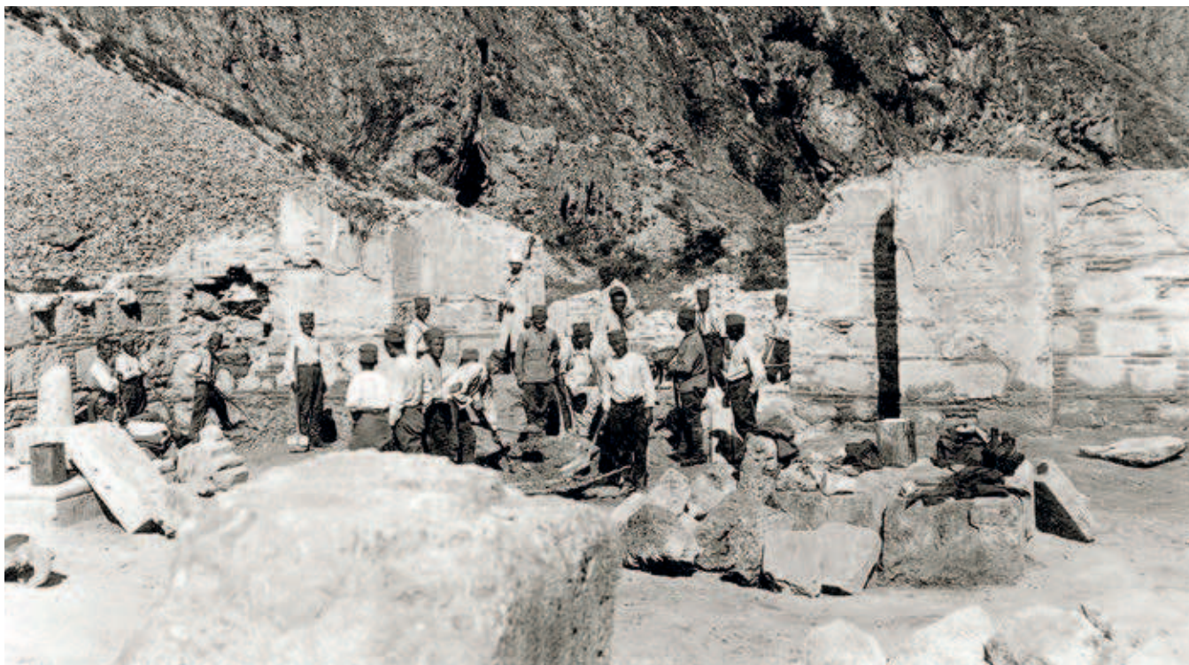
Сл. 387. Свети Арханђели код Призрена, археолошко ископавање у манастиру, снимак из 1927. године

Први покушај организоване заштите у Краљевини Срба, Хрвата и Словенаца повезује се с формирањем Комисије за чување и одржавање историјско-уметничких споменика при Министарству вера 1923. године. 69 Под надзором и контролом те комисије, прикључене 1930. Синоду Српске православне цркве и привремено укинута 1934, извођени су, када је реч о споменицима у косовскометохијској области, радови на обнови Пећке патријаршије и цркве Светог Стефана у Бањској. 70 Након двогодишњег прекида, увидевши потребу за даљом стручном сарадњом, Синод је 1936. године основао Саветодавну комисију за чување архитектонских споменика. Упркос разним потешкоћама у раду, њени су чланови на неколико седница одржаних до почетка 1938. године разматрали могућности извођења радова неопходних за збрињавање и санацију манастира Бањске и Дечана, то јест за спречавање њиховог даљег пропадања. 71