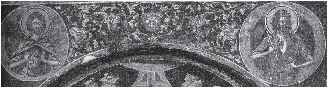
Сл. 5 свети Алексије Божји човек и свети Јефросин Повар, црква Светог Николе у манастиру Дилиу на острву на јањинском језеру ( Monasteres de l'île de Ioannina. Peintures , M. Garidis et A. Paliouras (eds), Ioannina, 1993, 267, fig. 447)