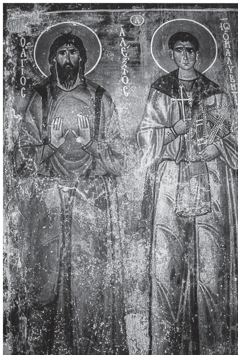
Сл. 1 свети Алексије Божји човек и свети Јован Кали- виг, црква Светог Николе у Какопетрији на Кипру (S. Tomeković, Les saints ermites et moines dans la peinture murale byzantine , L. Hadermann-Misguich et C. Jolivet-Lévy (eds), Paris, 2011, 339, fig. 1)