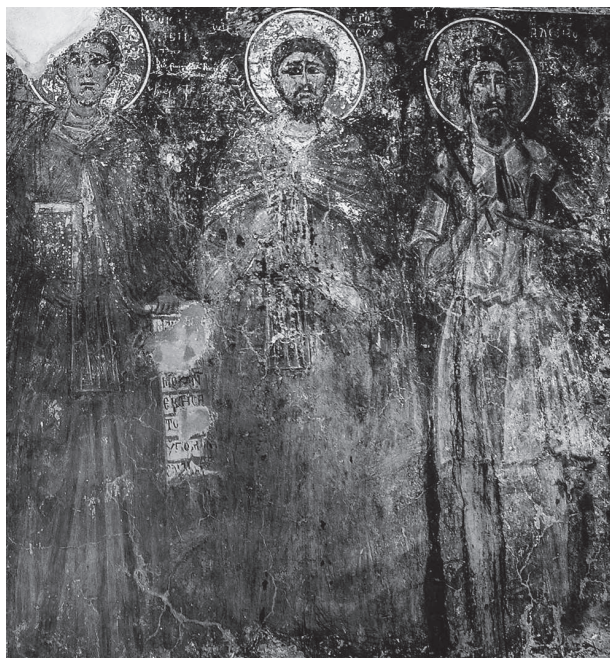
Сл. 3 свети Јован Каливиг, свети Јефросин Повар и свети Алексије Божји човек, црква Светог Георгија у Асари на Криту