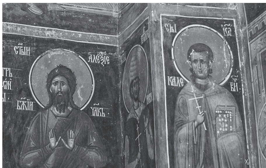
Сл. 7 свети Алексије Божји човек и свети Јован Каливит, Богородичина црква у Студеници