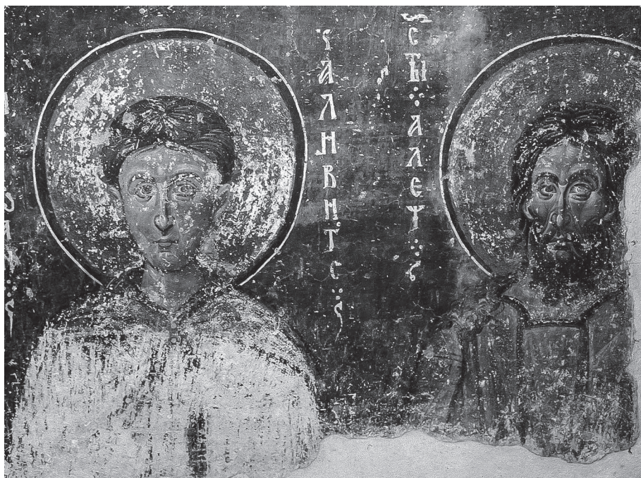
Сл. 6 свети Алексије Божји човек и свети Јован Каливит, манастир Милешева