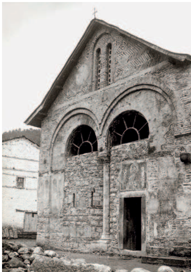
FIG. 382. THE PATRIARCHATE OF PEĆ, SOUTHERN FAÇADE OF THE NARTHEX AFTER THE COMPLETION OF WORKS IN 1931–1932

1920. The churches of Prizren were investigated in 1924, more specifically the Virgin Ljeviška and the Holy Ascension. Tours of churches and monasteries in the area of Kosovo and Metohija continued in the following period (1935–1944), when Milan Kašanin headed the Prince Paul Museum. Since the aim of the Museum's new management was to compile a comprehensive photographic archive and as much visual documentation as possible of all major monuments in the country, Gračanica, the Patriarchate of Peć and Dečani were photographed from 1936 to 1938, while the frescoes and sculpture of the last monastery were also photographed over the following two years – 1939 and 1940. This was the last visual documentation the Museum made of a medieval monument, as the outbreak of World War II brought its fieldwork to a halt. All of these campaigns resulted in approximately