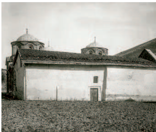
FIGS. 377 AND 378. THE PATRIARCHATE OF PEĆ, SOUTHERN AND WESTERN FAÇADES BEFORE CONSERVATION AND RESTORATION IN 1931–1932

the representation of the Pantokrator on the dome of the same church; 18 and Miloš Milojević was taken by the frescoes in the sanctuary of Gračanica. 19 The last researcher's inventory of the compositions and individual depictions of saints in the dome, sanctuary and western part of the Church of the Mother of God in Peć was very detailed,