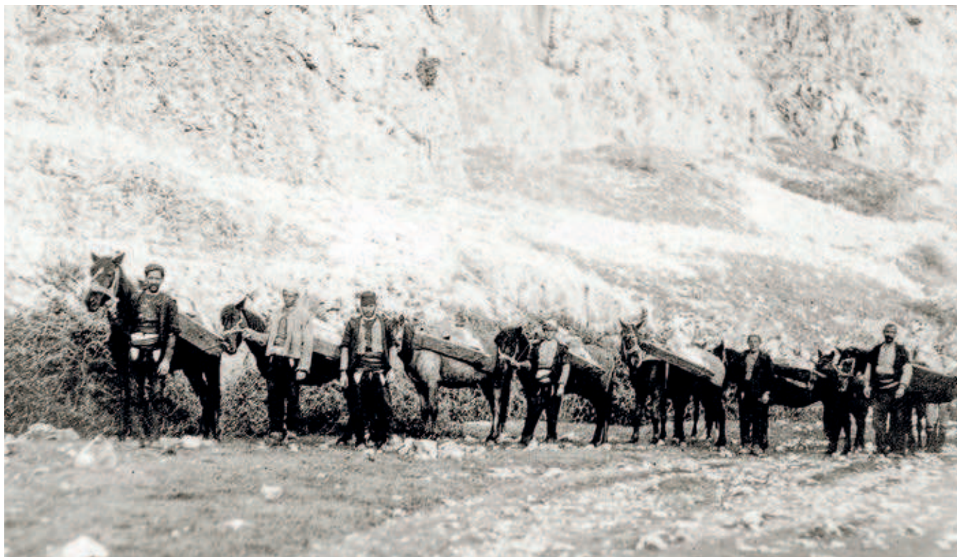
FIG. 388. HOLY ARCHANGELS NEAR PRIZREN, TRANSFER OF ARCHAEOLOGICAL FINDS FROM DUŠAN'S FOUNDATION TO KURŠUMLI-HAN IN SKOPJE

knowledge about the churches of the Patriarchate of Peć altered the previous understanding of the complex. Bošković discovered its original narthex (fig. 382), previously believed to have been built entirely in the time of Patriarch Makarije, and noted the presence of painted decoration on the façade and the remains of red façade mortar on the churches in Peć. He also suggested that a horizontal wall once stood between the western bay of the naos and the original narthex instead of the existing pilasters, while parekklesia flanked the lateral walls of its naos – a hypothesis confirmed by later research. During the works to secure the church complex at Peć, the original wall paintings were discovered under the layer of frescoes dating from 1875 in the dome, space below the dome, apse and choirs in the main Church of the Holy Apostles (fig. 379). The work of Djurdje Bošković to conserve the paintings in the Patriarchate of Peć was a pioneering effort, which provided a key contribution to the development of professional conservation in the Serbian milieu of his time.