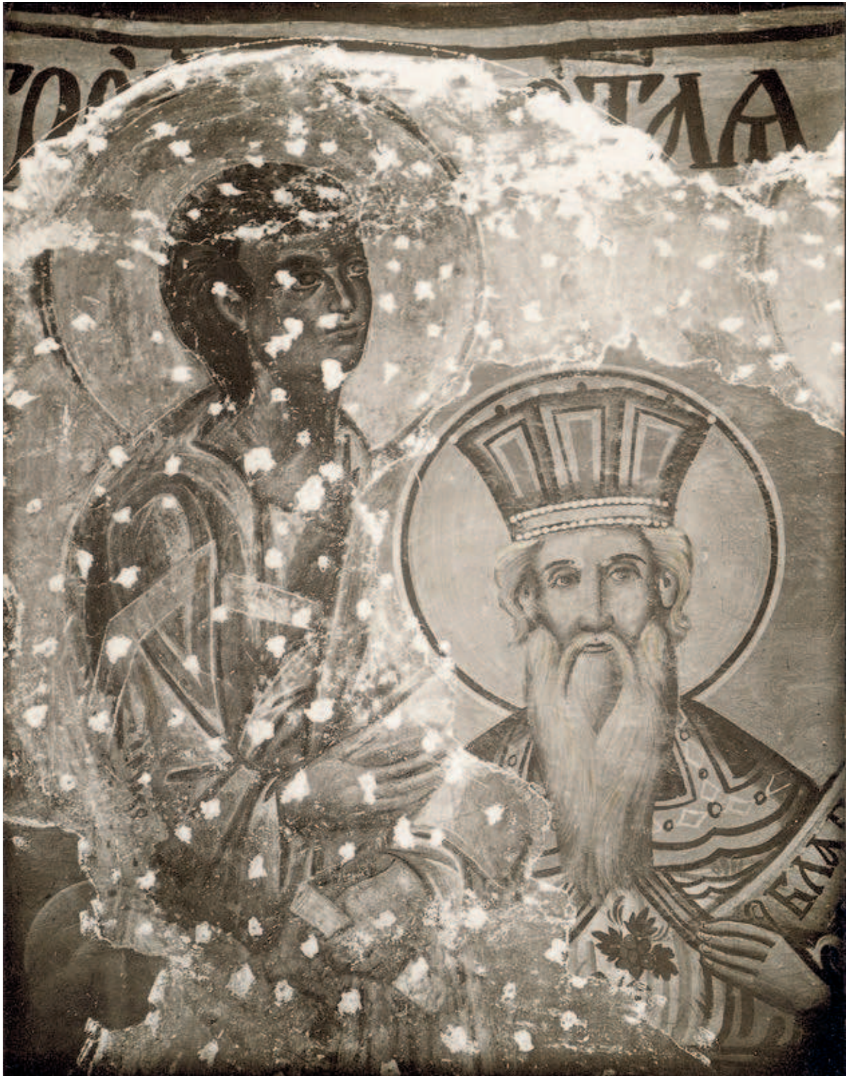
FIG. 379. THE PATRIARCHATE OF PEĆ, CHURCH OF THE HOLY APOSTLES, DOME, 13 TH -CENTURY FRESCOES UNDER A LAYER OF WALL PAINTINGS FROM 1875, PHOTOGRAPHED DURING CONSERVATION AND RESTORATION WORKS IN 1931–1932