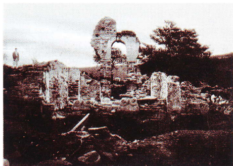
Остаци Богородичине цркве у Топлици