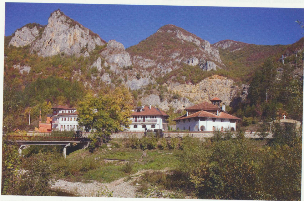
Манастир Добрун