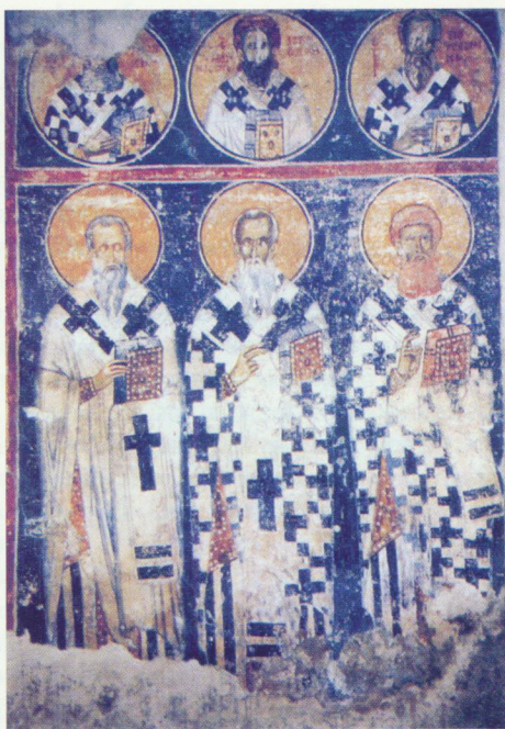
Свети архијереји, медаљони и фреска на северном зиду Благовештенске цркве