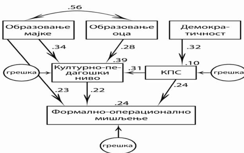
Графикон 3. Издвојени предиктори приликом тестирања модела приказаног Графиконом 2

Добијени модел односа предикторских варијабли објашњава 24% варијансе зависне варијабле што је више него што објашњава модел приказан графиконом 1, где је објашњено 16% варијансе. Тај податак указује да је тестирани модел у овом истраживању (графикон 2) боља полазна основа за разумевање породичног контекста развоја формалних операција у односу на модел у коме је претпостављен директан утицај свих предикторских варијабли. Резултати указују да нису потврђени сви предвиђени односи предикторских варијабли као и да су добијени неки односи предиктора и критеријума који нису очекивани. Они чине базу за ревидирање полазног модела.