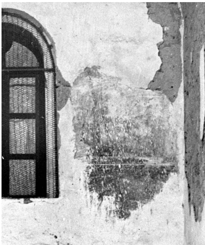
Сл. 7. Детаљ са сл. 6 Fig. 7. Detail from the fig. 6