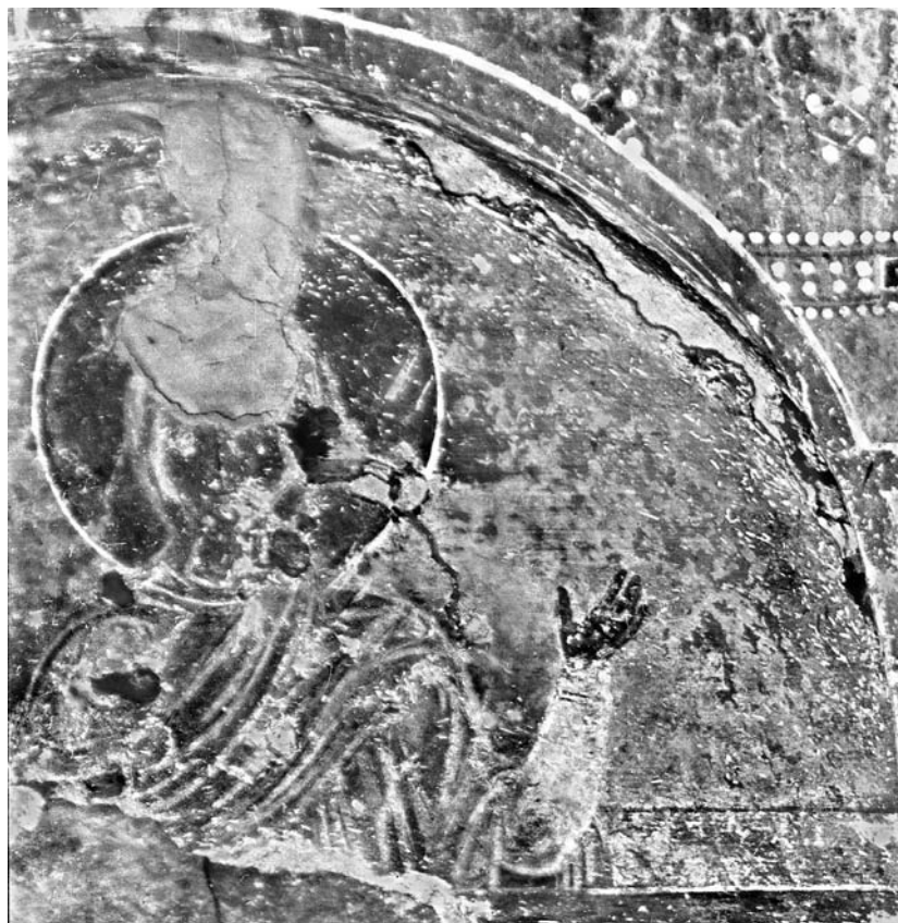
Сл. 8. Богородица Оранџа у луњети изнад пролаза из наоса у њрипрајцу Сјасове цркве у Жичи Fig. 8. The Mother of God Orans in the lunette above the passage from the naos to the narthex of the church of Ascension in Žiča

И у неким другим српским црквама из средњег века агијазма је била постављена уз представу Крштења спуштеног у најнижу зону. Најстарији познати пример сачувао се у Хиландару (1321), 23 а затим следе они у Трескавцу (око 1340), 24 већ поменутом Леснову (1349) и цркви светог Николе у Палежу (око 1350). 25 Представа Крштења Христовог и пратеће сцене обезбеђивале су агијазми одговарајући богослужбени контекст. 26 Наиме, Велико освећење воде — које се врши на Богојављење —