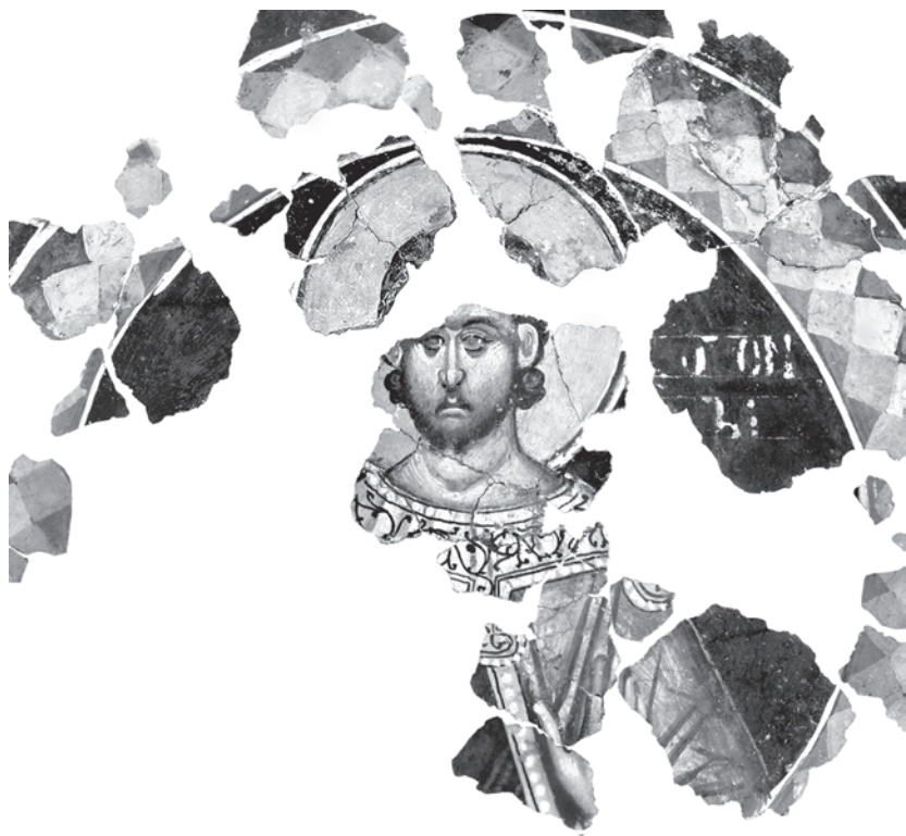
Сл. 1. Свети Созон, црква Светих Теодора у Жичи Fig. 1. St. Sozon, the church of the Saints Theodore in Žiča

обухваћена јединственим приказом. Планирано је, стога, да она буде изложена и обрађена у неколико наврата.