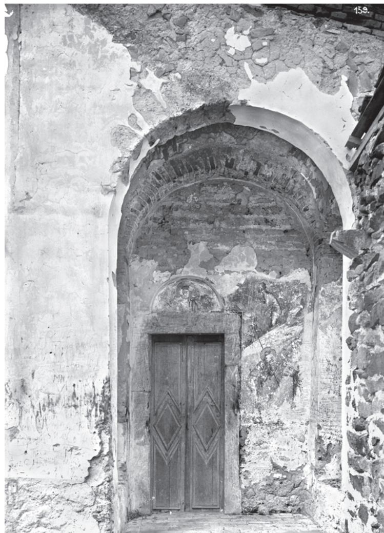
Сл. 2. Трем пред улазом у параклис Светог Сѳафана у Сѳасовој цркви у Жичи Fig. 2. Porch in front of the parekklesion of St. Stephen in the church of the Ascension in Žiča

Прву од двеју сцена везаних за делатност светог Јована Претече, насликаних на јужној страни трема пред Првомучениковим параклисом, Петковић је добро препознао. Видљиви су рука Господња која благосиља из сегмента неба и у молитви погнути Крститељ што прима заповест од Бога (сл. 4). Нема стога сумње да је сцена илустровала стихове из Лукиног и Јовановог јеванђеља који говоре о томе како је свети Јован био Богопослан да проповеда крштење на Јордану. Предложено препознавање потврђују и иконографска поређења. Сцена у Жичи сасвим одговара једном од видова представљања Божијег позива Претечи да проповеда покајање у средњовековној уметности православних. 11 Друга поменута сцена, међу-