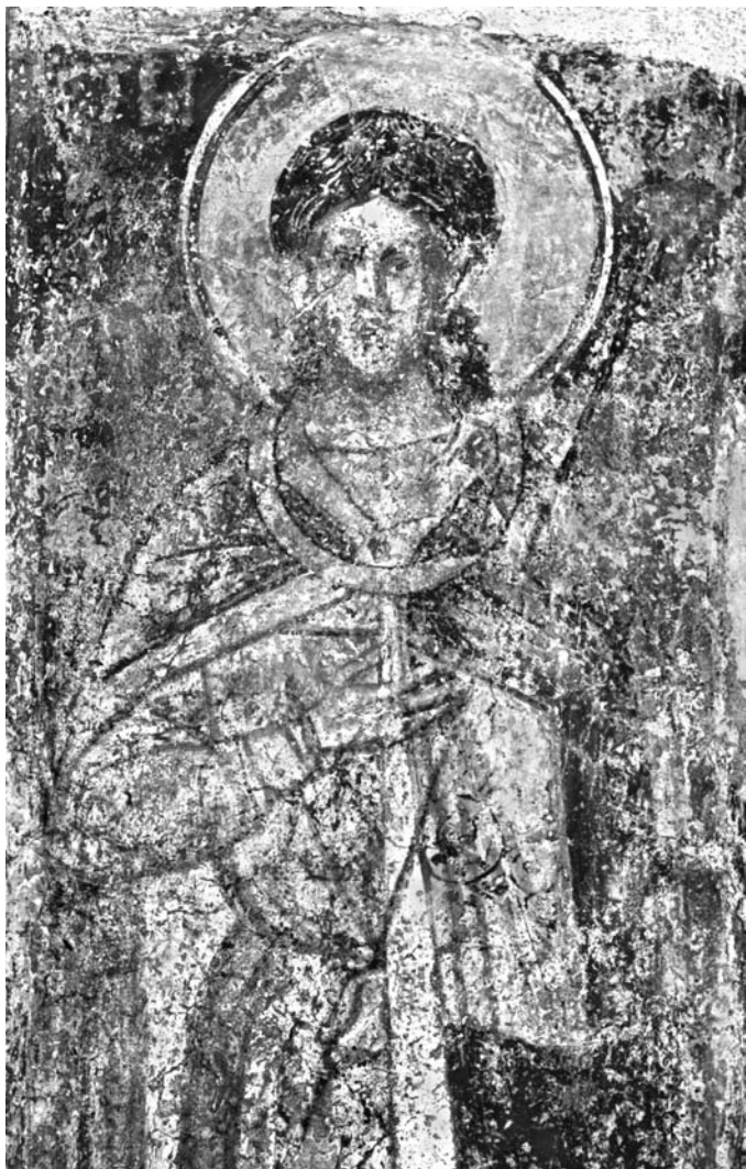
Сл. 19. Свети Вакх или свети Сергије, југозападни појкујолни пиласџар Сјасове цркве у Жичи Fig. 19. St. Vakhos or St. Sergios, the southwestern sub-dome pilaster of the church of Ascension in Žiĉa

крају јужног зида северног жичког параклиса. Она показује особену физиономију светог, коју је обележавала сасвим широка, таласаста, равно подсечена брада. Таква физиономија и архијерејско одејаније потпуно одговарају знатно старијем и славнијем имењаку Атанасија Атонског — светом Атанасију Великом, то јест Александријском. 49 Стога нема места ни најмањој сумњи да је овде управо о њему реч. Поред описане физиономије и архијерејских одејди, оправданост препознавања чувеног александријског патријарха у разматраној представи потврђује и део пратећег натписа, видљив још увек крај ње (а...|сиџ). И остала слова Атанасијевог имена, сада знатно слабије разазнатљива, Петковић је некада сигурно могао да прочита.