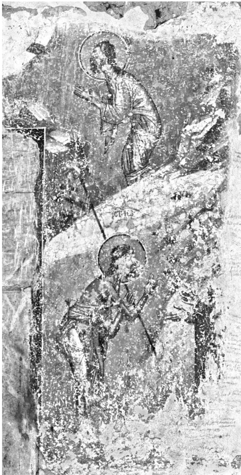
Сл. 4. Сцене из циклуса делањности светог Јована на Јордану, детаљ са сл. 2