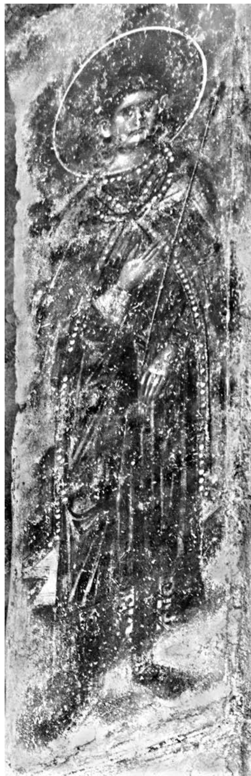
Сл. 18. Свети Сергије или свети Вакх, северозападни појкујолни њиласџар Сџасове цркве у Жичи