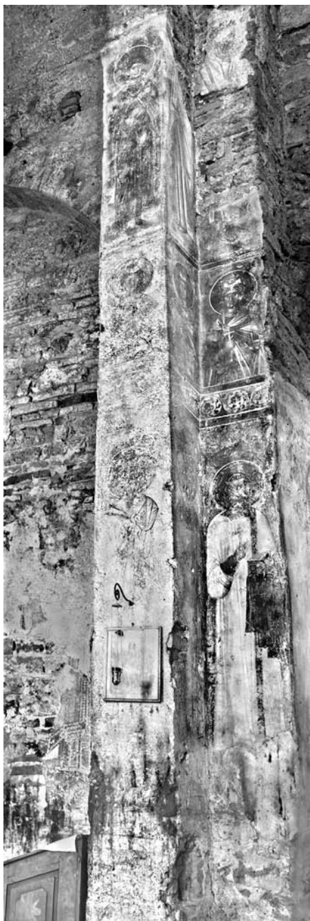
Сл. 11. Северозападни пошкунски стуб и северни зид Спасове цркве у Жичи