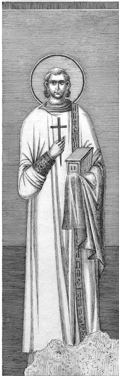
Сл. 13. Свети Авива, северозападни појкућолни пиласџар Сџасове цркве у Жичи, црџеж Драгужина Милужиновиџа Fig. 13. St. Abibas, the northwestern sub-dome pilaster of the church of Ascension in Žiĉa, drawing by Dragutin Milutinoviĉ

могуће с поуздањем одредити ни време њиховог настанка. Чини се, ипак, да их ваља узети у обзир при разматрању сликаног украса спољних зидова Жиче. 33