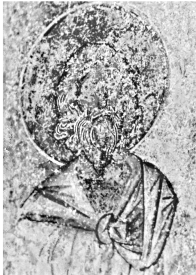
Сл. 14. Свети Гурија, деџаљ са слике 11 Fig. 14. St. Gourias, detail from the fig. 11

Током времена ишчезао је и живопис у лунети улаза на западном зиду наоса Спасове цркве. На основу акварела и цртежа Михаила Валтровиџа, 34 као и Петковиџевих описа, 35 знамо да се ту некада налазио лик Богородице Оранте. Владимир Петковиџ, међутим, није био сасвим сигуран при покушају хронолошког опредељења представе. Он је најпре фреске „из линета свих трију врата“ повезао са сликарством у певницама и, на даље, живописом у параклису куле датујући их у XIII век. Међутим, нешто касније допушта мугућност да све