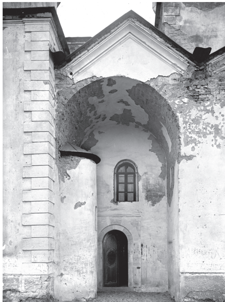
Сл. 6. Засведени простор између параклиса Светог Стефана и јужне њевнице Сјасове цркве у Жичи Fig. 6. Vaulted area between the parekklesion of St. Stephen and the southern choir

је вероватно била насликана у једној од бочних ниша трема. Стара фотографија показује остатак неке сцене, или неких сцена из циклуса посвећеног делатности светог Јована на источној страни нише у јужном зиду (сл. 5). Разазнатљиви су обриси пустињског пејзажа с брежуљцима и скромном вегетацијом. Најразложније је претпоставити да су у питању делови представе Крштења Христовог, о чему ће касније бити више речи. Епизода Христовог разговора с Јованом, међутим, чини каткад део шире представе Крштења. Можда је у Жичи била насликана у горњем делу нише на јужном зиду, непосредно изнад Крштења Господњег.