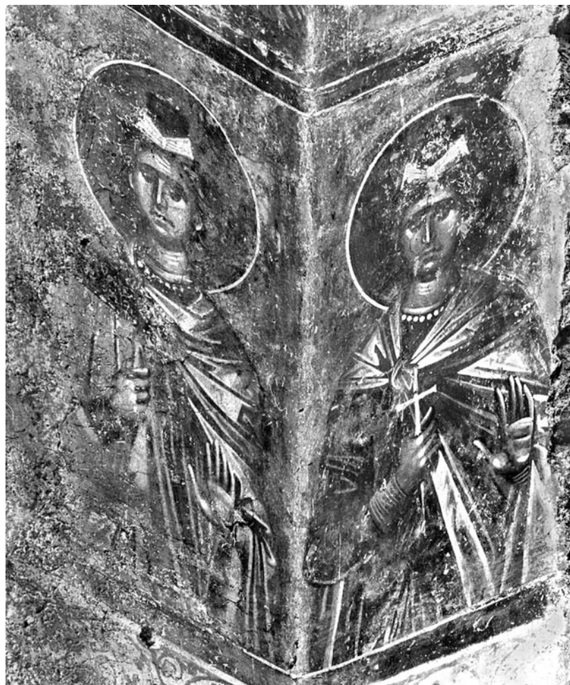
Сл. 16. Двојица јеврејских младића, северозападни појкућолни ѿласѿар Сѿасове цркве у Жичи Fig. 16. Two of the three holy Jewish young men, the northwestern sub-dome pilaster of the church of Ascension in Žiča