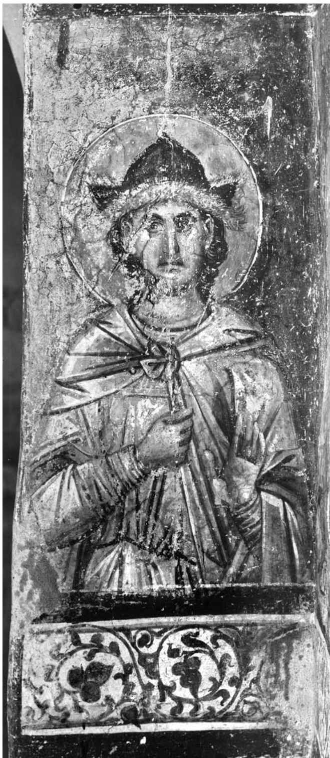
Сл. 17. Један из групе персијских мученика коју чине свети Мануил, Саваил и Исмаил, југозападни појкујолни њиласџар Сџасове цркве у Жичи