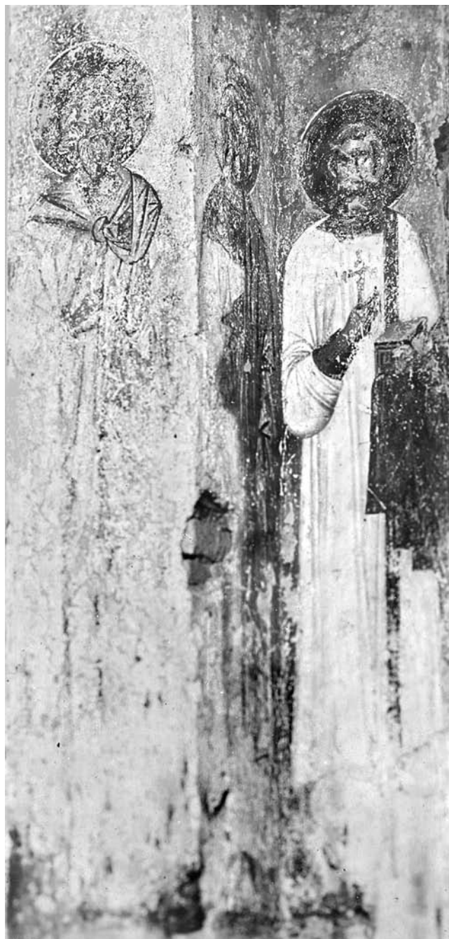
Сл. 12. Свети Гурија, Самона и Авиба, северозападни пошкунски стуб Спасове цркве у Жичи

Остављајући овога пута по страни сведочанства о неким другим уништеним остацима фресака у нартексу, пажњу ваља скренути на трагове сликарства фасада Жиче. Успомену на њих чува стара фотографија из збирке Народног музеја у Београду (сл. 6, 7). 32 На њој су видљиви доста скромни и тешко сагледљиви фрагменти фресака, који уверавају да је живопис с иконографским са-