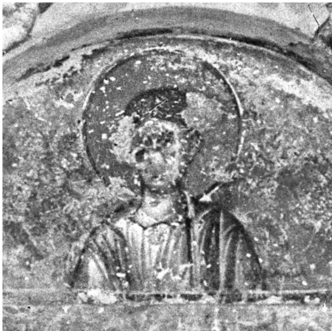
Сл. 3. Свети Стефан Првомученик, детаљ са сл. 2 Fig. 3. St. Stephen the Protomartyr, detail from the fig. 2

тим, није ваљано препозната. Она не може представљати разговор Христа и светог Јована Претече како је то помишљао Владимир Петковић, а што се прихвата у науци. 12 Особа наспрам светог Јована није имала нимб, није била одевена у хитон и химатион како би приличило Спаситељу. Осим тога, она подиже обе руке раширених шака (сл. 4), док је Христос у разговору с Крститељем на Јордану приказиван како десницом благосиља, а у левој руци обично држи свитак. 13 Насупрот томе, на сцени у жичкој припрати свети Јован, означен као с(ВЕ)Г(Ы) ІΩ(АН)Ъ , дизао је десницу у гесту благослова. Разматрана сцена у Жичи представља несумњиво једну од Претечиних проповеди Јудејима (Мт 3, 1–12; Мк 1, 4–8; Лк 3, 3–9, 3, 12–17; Јн 6–42). Таквом њеном одређењу одговарају не само амбијент призора, односно став тела и гест Крститеља, већ и одећа и гест саговорника из аудиторијума. 14 Делимична очуваност сцене, нажалост, не дозвољава да се она одређеније препозна. Ипак, на основу одеће човека који стоји наспрам светог Јована извесно је бар то да у питању није проповед војницима (Лк 3, 14).