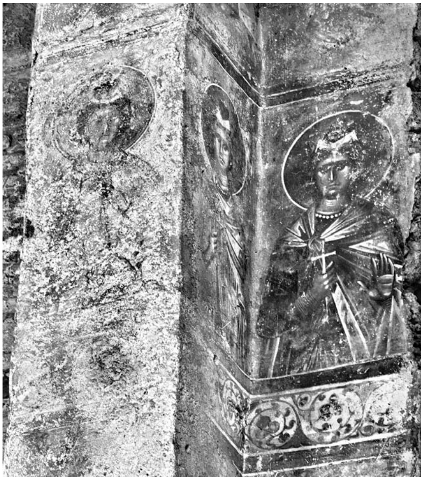
Сл. 15. Свети Ананија Азарија и Мисаил, северозападни појкућолни ѿласѿар Сѿасове цркве у Жичи Fig 15. Saints Ananias, Azarias and Misael, the northwestern sub-dome pilaster of the church of Ascension in Žiča

ђа јавља се само још на представама арханђела у лунетама изнад улаза у параклисе из наоса, датованим у XIII век. Зелени појас доњег дела позадине свих других светачких попрсја у лунетама у унутрашњости параклиса, осликаним почетком XIV века, знатно је виши и другачији. Закључак да је Богородичин лик у лунети припадао првобитном жичком сликарству има одређен значај за даља програмска тумачења. Он омогућује да се прихвати Петковићево објашњење прилично необичне појаве попрсја арханђела у лунетама изнад улаза у параклисе. Та попрсја чинила су истовремену и заокружену програмску целину управо с представом Богородице Оранте — целину уобличену у лунетама некадашње припрате. 40