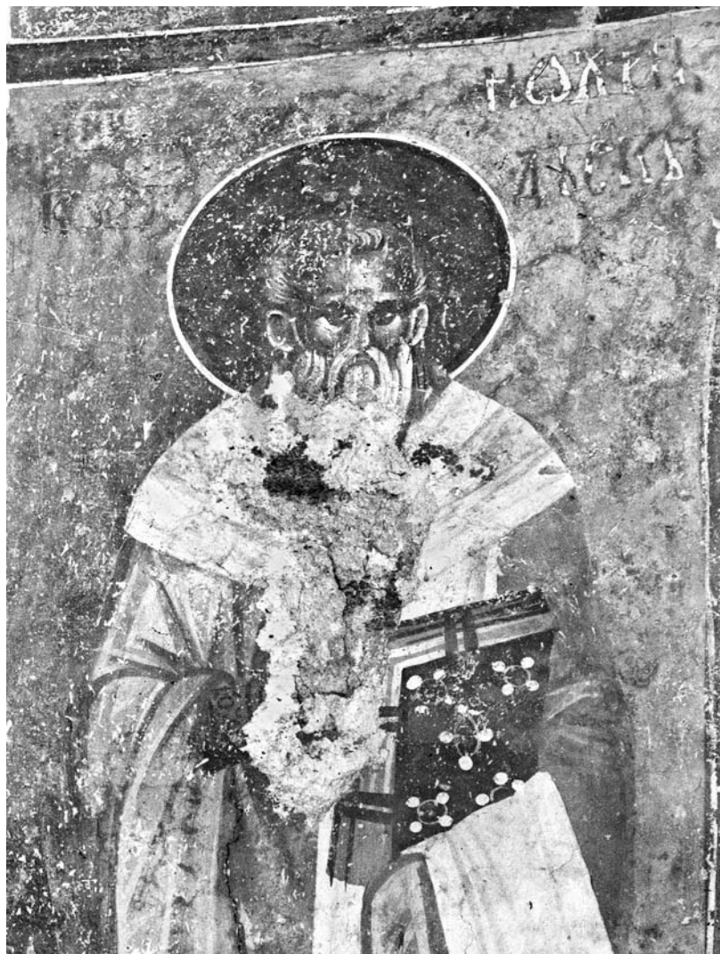
Сл. 20. Свети Климент Охридски, јужни зид олџарског џравеја Сјасове цркве у Жичи Fig. 20. St. Kliment of Ohrid, southern wall in the altar area of the church of Ascension in Žiĉa

Осим фресака у параклису Светог Саве, уништен је 1941. године и читав низ светачких ликова на странама северозападног поткуполног пиласџра. 50 Ту су у најнижој зони, осим светог Јована Крститеља на западном лицу пиласџра, 51 била насликана још тројица мученика (сл. 11, 12). На јужној страни основне масе пиласџра налазио се лик једног ђакона, 52 чији изглед бележи цртеж Драгутина Милутиновића 53 и фотографије Петковића (сл. 12, 13). 54 Уз њега су стајале фигуре двојице светих у племићким хаљинама. Лик средовечног мученика краће тамне браде и дуже таласасте косе красио је источну страну испуста на пиласџру. На њему су били дуга хаљина широког украсног оковратника и плашт пребачен преко левог ра-