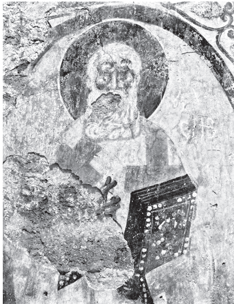
Сл. 10. Свети АѠанасије Александријски, деѠаљ са слике 8 Fig. 10. St. Athanasius of Alexandria, detail from the fig. 8

Разматрана фотографија је значајна и за разматрање ликовних особености сликарства жичке припрате. Она показује да су фреске на фасади јужног параклиса биле обновљене почетком XIV века и да је сликарство припрате знатно доследније но живопис наоса и приземља куле пратио стилске обрасце зреле ренесансе Палеолога. Фигуре су витке, лишене наглашене волуменозности и тежине, лаких су покрета. Цртеж је гибак и ненаметљив, а прелази са светлих ка сеновитим деловима волумена ублажени. Епизоде приче биле су укључене у јединствену композициону целину, издељене само еле-