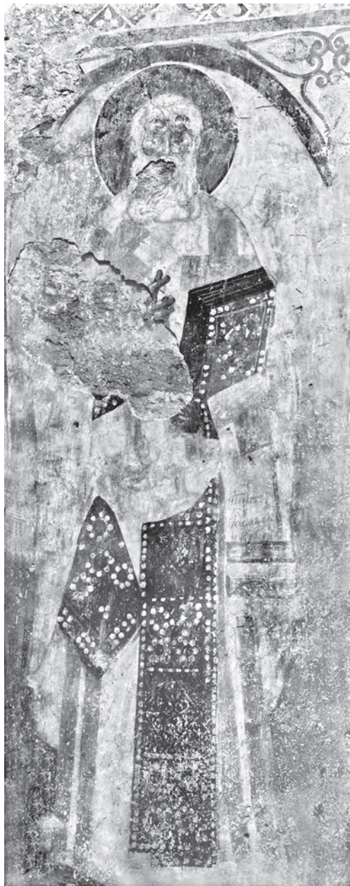
Сл. 9. Свети АѠанасије Александријски, северни параклис СѠасове цркве у Жичи Fig. 9. St. Athanasius of Alexandria, the northern parekklesion of the church of Ascension in Œiĉa

тоусти. У беседи посвећеној Крштењу Спаситељевом он вели: “Ово је дан у који се крсти (Христос) и освети природу воде; стога у поноћ овог празника сви узимају воду освећену тада, носе је кући и чувају целе године.” 27 Исто тако, у молитвама и чтењима током чина Великог освећења воде непрестано се указује на крштење Христово, као на изворну тајну. Призива се тада управо Господ који је осветио дубине Јордана да изнова преко воде искупљења, дејством Духа Светога, излије благодат на свој народ, односно да „ниспошље благослов Јорданов“. 28