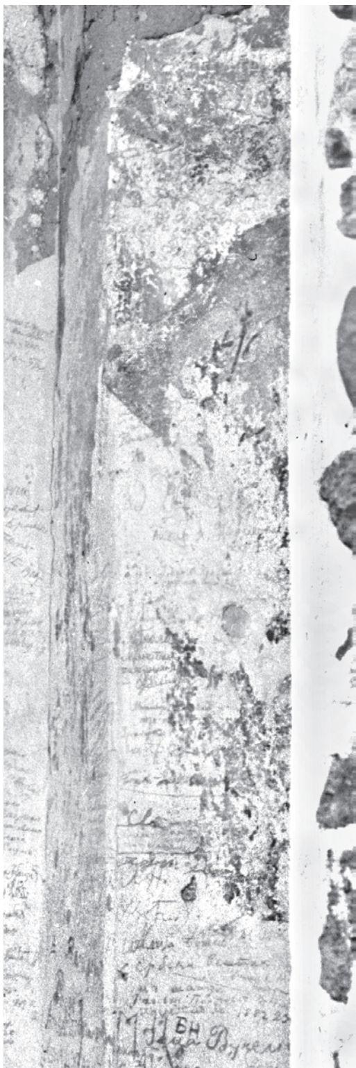
Сл. 5. Остатак сцене из циклуса делатности светог Јована на Јордану, детаљ са сл. 2 Fig. 5. Remnant of the scene from the cycle illustrating the activities of St. John the Baptist on the River Jordan, detail from the fig. 2

је вероватно била насликана у једној од бочних ниша трема. Стара фотографија показује остатак неке сцене, или неких сцена из циклуса посвећеног делатности светог Јована на источној страни нише у јужном зиду (сл. 5). Разазнатљиви су обриси пустињског пејзажа с брежуљцима и скромном вегетацијом. Најразложније је претпоставити да су у питању делови представе Крштења Христовог, о чему ће касније бити више речи. Епизода Христовог разговора с Јованом, међутим, чини каткад део шире представе Крштења. Можда је у Жичи била насликана у горњем делу нише на јужном зиду, непосредно изнад Крштења Господњег.