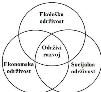
Slika 2. Međusobna uslovljenost dominantnih dimenzija održivog razvoja

Pogledajmo sada drugu, još popularniju shemu održivog razvoja (Slika 2). Ona u vidu Venovih dijagrama prikazuje tri identična kruga (ili elipse) koji se međusobno preklapaju. Svaki element održivosti je predstavljen kao zasebno polje, što ukazuje na pojedinačni značaj sve tri dimenzije održivog razvoja. Preklapanje polja označava međusobnu uslovljenost ova tri sistema, dok zajednički podskup u centru dijagrama odražava zamisao da jedino sinergija sva tri aspekta održivosti vodi održivom razvoju. Ovaj prikaz je koristan ukoliko želimo da ilustrujemo ulogu složenog spleta uzajamnih uticaja, a da pritom zadržimo predstavu o relativnoj