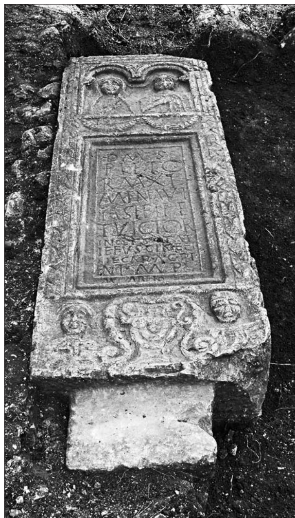
Сл. 1. Фронтиална страна ципуса са представом кантароса