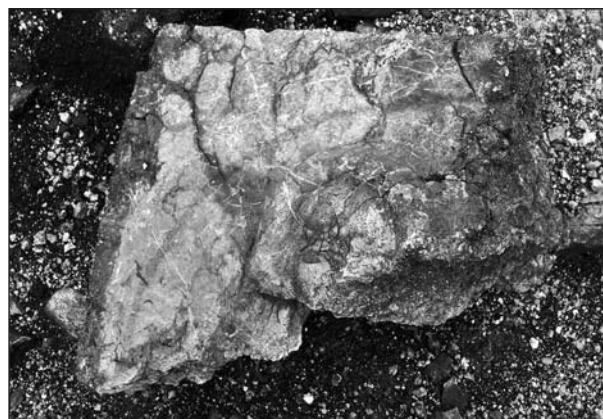
Сл. 7. Фрагмент стеле из сеоског гробља у Отиловићима