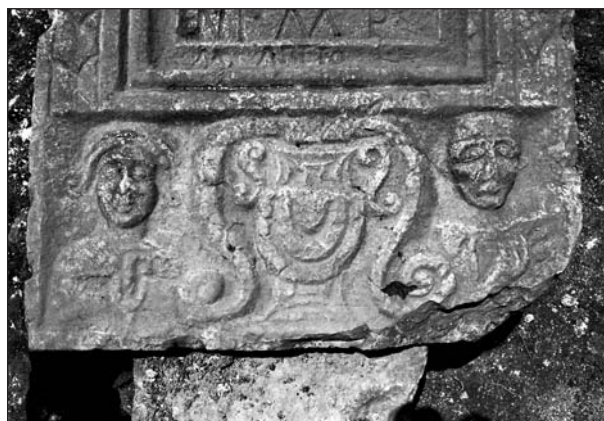
Сл. 5. Фронтална сцрана сцелеле – најшцисно поље и предсцтава покојника у соклу Сл. 6. Предсцтава у соклу