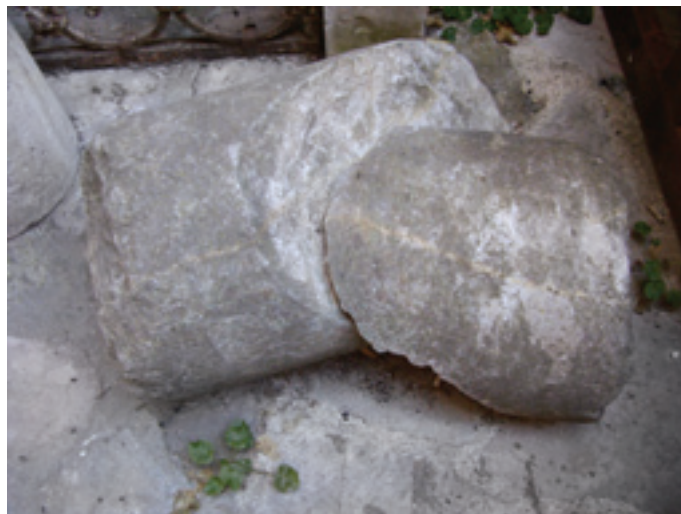
Сл. 4. Кошор, лайндаријум, остаци сџубова носача кџйоле (И. Сџевовић)