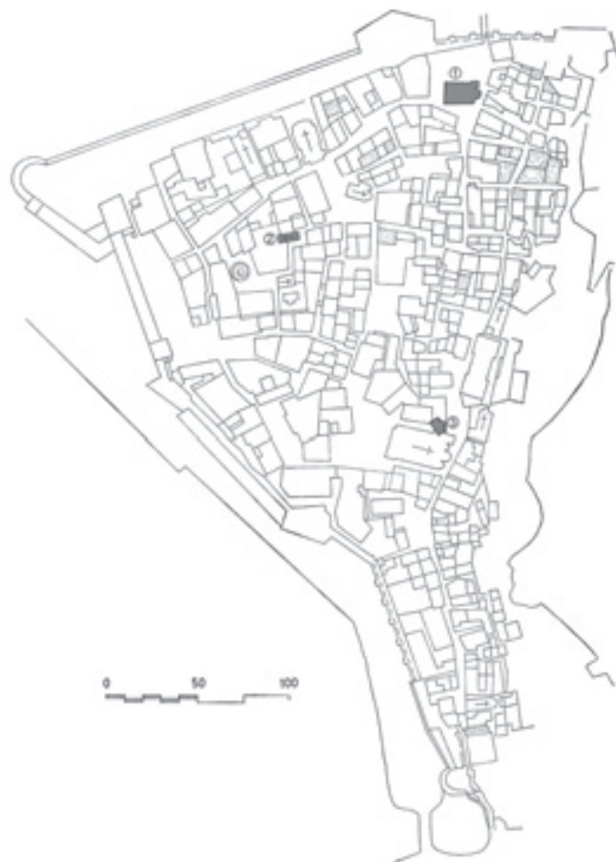
Сл. 1. Котор, основа средњовековној града са обележеним местима рановизантијске базилике (1), цркве испод каснијеј храма Светио Михаила (2) и цркве ујисаној крсти испод градске катедрале (3) (М. Чанак-Медић, Архитектура Немањиној доба II , арх. Г. Толић)