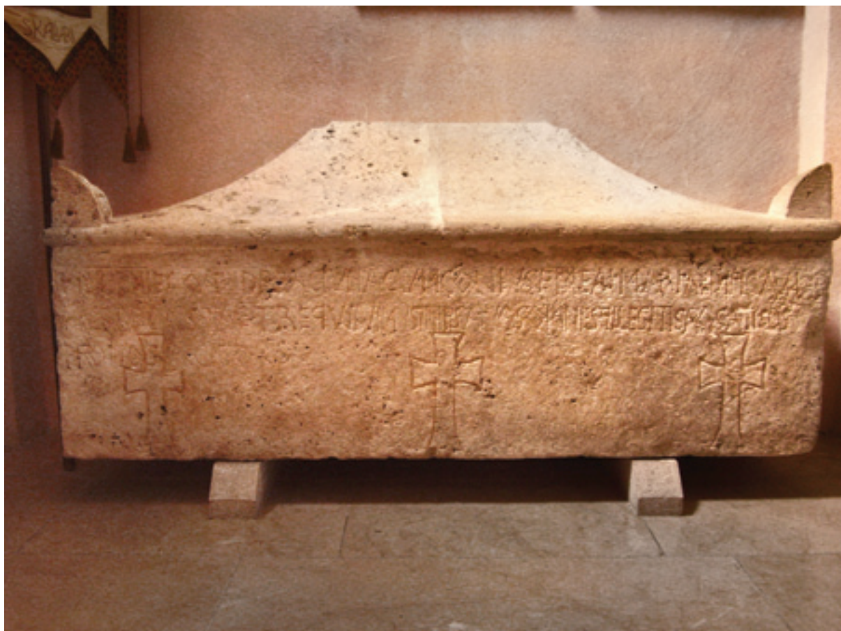
Сл. 6. Коџор, катедрала, саркофаг откривен у близини остатака цркве испод катедрале (И. Стевовић)