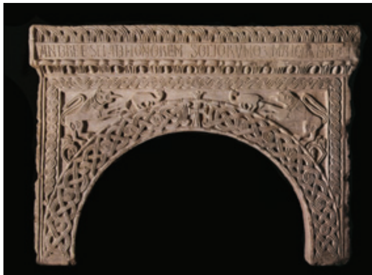
Сл. 7. Коџор, лапидаријум, аркада са уклесаним именом свештог Андрије Стрателата (З. Чубровић)