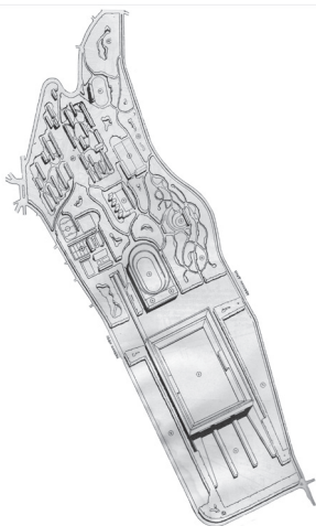
Слика 3 Никола Добровић, Скица Фискултурног појаса , 1946; извор: Dobrović, N. (1950) Urbanizam kroz vekove I – Jugoslavija , Београд: Научна књига.

Вежбалиште, ондосно слетиште, било је предвиђено да заузима површину од 260.400 м 2 (620 x 420 м), што је подразумевало капацитет од 80.000 вежбача и 250 до 300.000 гледалаца. Олимпијски стадион би био површине 57.000 м 2 (300 x 190 м) са капацитетом за 100.000 гледалаца. Терени за излучно такмичење обухватали су терене за фудбал, тенис, одбојку, кошарку, отворени базен итд. У оквиру Спортске палате били су предвиђени гимнастичка дворана, сала за бокс, зимски базен, покривени терени за разне спортове, као и ледена дворана. Фискултурно село је требало да служи за смештај спортиста за време националних и међународних такмичења, а такође би било добро повезано градским саобраћајем. Читав појас је требало да буде пешачка зона, док би директна саобраћајна веза са старим градским језгром и још важније Политичко-спортским стадионом била метро линија чија би крајња станица била испод Олимпијског стадиона. 44