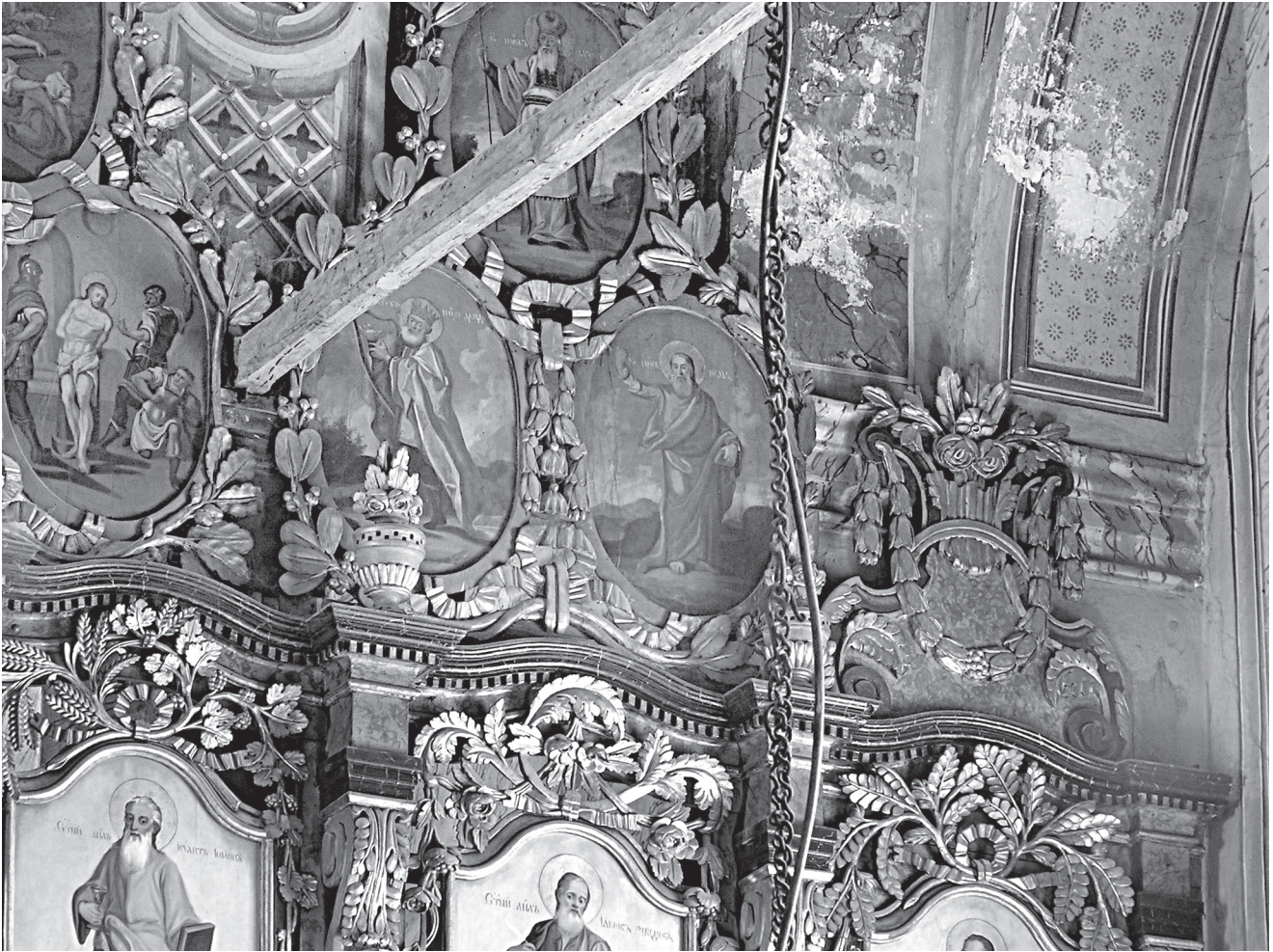
8. Страдања Христова, трећа зона, иконостас цркве Рођења Богородице, Стефан Гавриловић, Илија Гавриловић, Сремска Каменица, 1800–1802. године