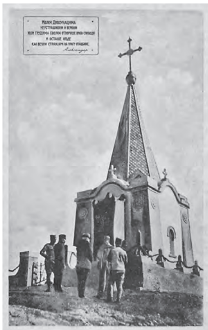
Слика 4. Јанко Шафарик, Спомен-капела на Кајмакчалану, планина Ниџе, Северна Македонија, 1918. (разгледница)

(сл. 4). Спомен-капелу је осветио владика Варнава, 17. септембра 1918. године, након пробоја Солунског фронта. Том приликом регент Александар I упутио је следећи проглас војсци: „На данашњи дан, када се освећује црква, коју сам наредио да се подигне на врху Кајмакчалане као споменик палим херојима који су на томе месту отворили капију кроз коју води пут, којим данас греди наша непобедима војска, мојим јуначким дринским пуковима шаљем са ових висина мој поздрав, а палим херојима на Кајмакчалану, нека је слава“ (Са Кајмакчалане, 19. септембар 1918). Над улазом у капелу исписана је посвета регента Александра: „Мојим див-јунацима неустрашивим и верним, који грудима својим отворише врата слободе и осташе овде као вечити стражари на прагу Отаџбине.“ Да би се сачували посмртни остаци бројних палих ратника,