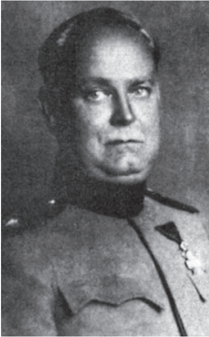
Слика 1. Архитект Јанко Шафарик (1882, Београд – 1949, Београд)

монтажне позорнице намењене војничким свечаностима (Кадивић, 1996, 37–39).