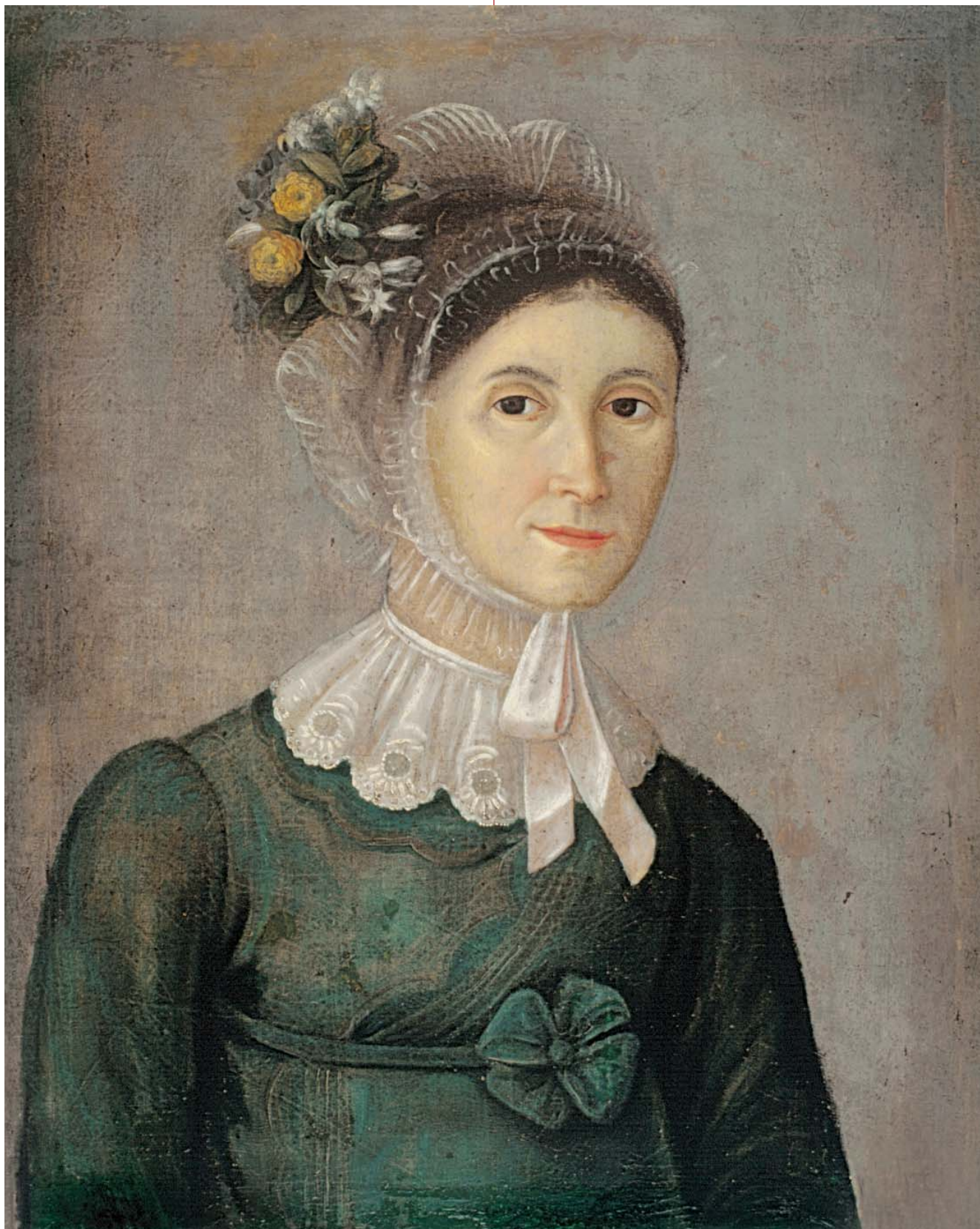
1. Жена у зеленом, Аксентије Јанковић, око 1820, Галерија Матице српске у Новом Саду 1833/637