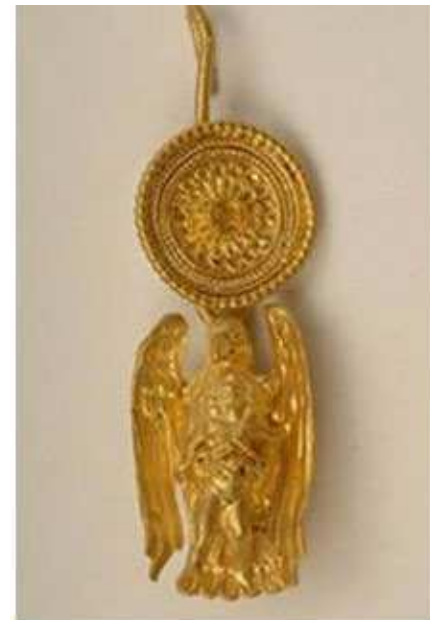
Sl. 2. Zlatni nakit sa predstavom Zeusa

Nisu samo muzeji bili ti koji su otuđili predmete od svog matičnog mjesta. Česti su bili i uplivi privatnih lica željnih ovog bogatstva. Zlatni nakit koji je pronađen u Budvanskoj nekropoli danas je većinom u privatnom vlasništvu, dok se jedan dio nalazi u Arheološkom muzeju u Budvi. Obrada nakita govori da je urađen u helenističkoj radionici Velike Grčke ( Magna Graecia ) u trećem vijeku prije naše ere. Dva medaljona sa likovima Dionizijevog kulta, od kojih jedan prikazuje Arijadnu čija je kosa dekorisana bršljenovim