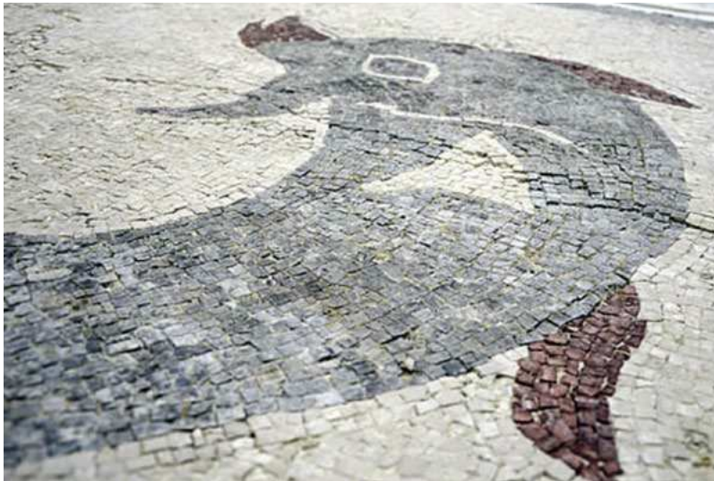
Sl. 7. Rimski mozaik sa predstavom delfina, savremeni snimak