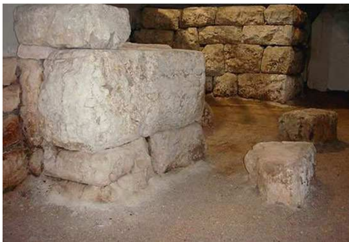
Levo: Sl. 3. Najstariji bedemi sa ulaznom kapijom antičke Budve