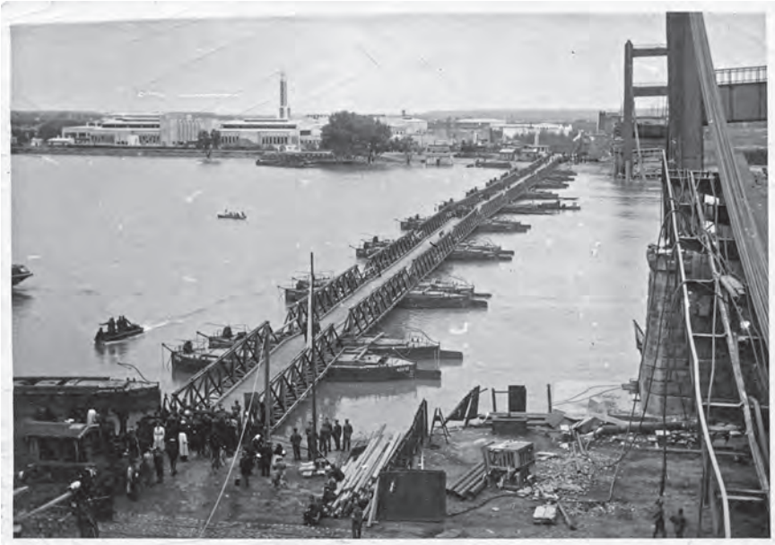
Слика 3. Срушени ланчани мост на Сави априла 1941. године. Поред срушеног, Немци су изградили понтонски мост. У првом плану фотографије виде се група немачких војника, три чамца у води, а у позадини панорама Старог сајмишта.

значило и затварање логора већ само промену његове намене (сл. 3). Наиме, на пролеће 1942. године Сајмиште прераста у привремени логор за политичке затворенике, заробљене партизана и принудне раднике, од којих је већина касније депортована у Норвешку, Немачку или мање радне логоре у централној Србији. Сајмиште је званично напуштено 6 у јулу 1944, пошто је за време савезничког бомбардовања те године директно погођено, при чему је погинуло између 80 и 120 логораша, а преостали заточеници су пребачени у друге логоре (Koljanin, 1992).