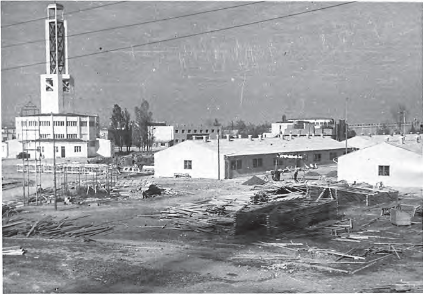
Слика 4. Изглед појединих објеката на Старом сајмишту 1947. године.

није урађено ништа на меморијализацији тог простора. Поједини павиљони, оштећени у бомбардовању, срушени су, а у преостале су током изградње Новог Београда смештани припадници омладинских радних акција, потом уметници, а на крају чак и грађани нерешеног стамбеног питања (сл. 4). Прве спомен-плоче, универзалне садржине и без помена холокауста 7 , постављене су тек 1974. и 1984. године (Bajford, 2011). Разлог за то лежи у чињеници да су у памћењу и сећању на Други светски рат приоритет имала места отпора у односу на места страдања. Тако су редовно обележавани локалитети борбе и битака Народноослободилачке војске и илегалца, док је комеморација локација страдања цивила била на другом месту. Радовић (2006, 151) о томе бележи: