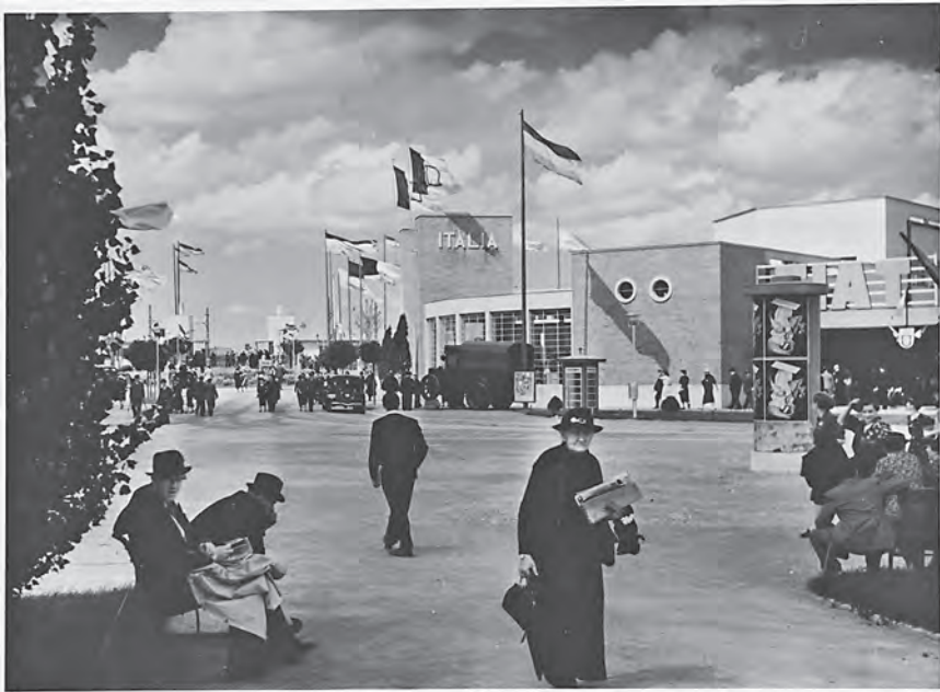
Слика 2. Атмосфера са првог сајма, одржаног 1937. године.

време, који је коришћен за обуку падобранаца из свих делова Југославије. Но, истовремено, Београдско сајмиште није било само место забаве или симбол технолошког напретка – оно је служило и политици. Тако су немачка и италијанска влада користиле павиљоне како би промовисале начела нацистичког и фашистичког режима. Нацистичке заставе, али и кукасти крстови били су саставни део немачке репрезентације (Јеврејски логор на Београдском сајмишту, 2008). Таква естетика је можда донекле и наговестила његову будућу употребу. Наиме, шест месеци након окупације, пошто је пре тога било потпуно испражњено, Сајмиште, које се поделом Југославије од октобра 1941. године налазило у Независној Држави Хрватској, постало је логор. Бодљикава жица постављена је по ободу локалитета, у павиљоне су унете скеле које су биле предвиђене да симулирају кревете на спрат, а команда је оформила штаб у Централној кули (Вајфорд, 2011).