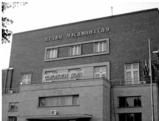
Ђ. Табаковић, Соколски дом у Новом Саду, 1936

опусу је Ђорђе Табаковић (Митровић, 2005). Осим соколских домова у Кикинди (1932), Сремским Карловцима (1938) и Инђији (1939), посебно се истиче Табаковићев Соколски дом у Новом Саду из 1936. године (слика 3). Подигнут у модерничком духу и озидан црвеном опеком, новосадски Соколски дом представља масивну грађевину, изразито хоризонтално наглашену, са тракасто застакљеним вертикалним прозорима који разбијају њену кубичност и тежину. Дизајнирани детаљи, попут портала и улазних врата, упућивали су на чињеницу да је Табаковић, као и многи модернисти, тежио тотал дизајну. Соколски домови које је Ђорђе Табаковић пројектовао рефлектовали су чист минималистички архитектонски израз.