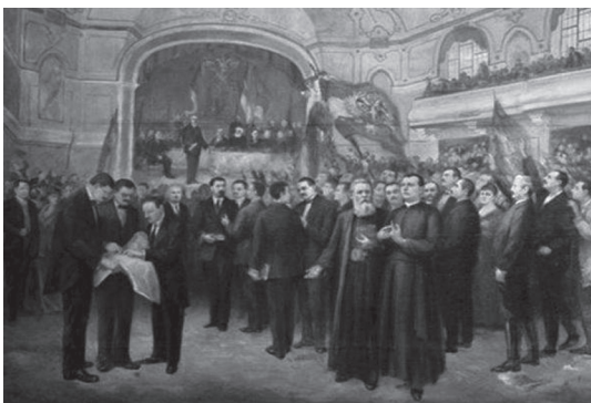
Слика 4. Анастас Боцарић: Велика народна скупштина (чува се у Музеју Војводине)

Банат, Бачка и Барања у границама, које повуче Антантинa балканска војска, проглашује се данас 12/25. новембра 1918. на Великој народној скупштини на основу узвишеног начела народног самоодређења оцепљеним, како у државноправном, тако и у политичком и привредном погледу од Угарске. 20