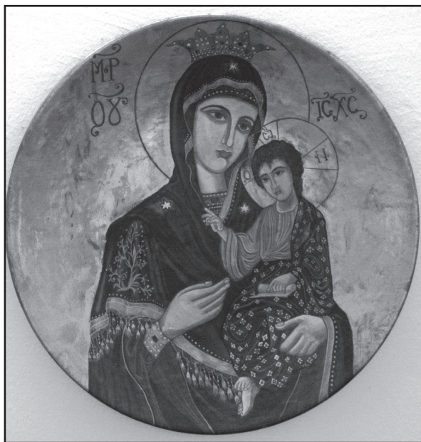
Јазмина Кланица, Богородица са Исусом Христосом , комбинована техника на бакарном тањиру, пречник 30 цм, 2006. година

Key words: Ignjat Pavlas, The Great National Assembly of Serbs, Bunjevci and other Slavs in Banat, Bačka and Baranja, First World War, Serbian National Council, Novi Sad