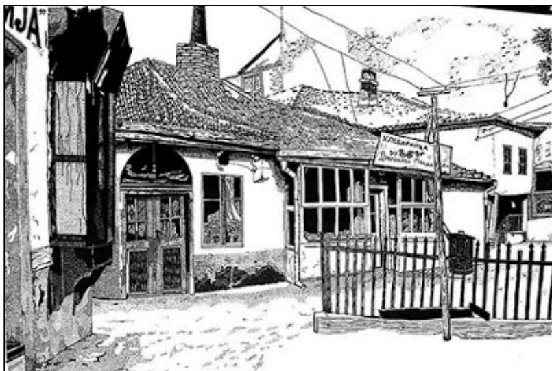
Детаљ из краја код Варош капије