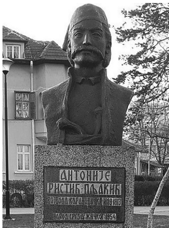
Биста у Парку Пљакин Шанац, у близини Ибарског моста у Краљеву, аутор: Lotom

Поменути старешина био је насилан према свима, и према својој супрузи: