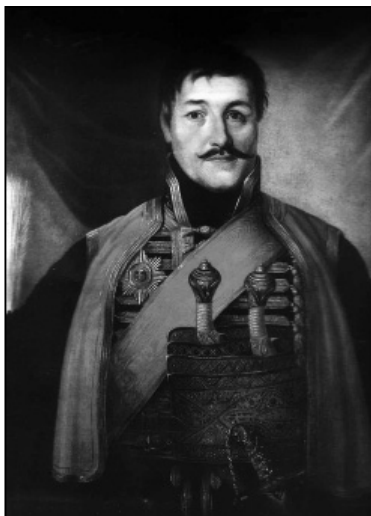
Карађорђе Петровић, портрет Владимира Лукича Боровиковског из 1816. године