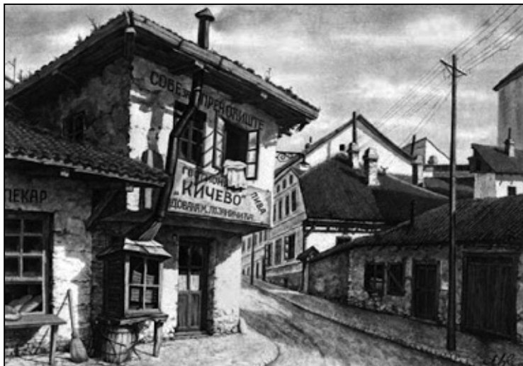
Детаљ из Сава мале