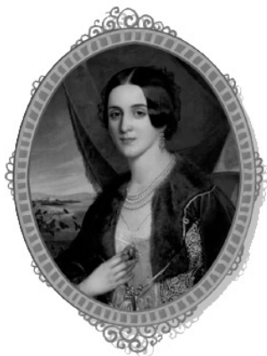
Анка Обреновић, непознати аутор, средина 19. века