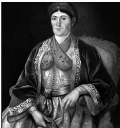
Кнегиња Љубица Обреновић, Урош Кнежевић, 1850.