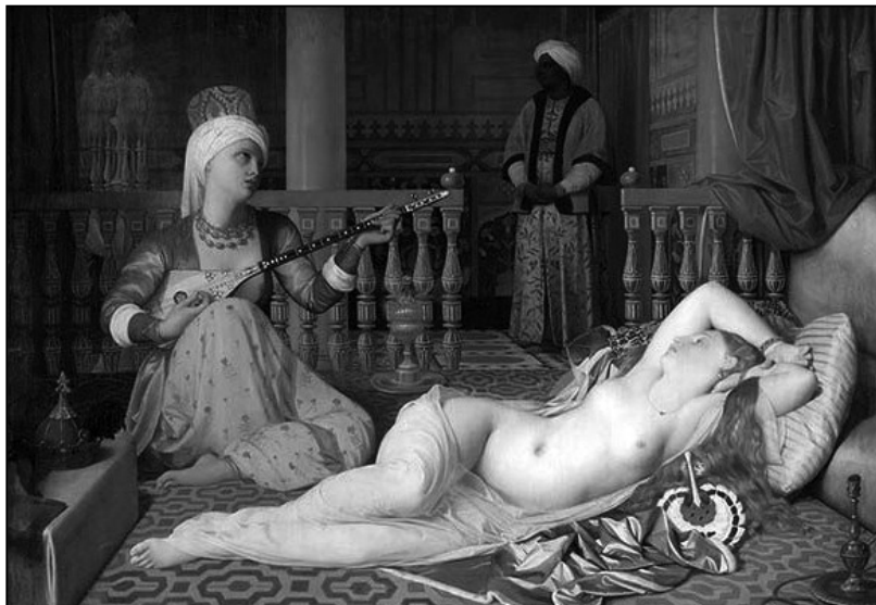
У харему, Жан Август Доминик Енгр (1789–1867)

вод. Наводе се случајеви немачких жена из времена романтизма, које су се управљале „према истинским осећањима и покретљивошћу коју оне уводе. [...] Бројни су примери оних које су то доживеле и захтевале са достојанством, снагом и стилем, спремне да плате цену својих поступака.“ 34 Мирослав Тимотијевић наводи, говорећи о Србији у време прве владавине кнеза Милоша, „да према традиционалним патријархалним конвенцијама жени није било место у јавном простору. У Хабзбуршкој монархији она је то право изборила већ у току 18. века.“ 35 У Београду је 1830-их доминирало оријентално понашање, врло је мало било женских особа на улици.