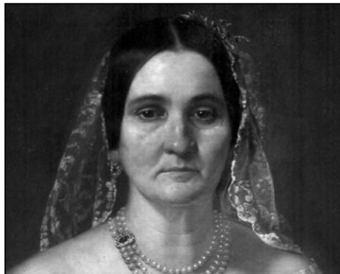
Томанија Обреновић, Аристид Економа, средина 19. века

Конак кнегиње Љубице, изграђен између 1829. и 1831, био је простор у којем је кнегиња Љубица 1830-их била господарица. То је било место породичног живота, најистакнутији простор намењен женама у Београду, у којем је кнегиња окупљала српске госпође и истакнуте жене из османско-муслиманске заједнице. У диванхани у приземљу вођени су званични разговори. Исти простор на спрату могао је да има и приватну функцију, јер Анка Обреновић говори о окупљању на пријему поводом рођендана Милана Обреновића, када је на диванани стојала већа група жена, а у средини Милан Обреновић. Конак је био опремљен према османско-балканским обичајима, уз присуство европског намештаја. Постоје описи кнегињине собе и пријема барона Ливена. У конаку је доминирала кнегиња Љубица и он је функционисао као женски простор, организован према налозима кнегиње. 61 У животу на двору посебан акценат стављан је на неговање народне