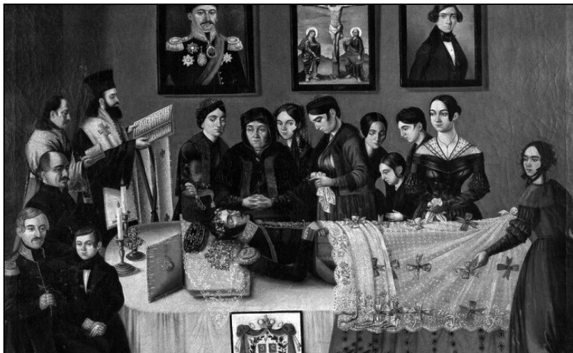
Кнез Милан на одру, Јован Исаиловић Млађи, 1839.

културе и патријархални модел понашања. На тај начин се кнежевски пар и њихова породица потврђивала као прави представник српског народа. Кнегиња се трудила да у приватном понашању остави утисак сваке врлине, те да жене у Србији сачувају једноставност старих обичаја. 62