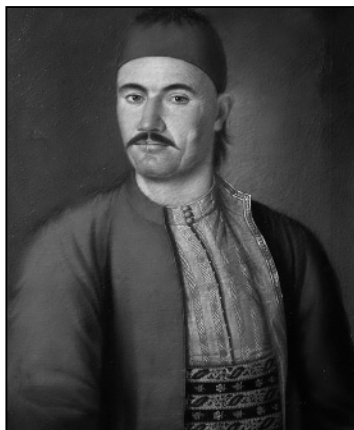
Кнез Милош, Павел Ђурковић, 1824.