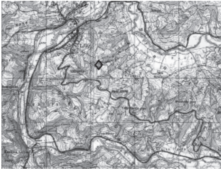
Слика 1. Положај Маџарског гробља са околином

Kukosch . 6 Треба напоменути да је у то време, али и дуго након ослобођења од Турака, село Гукош било једино насеље које се јавља у изворима, због чега неки аутори сматрају да је имало и одлике централног места овог краја. 7 Почетком XIX века, Гукош се помиње као насеље са 50 (1818. године), односно 48 кућа (1822. године). 8 Такође, тада није постојала ни данашња варошица Љиг, већ је насеље „на Љигу” тек 1922. године проглашено за варошицу, 9 иако су хидроним и жупа Љиг ( Lugh или Ligh ) у оквиру Мачванске бановине познати у XIV и XV веку. 10