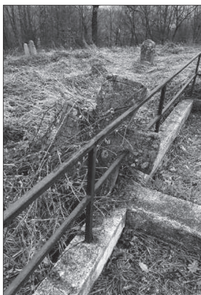
Слика 7. Надгробник инкорпориран у конструкцију ограде савремене гробне парцеле