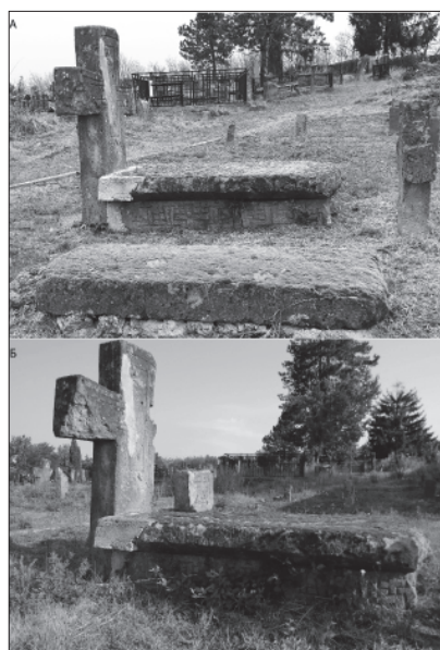
Слика 8. Савремене интервенције на надгробнику и стање надгробника пре и после механичког ошећења