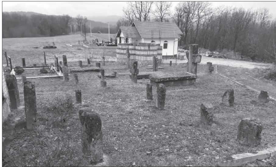
Слика 9. Положај триконхалне грађевине у току изградње са околним нововековним споменицима

заштите споменика, често се надгробницима рукује на неадекватан начин. То се огледа у нестручној конзервацији споменика, њиховом инкорпорирању у данашње гробне целине и релокацији, што утиче и на деструкцију старог гробља. Осим „бриге” о споменицима, примећују се и њихова деструкција и оштећења као последице изградње нових објеката и уклањања гробова на месту старог гробља. С обзиром на то да се данашње гробље пружа и ван опсега старог, поставља се питање да ли постоји потреба његовог ширења и у том правцу.