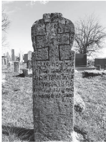
Слика 2. Тип стеле-усадника типичних за 19. век на гробљу у Гукошу, са натписом и годином 1838

Како су качерска села разбијеног брдско-планинског типа, није неуобичајено да се у једном налази више гробља, односно да сваки заселак има своје гробље. Тако је у Заграђу 10 гробља, на Руднику седам, у Белановици и Гукошу по четири, у Војковцима, Живковцима и Штавици по три, а у осталим местима