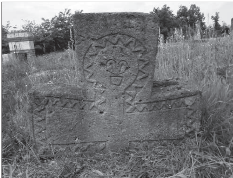
Слика 5. Тип усадника – крста са представом стилизоване људске фигуре

фигуре. За тај тип декорације је карактеристично то што је цела представа уоквирена цикцак линијом. На лицима фигура су истакнути само очи и насмејана уста, а понекад су приказани и бркови (Слика 5). Такав вид украшавања јавља се најчешће на усадницима – крстовима, затим на усадницима – стелама, обично на њиховој западној страни. Споменици са поменутом декорацијом су типични скоро искључиво за руднички крај, односно за потес од Прањана преко Горњег Милановца до Љига. 24