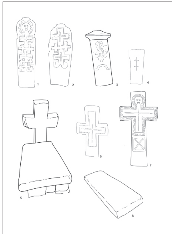
Табла 1. Групе надгробника (аутор: И. Кајтез)

Као посебан тип надгробника издваја се комбинација плоче и усадника. Најчешће је то комбинација крста и плоче са постољем (Табла 1/5), и то су најмонументалнији споменици на Маџарском гробљу.