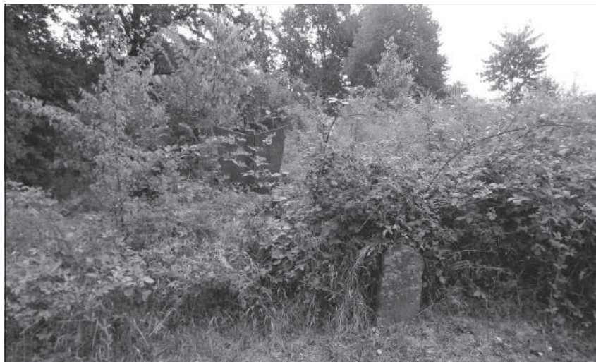
Слика 6. Вишегодишња вегетација која прекрива један део гробља