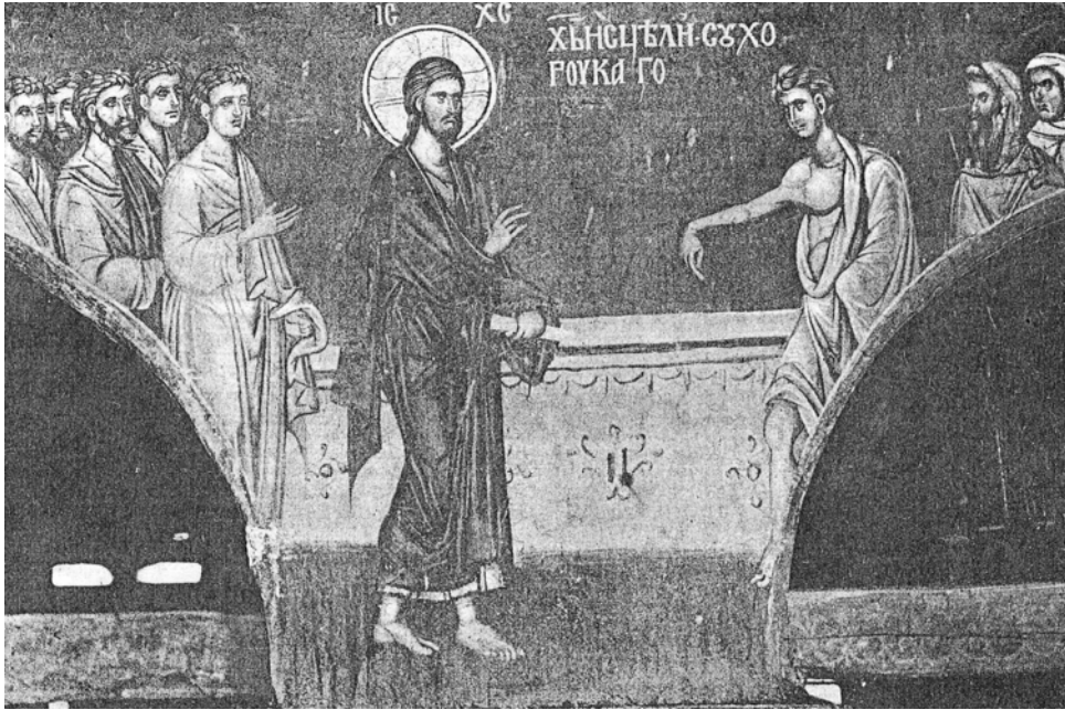
4) Исцелјење човека са сувом руком, Дечани, 1339-1340.г