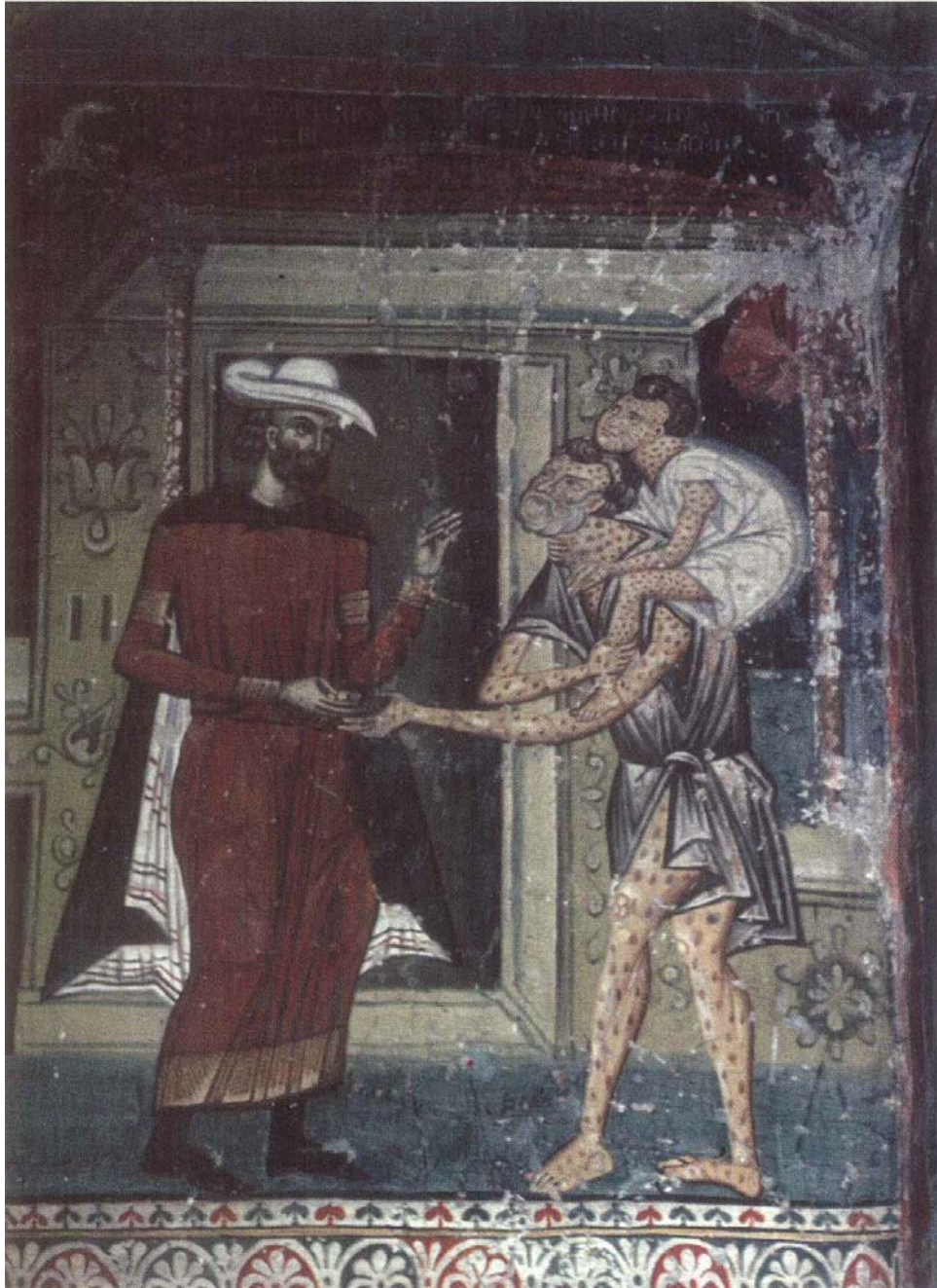
3) Чудо са кривоклетником, Лесново, 1340/1341-1346/1347.г