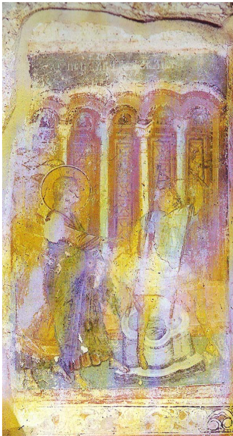
1) Исцељење раслабљеног у бањи Витезди, припрата Сопћана, 1338-1346.г