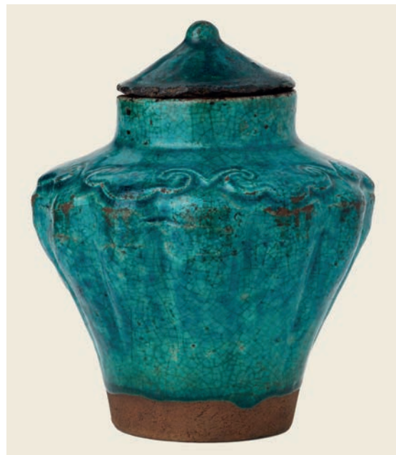
Посуда с ђоклојцем, керамика, Минг династија (1368–1694), Мелбурн, Викторијина национална галерија

Током историје Кинези су створили различите и бројне предмете од жада: обредни жад је употребљаван приликом обреда приношења жртве небу и прецима и у другим церемонијама; хијерархијски жад је указивао на друштвени положај (појасеви и постеље од жада); фунерарни жад је служио да сачува тело од пропадања, јер се веровало да он чини тело и душу бесмртном, као и да може да помогне души да се успне на небо и задобије нов живот. На површини предмета од жада клесани су мотиви који су имали профилактичку функцију, уско повезану са природом или са боговима. Жад је сматран медијумом коришћеним да повеже људе са боговима. Такође је био симбол моћи и статуса, врлине и моралног понашања и амблем богатства. У неолитско доба предмети од жада су прављени за богове, од периода династија Сја и Шанг до династија Хан – за краљеве, од времена династија Суи и Танг до династија Минг (1368–1644) и Ђинг (1644–1911) – за народ, док је у модерна времена традиционална култура жада наслеђена и негована. Од жада су и различити украси, намештај, музички инструменти, оружја, алати и други предмети.