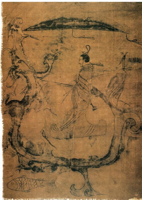
Човек јаше змаја, слика на свили, период Зараћених држава (475–221. год. пре н. е.), Чангша, Музеј провинције Хунан

Будући да су ратови били чести у древној Кини, одбрана града је била важна за његов опстанак. У најранија времена, градски бедеми су били грађени од дрвених ограда, камења скупљених на гомилу или од набијене земље. Пре династије Сонг (пре 960), бедеми су ретко били грађени од опеке. Након династије Минг бедеми од опеке су постали још распрострањенији. Древни град Пинг Јао у провинцији Шанси један је од најочуванијих градских бедема у Кини (872–782. год. пре н. е). И Кинески зид, јединствено архитектонско здање у историји кинеске и светске архитектуре, имао је одбрамбену функцију – био је грађен ради одбране краљевстава од племена са севера. У III веку пре н. е. први цар династије Ћин, Ћин III Хуанг ујединио је и повезао у целину деонице зида саграђене у ранијим периодима. Зид је и у каснијим раздобљима дограђиван, а последње доградње извршене су у време династије Минг. Дужина свих делова зида у целини износи 54 000 km.